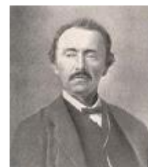
4. Ο Ερρίκος Σλήμαν (1822 - 1890) παντρεύτηκε Ελληνίδα και έκτισε στην Αθήνα το «Ιλίου Μέλαθρον» όπου σήμερα στεγάζεται το Νομισματικό Μουσείο.