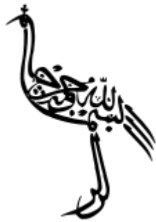
Ζωομορφική αραβική απόδοση καλλιγράμματος