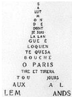
Ποίημα του Γκιγιώμ Απολλιναίρ με τη μορφή του πύργου του Άιφελ