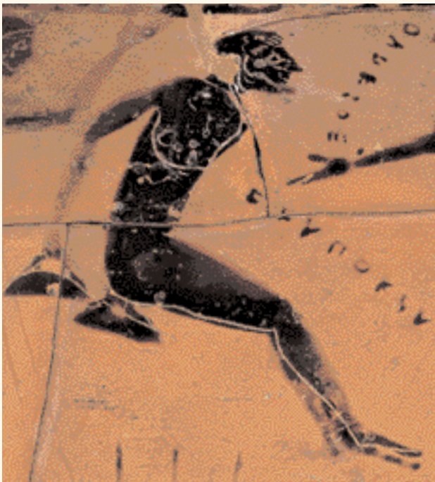
Ένας Έλληνας αθλητής ζωγραφισμένος πάνω σ' ένα αγγείο, με το όνομά του γραμμένο δίπλα.

رأيت في منامه الأسى امرؤاً جالساً على درجات الهيكل ، وكان جالساً معها رجلان ، واحدٌ من يمينها والآخر من يسارها يفترون إليها . فقد لاحظت خصماً أن وجهها اليميني كالت شامية ، وأن وجهها اليسرى كالت منوردة .