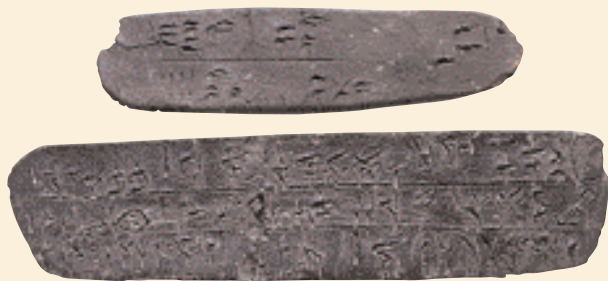
Δύο πινακίδες γραμμένες στη Γραμμική Β. Η μικρότερη καταγράφει πόσα πρόβατα υπήρχαν στη Φαιστό και η μεγαλύτερη περιγράφει μια προσφορά λαδιού προς τους θεούς.

Η Γραμμική Β δεν ήταν η πρώτη αρχαία ελληνική γραφή.