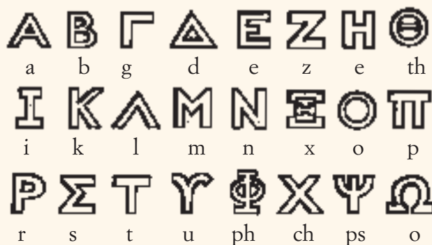
Το αρχαίο ελληνικό αλφάβητο

είχαν εμπορικές σχέσεις, άρχισαν να το αντιγράφουν και να προσθέτουν φωνήεντα στο νέο αλφάβητο. Η γλώσσα τους είχε ανάγκη από γραπτούς ήχους φωνηέντων, γιατί διαφορετικά θα μπερδεύονταν. (Φαντάσου ότι γράφεις «πδ» και ελπίζεις ότι οι άνθρωποι μπορούν να καταλάβουν ότι εννοείς «παιδί» και όχι «πόδι» ή «πηδάω», «επειδή»...) Όταν προσθέτεις φωνήεντα, όλα γίνονται σαφέστερα. Το αρχαίο ελληνικό αλφάβητο είχε 24 γράμματα: