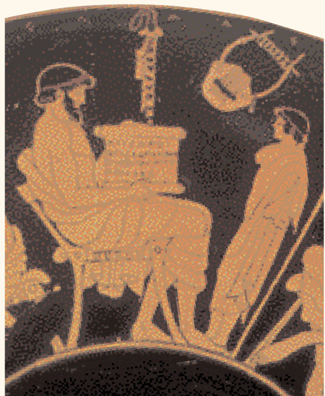
Ένας μαθητής της αρχαιότητας μαθαίνει να διαβάζει και να γράφει. Ο αγγειογράφος ζωγράφισε το αγόρι και το δάσκαλο σε ένα πήλινο κύπελλο.

Μάλλον οι Έλληνες αποφάσισαν γύρω στο 600 π.Χ. να γράφουν από τα αριστερά προς τα δεξιά, όπως γράφουμε σήμερα. Ξέρεις άλλα είδη γραφής που γράφονται από τα δεξιά προς τα αριστερά;