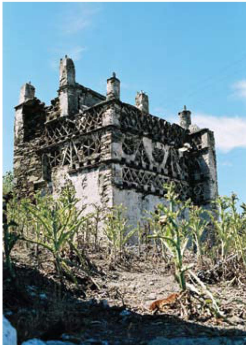
Περιστεριώνας. Τήνος (προσθήκη της ελληνικής έκδοσης, φωτ. Καλλιόπη Κύρδη)

Αυτό το τεράστιο έργο από γρανίτη βρίσκεται στο Βερολίνο, μπροστά από τη σκάλα του Παλιού Μουσείου.