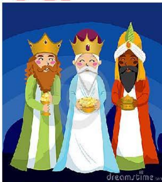
Οι 3 μάγοι