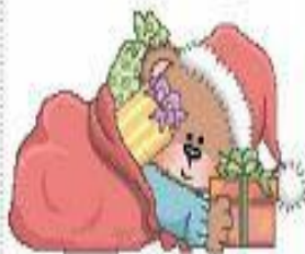
Ο σάκος του Αι - Βαούλη