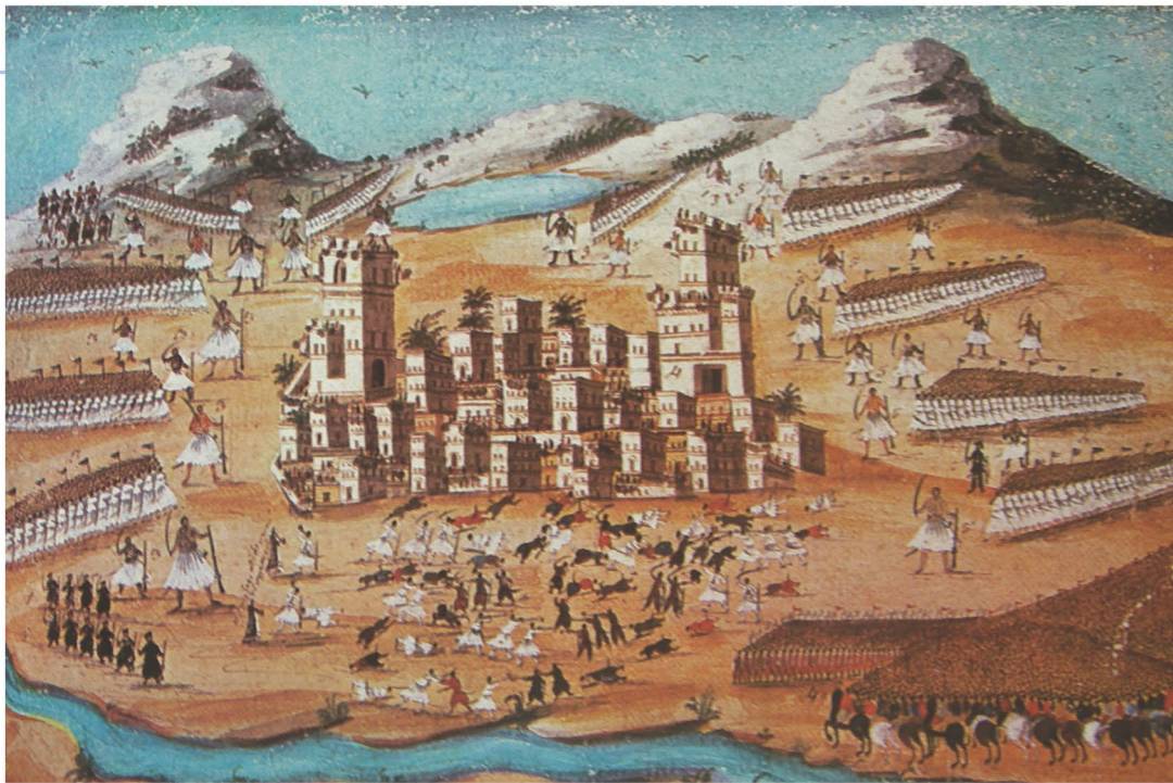
▲ Διάφορες μάχες στην Ανατολική Ελλάδα. Στο κέντρο η Θήβα. Π. Ζωγράφος, υδατογραφία σε χαρτόνι

Η επανάσταση στη Στερεά Ελλάδα ξεκίνησε τον Μάρτιο του 1821. Από τις συγκρούσεις με τον οθωμανικό στρατό ξεχωρίζουν η μάχη στην Αλαμάνα, όπου βρήκε φρικτό θάνατο ο Αθανάσιος Διάκος και η μάχη στο χάνι της Γραβιάς, στην οποία διακρίθηκε ο Οδυσσέας Ανδρούτσος.