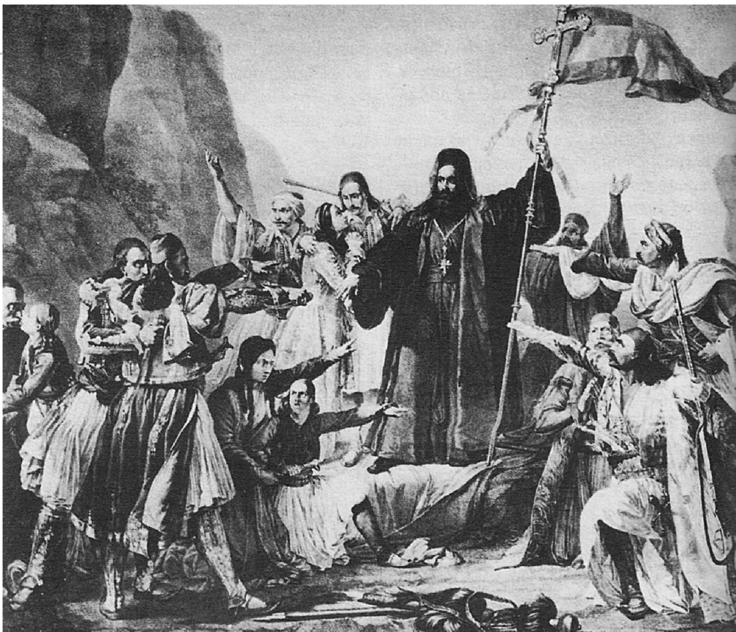
▲ Ο Παλαιών Πατρών Γερμανός υψώνει το λάβαρο της Επανάστασης στην πλατεία του Αγίου Ανδρέα της Πάτρας, ζωγραφικός πίνακας του Lappařini, Αθήνα, Εθνικό Αρχαιολογικό Μουσείο

Τον Μάρτιο του 1821 ξεκίνησε η επανάσταση στην Πελοπόννησο. Η αριθμητική υπεροχή των Ελλήνων στην περιοχή και η ύπαρξη πολλών στελεχών της Φιλικής Εταιρείας ήταν δύο από τους βασικούς λόγους που βοήθησαν τους επαναστατημένους Έλληνες να σημειώσουν τις πρώτες τους επιτυχίες.