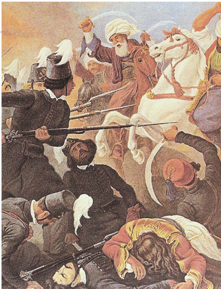
▲ Η καταστροφή του Ιερού Λόχου, πίνακας του Πέτερ φον Es, Αθήνα, Γεννάδειος Βιβλιοθήκη

Τον Φεβρουάριο του 1821 ο υπασπιστής του Ρώσου τσάρου, Αλέξανδρος Υψηλάντης, ηγήθηκε της εξέγερσης εναντίον των Τούρκων στη Μολδοβλαχία. Ωστόσο, μετά από επτά μήνες, η εξέγερση καταπνίγηκε από τον οθωμανικό στρατό.