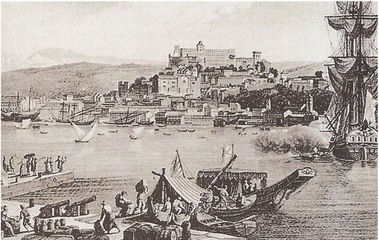
▲ Η Τεργέστη στις αρχές του 19 ου αιώνα, χαλκογραφία, Αθήνα, Γεννάδειος Βιβλιοθήκη

Κατά τη διάρκεια της Τουρκοκρατίας αρκετοί Έλληνες έφυγαν από τη γενέτειρά τους και μετανάστευσαν, είτε εξαιτίας των πολέμων είτε για οικονομικούς λόγους, σε άλλες περιοχές. Εκεί δημιούργησαν νέες κοινότητες, τις παροικίες.