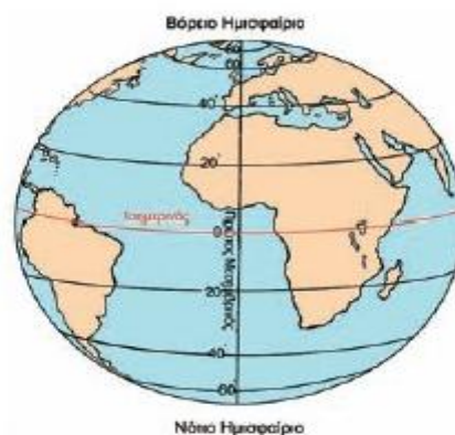
Εικόνα 2.2: Βόρειο και νότιο ημισφαίριο της Γης

6. Πώς λέγεται ο μεγαλύτερος παράλληλος κύκλος;