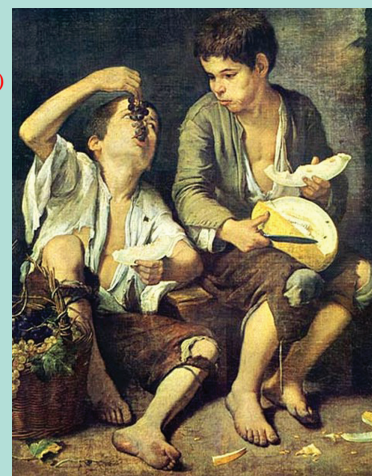
Μουρίλο, Αγορία που τρώνε σταφύλι και πεπόνι . Alte Pinakothek, Μόναχο, Γερμανία.

Οι εκπαιδευτικοί χρειάζεται να έχουν στέρεες επιστημονικές γνώσεις, μαθητοκεντρικές και ενεργητικές μεθοδολογικές προσεγγίσεις, θεωρητική και πρακτική γνώση του θέματος, αντικειμενική και αμερόληπτη κρίση.