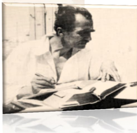
ΠΕΙΡΑΜΑΤΙΚΟ ΓΕ. Λ. ΜΥΤΙΛΗΝΗΣ ΤΟΥ ΠΑΝΕΠΙΣΤΗΜΙΟΥ ΑΙΓΑΙΟΥ