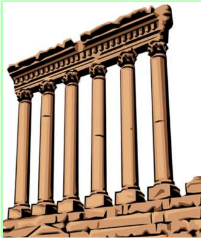
η αρχαία Τεγέα