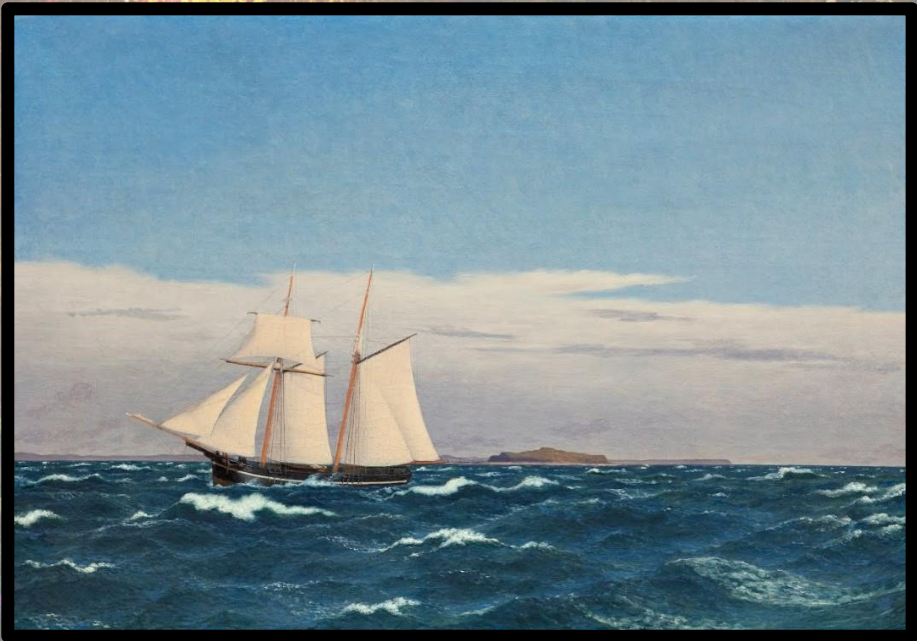
Christoffer Wilhelm Eckersberg