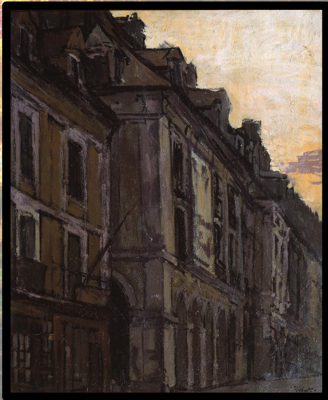
Walter Richard Sickert