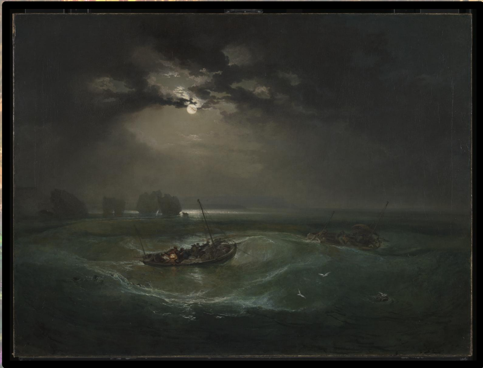
Joseph Mallord William Turner