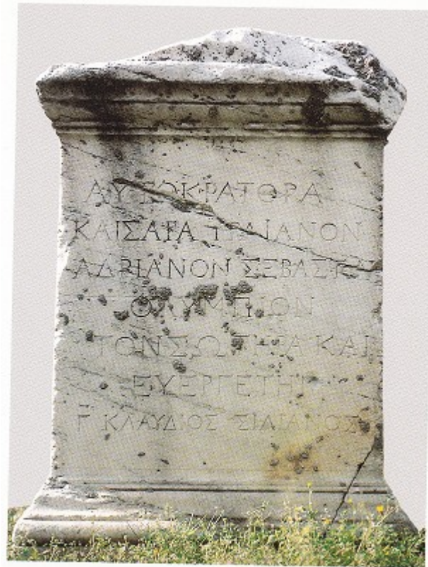
Εικ.4: Βωμός αφιερωμένος στον αυτοκράτορα Αδριανό, από τον περίβολο του Ολυμπείου. Εθνικό Αρχαιολογικό Μουσείο, υπαίθρια έκθεση γλυπτών. Αρ. ευρ. Ε 12350