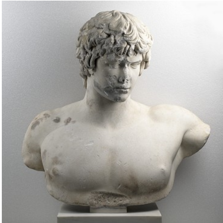
Εικ.1: Γυμνή προτομή με κεφαλή του Αντίνοου. Βρέθηκε στην Πάτρα το 1856. Χρονολογείται λίγο μετά το 130 μ.Χ. Αρ. ευρ. Γ 418.