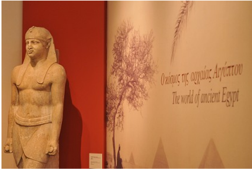
Εικ.5: Αιγυπτιάζον άγαλμα Αντίνοου. Από το ιερό των Αιγυπτίων Θεών στον Μαραθώνα. Εθνικό Αρχαιολογικό Μουσείο, Αίθ. 41. Αρ. ευρ. Αιγ. 1