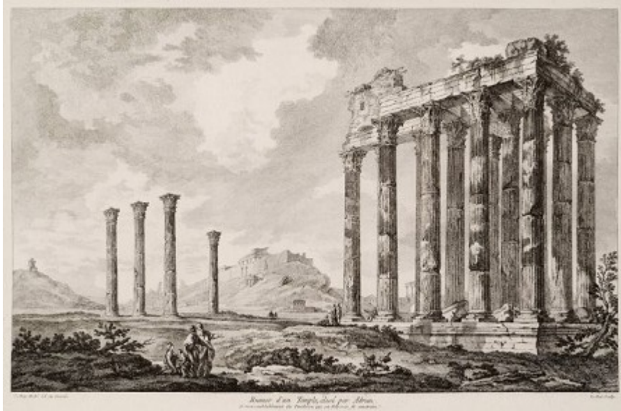
Εικ.3: Ο ναός του Ολυμπίου Διός (Ολυμπείου), η κατασκευή του οποίου ξεκίνησε επί Πεισίστρατου (6 ος αι. π.Χ.) και ολοκληρώθηκε από τον αυτοκράτορα Αδριανό. (Le Roy, J.D., Les ruines des plus beaux monuments de la Grèce, Paris 1758).