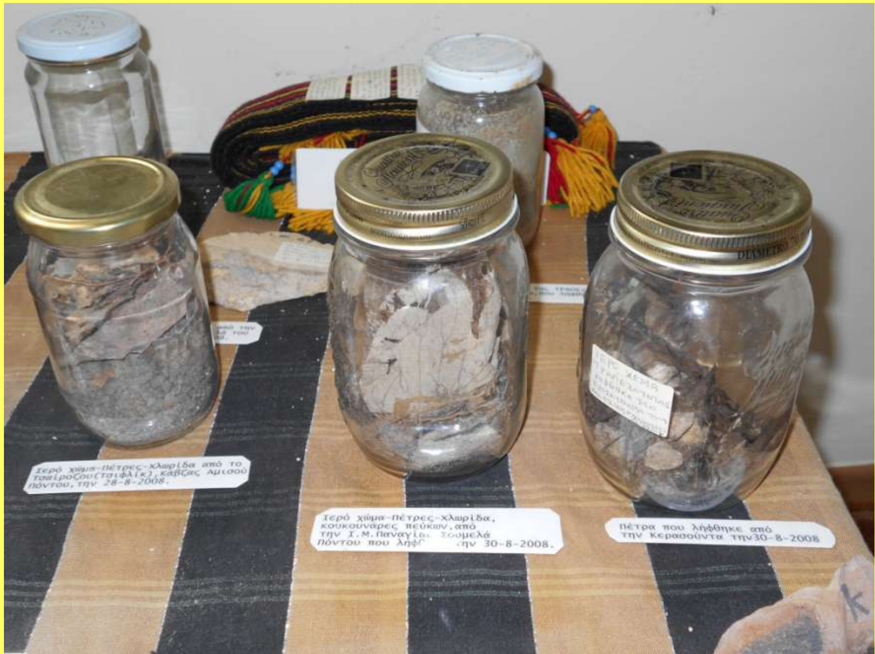
Γερό χώμα-πέτρες-χλωρίδα από το Τσαίροζου(τσιφλίκ), καθ΄ως λιμνού πόντου, την 28-8-2008.