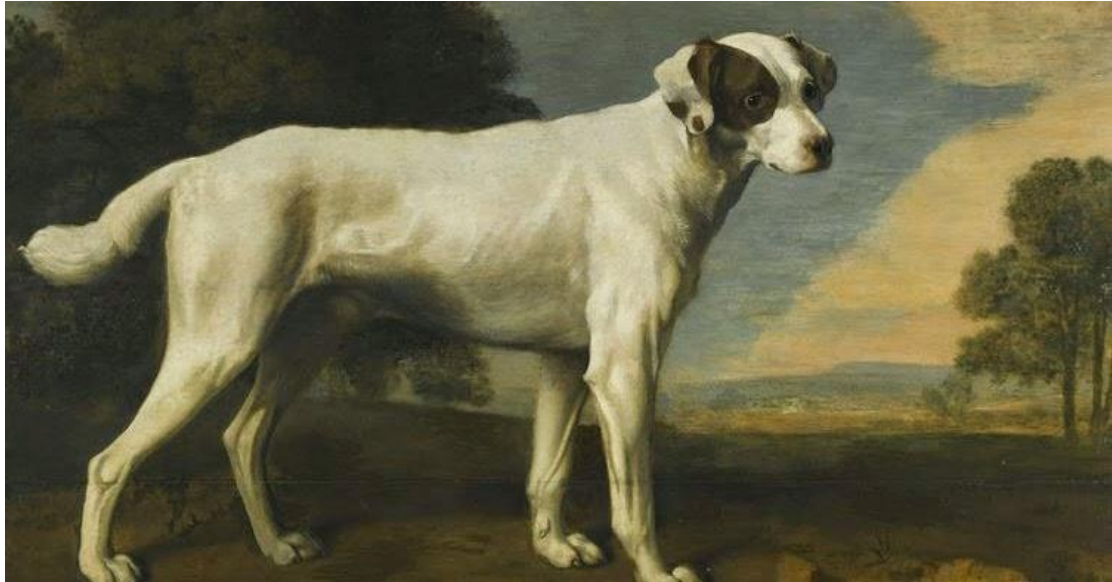
Άργος ο σκύλος του Οδυσσέα.

Όμως ο χρόνος πέρασε γι' αυτούς φέρνοντας την αρρώστια και τη φθορά. Μια μέρα η Παρθενόπη πέθανε αφήνοντας τον κύριό της απαρηγόρητο. Γι' αυτόν η ομορφιά της ζωής και η αγάπη ήταν συνδεδεμένα με τη σκυλίτσα του. Θέλοντας να κρατήσει τη μορφή της πάντα ζωντανή έδωσε εντολή στον καλύτερο τεχνίτη του νησιού να φτιάξει μια επιτύμβια στήλη. Έτσι, μέσα από το άψυχο μάρμαρο ζωντάνευσε η κάθε στιγμή που είχαν περάσει οι δυο τους.