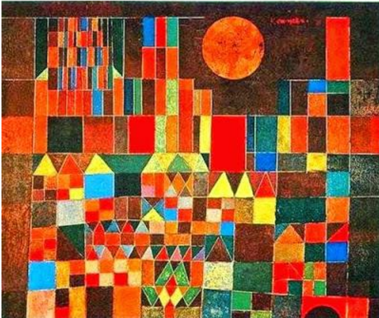
Paul klee, Castle and Sun

And the horizon's wreath overbrims with light This is peace