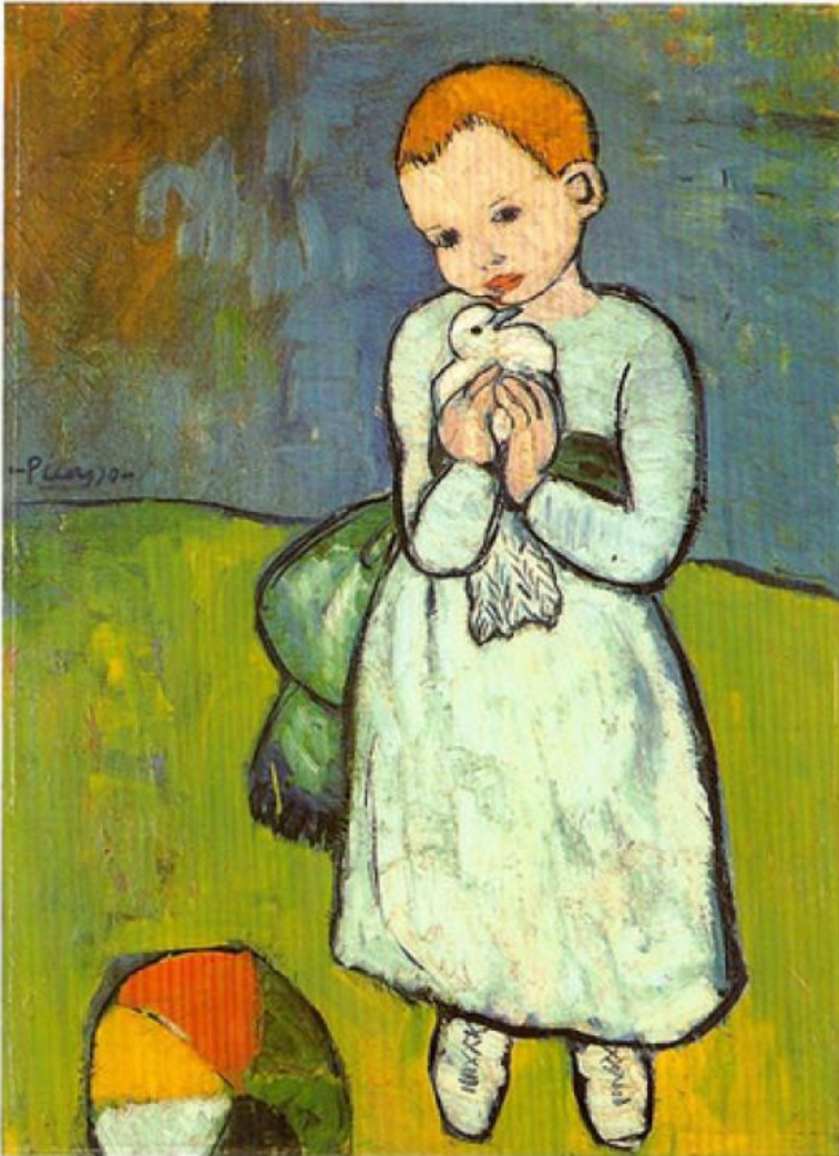
Pablo Picasso, Child Holding A Dove

Τ' όνειρο του παιδιού είναι η ειρήνη