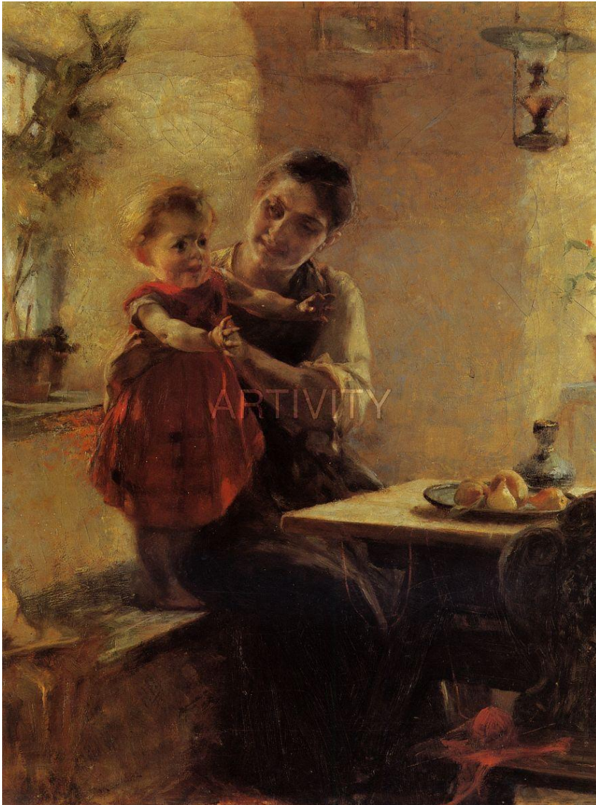
Iakovidis Georgios, Μητέρα και Παιδί