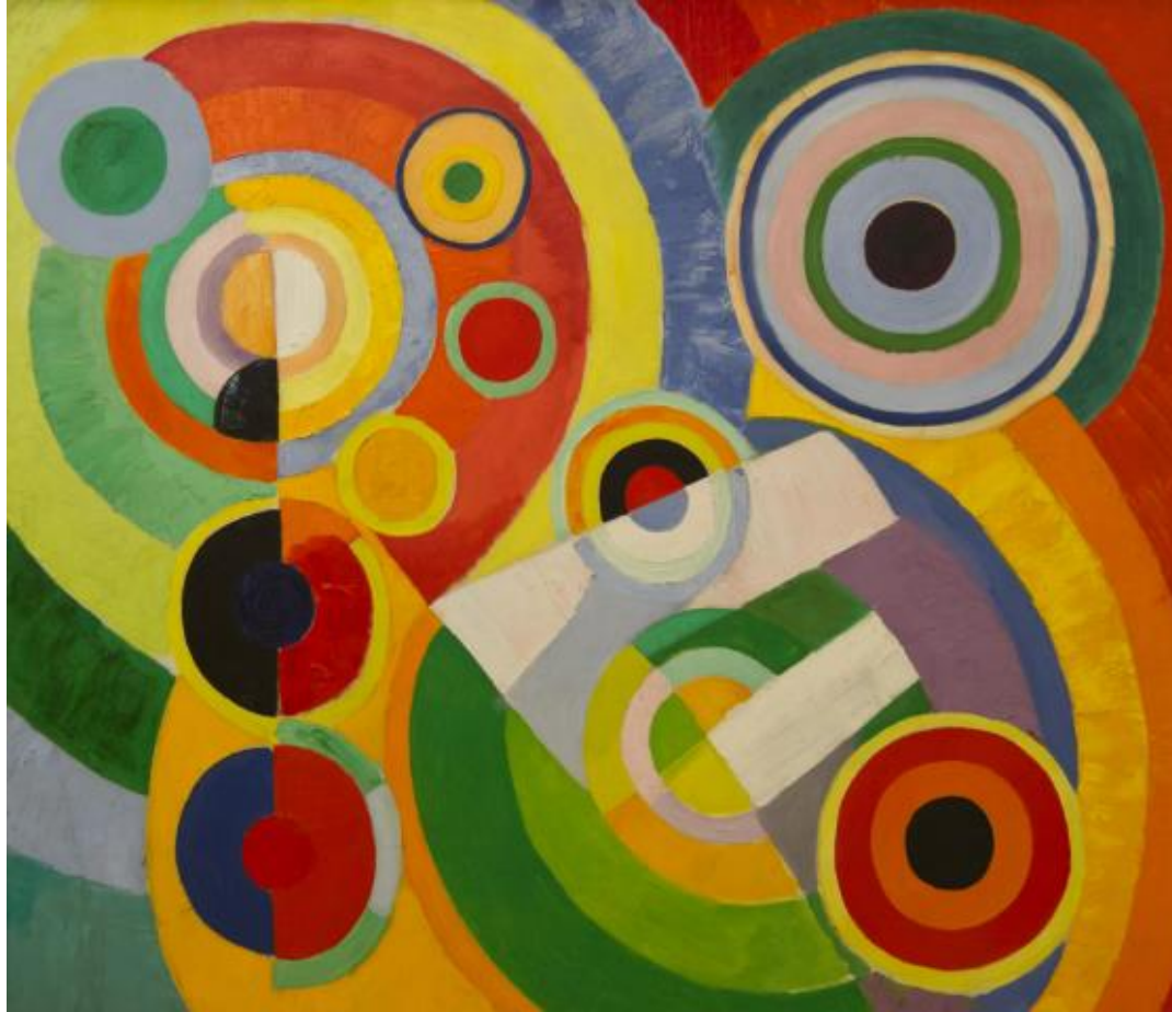
The Joy Of Life Robert Delaunay Date: 1930

Give us your hands brothers, This is peace