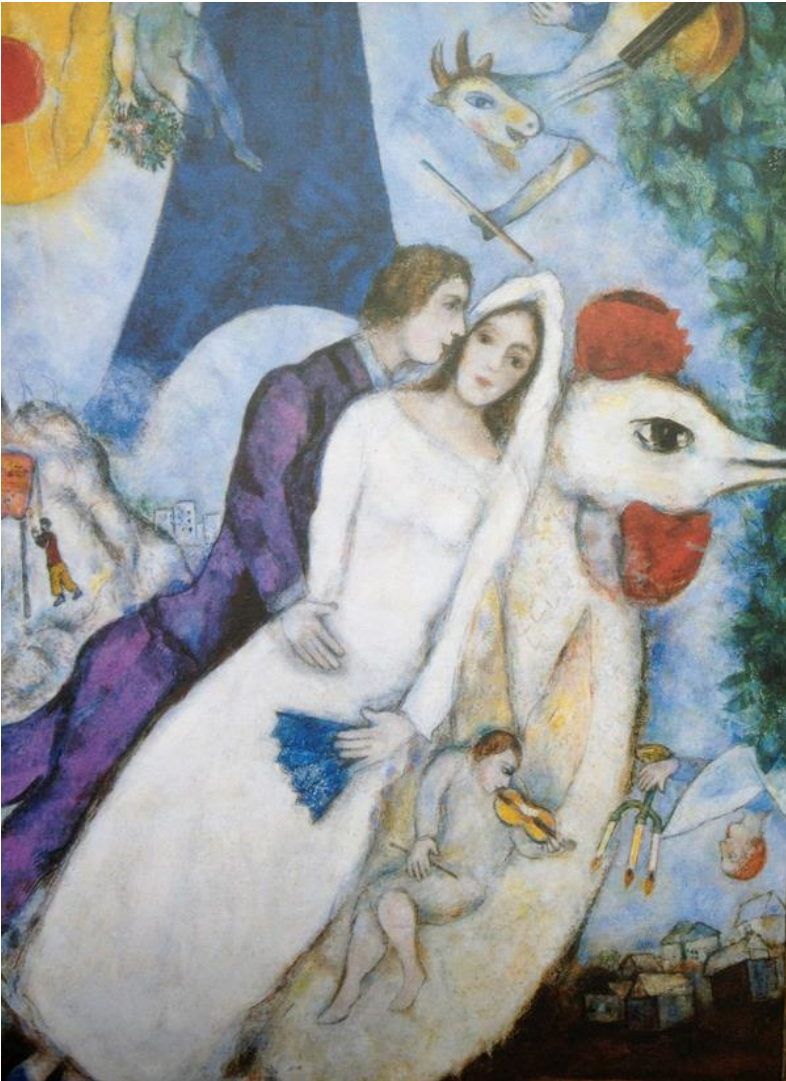
Marc Chagall, Entre Guerre Et Paix

The words of love under the trees are peace