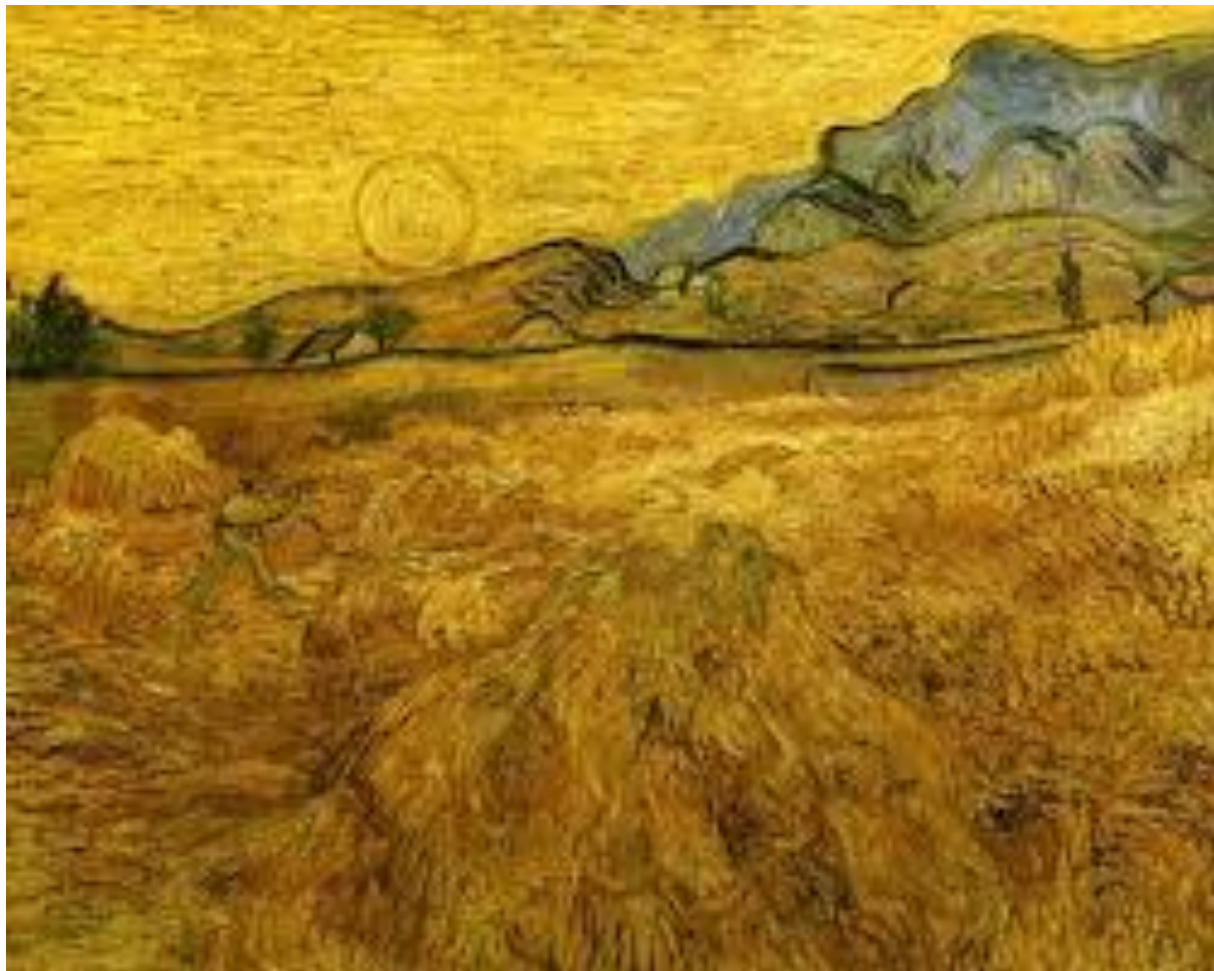
Wheatfield with a Reaper Vincent van Gogh, 1889

When wheat stalks lean toward one another saying: the light, the light