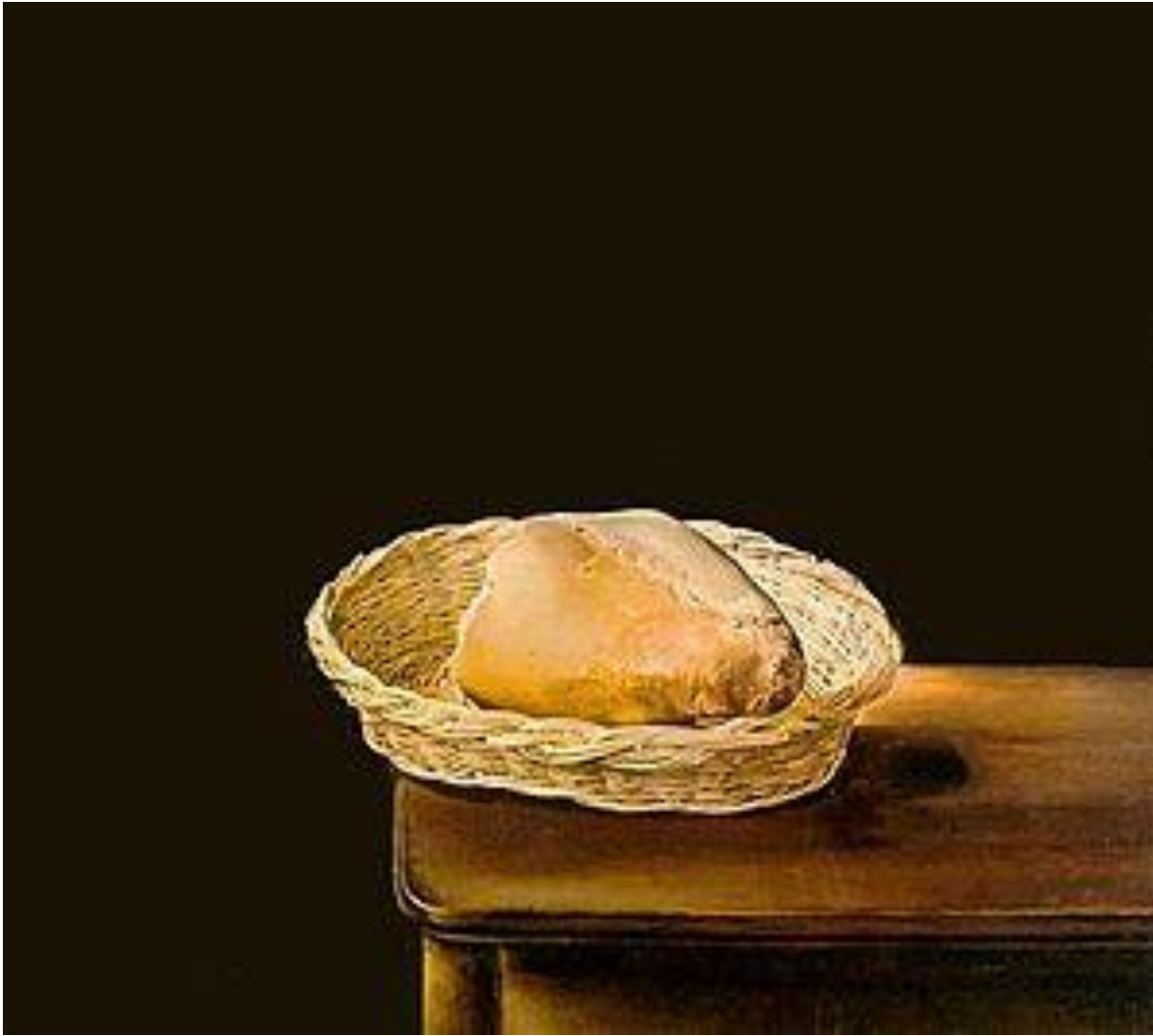
Basket of Bread, Salvador Dali

είναι το ζεστό ψωμί στο τραπέζι του κόσμου