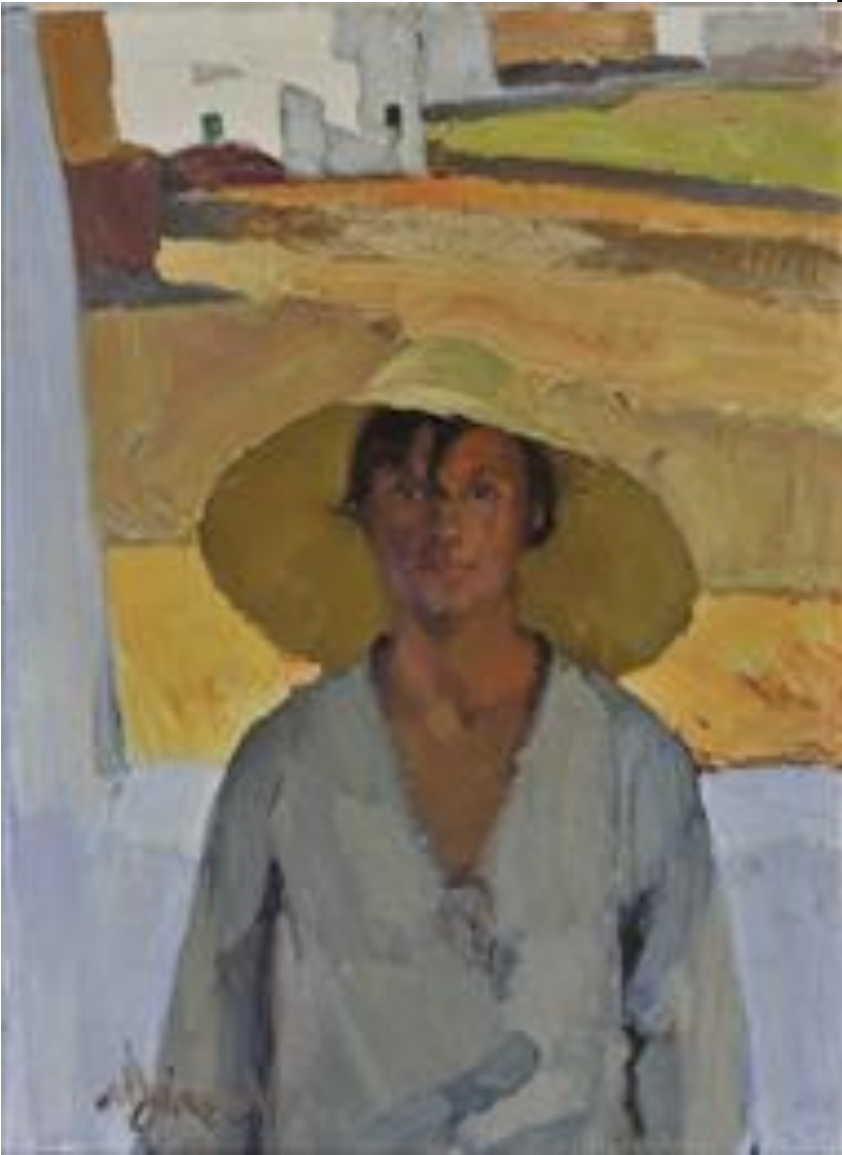
Nikiforos Lytras, Το ψάθινο καπέλο

The father who returns at dusk with a wide smile in his eyes