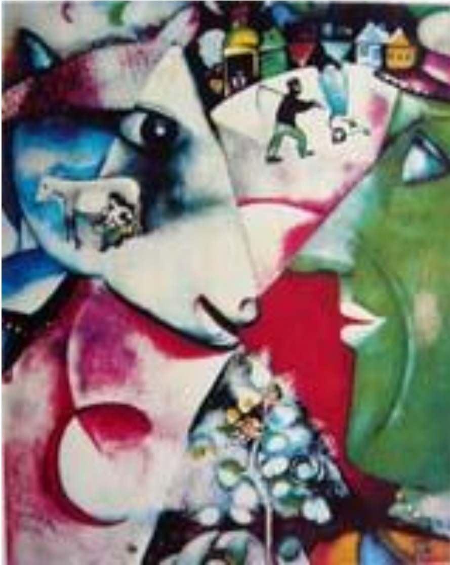
I AND THE VILLAGE, Marc Chagall

My brothers, all the world with all its dreams breathes deeply in peace.