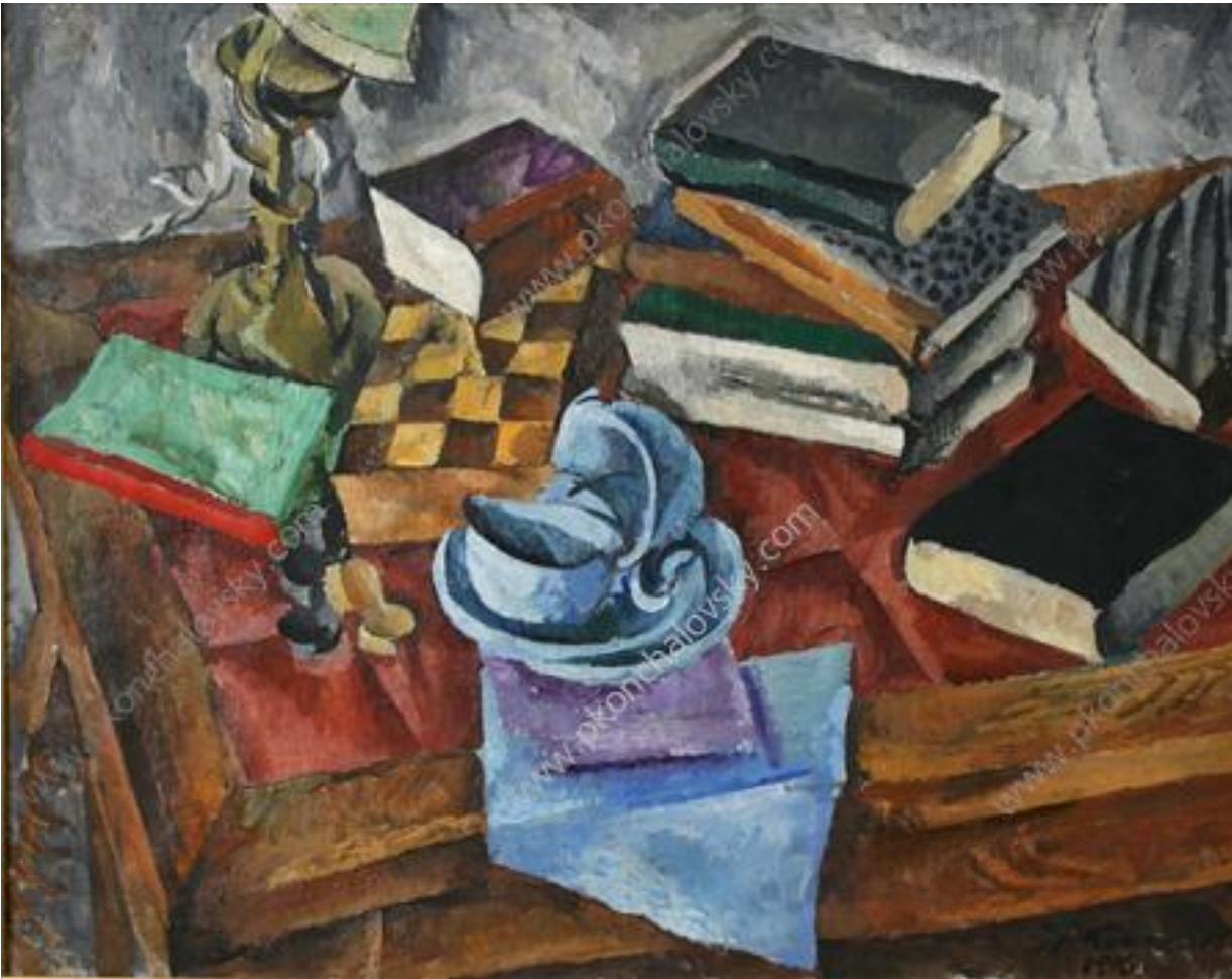
Νεκρή φύση, Pyotr Konchalovsky

Ειρήνη είναι ένα ποτήρι ζεστό γάλα κ' ένα βιβλίο μπροστά στο παιδί που ξυπνάει.