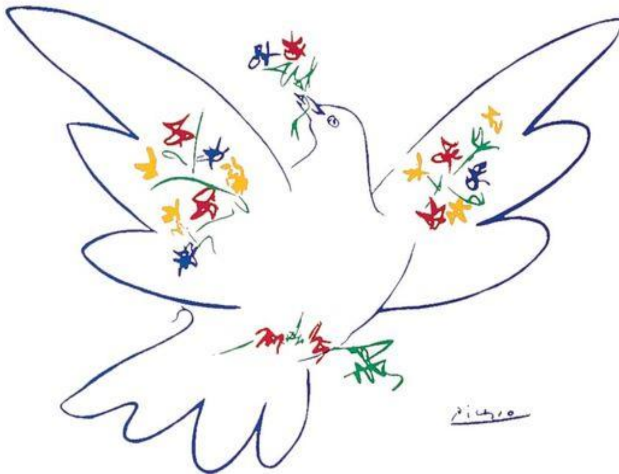
Dove of Peace, Pablo Picasso

Η ειρήνη είναι τα σφιγμένα χέρια των ανθρώπων