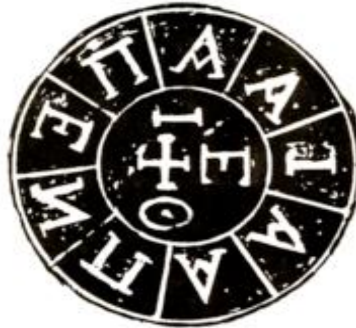
Η σφραγίδα της Φιλικής Εταιρίας