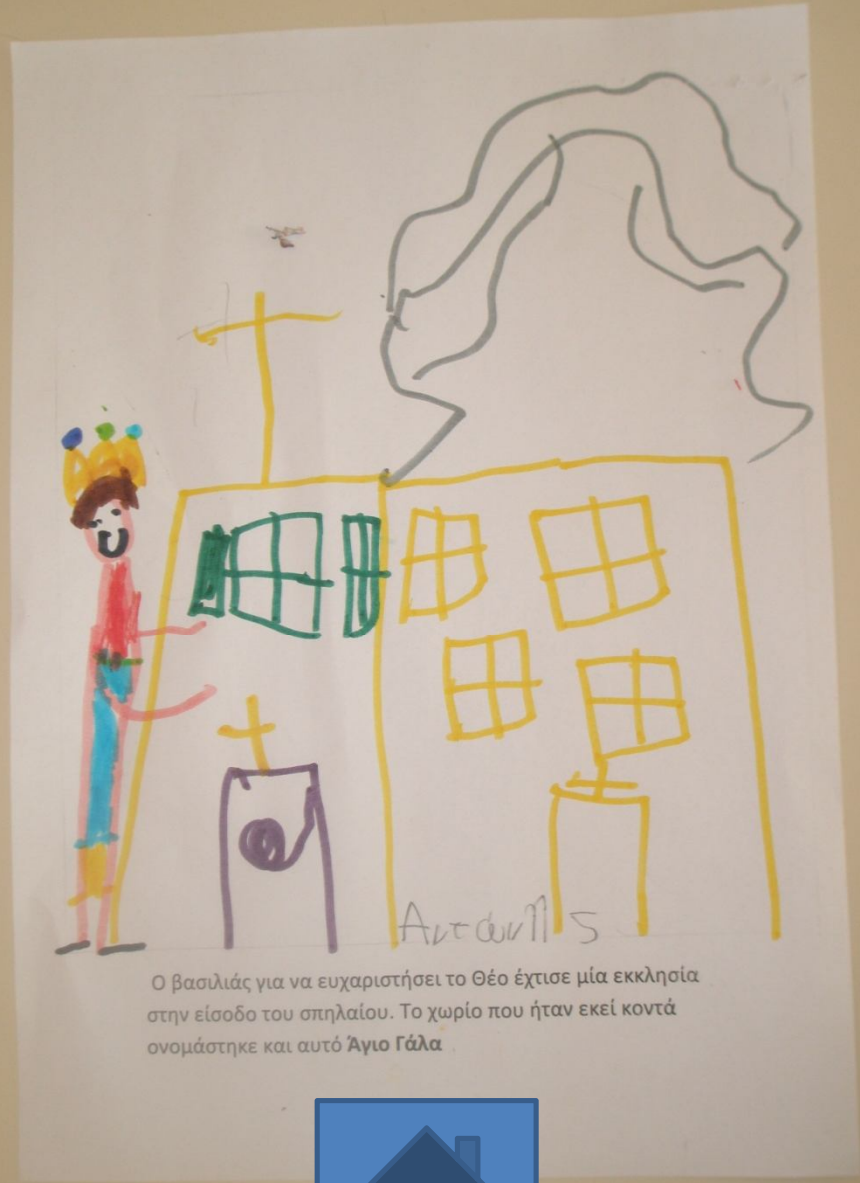
Ο βασιλιάς για να ευχαριστήσει το Θεό έχτισε μία εκκλησία στην είσοδο του σπηλαίου. Το χωριό που ήταν εκεί κοντά ονομάστηκε και αυτό Άγιο Γάλα