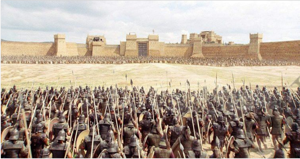
Οι Τρώες και οι Αχαιοί παραταγμένοι έξω από τα τείχη της Τροίας πριν από τη μονομαχία Πάρι και Μενέλαου