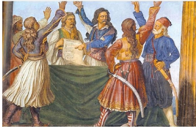
Η Α΄ Εθνοσυνέλευση της Επιδαύρου (Ιανουάριος 1822)