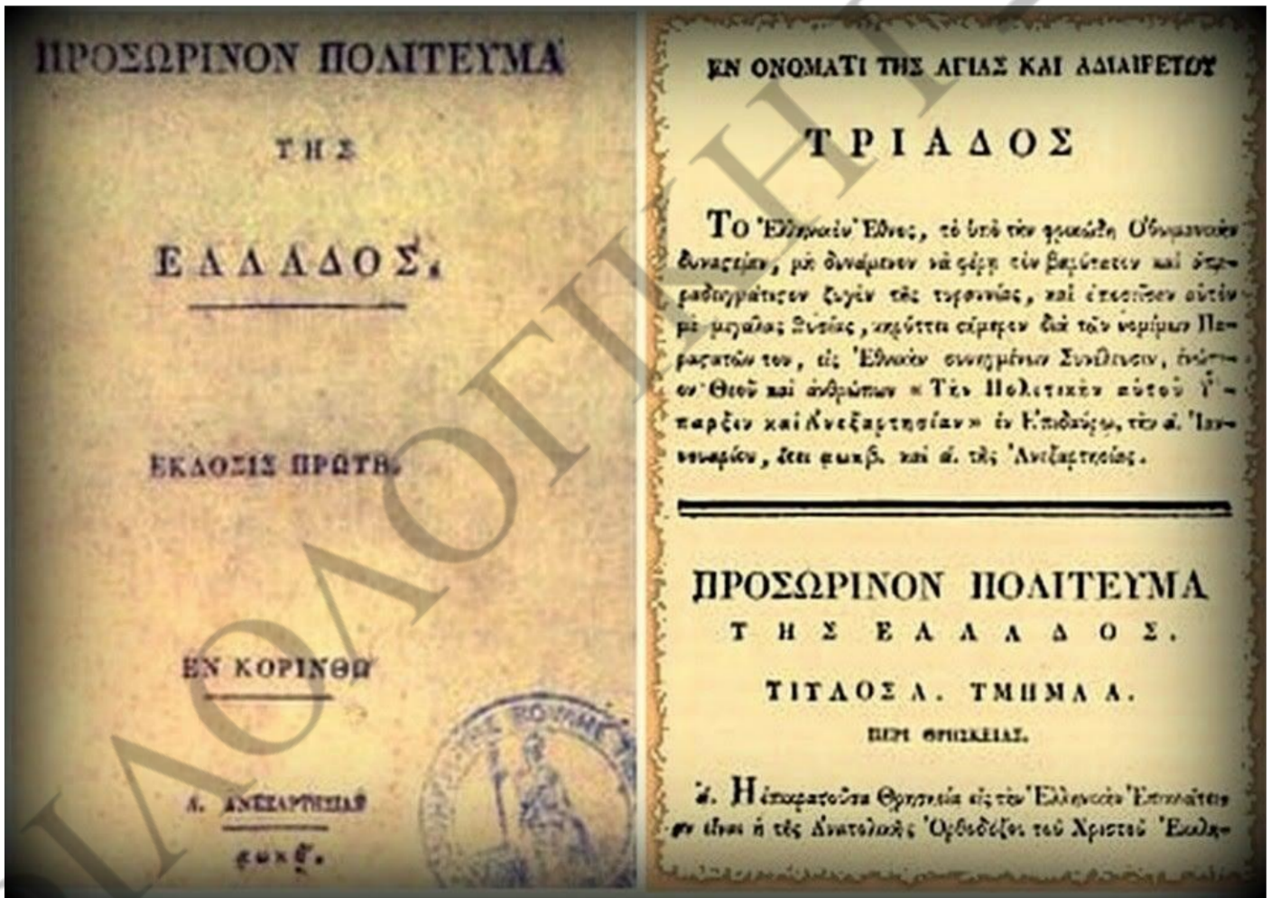
Το πρώτο Σύνταγμα (Α΄ Εθνοσυνέλευση)