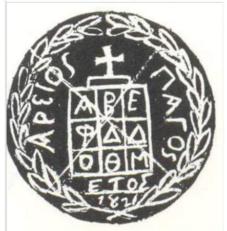
Σφραγίδες των Τοπικών Οργανισμών