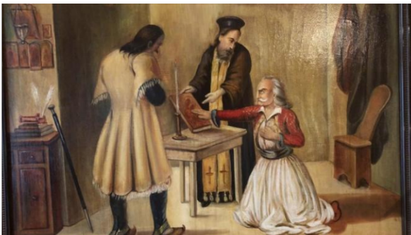
Όρκος μέλους της Φιλικής Εταιρείας