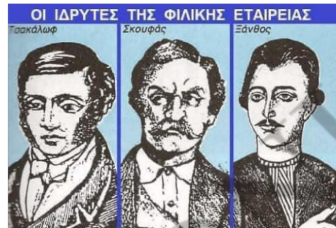
Οι ιδρυτές της Φιλικής Εταιρείας