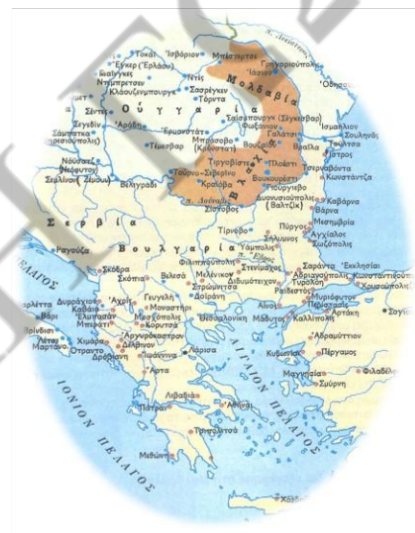
Οι αυτόνομες παραδουνάβιες ηγεμονίες της Οθωμανικής Αυτοκρατορίας (Μολδαβία-Βλαχία)