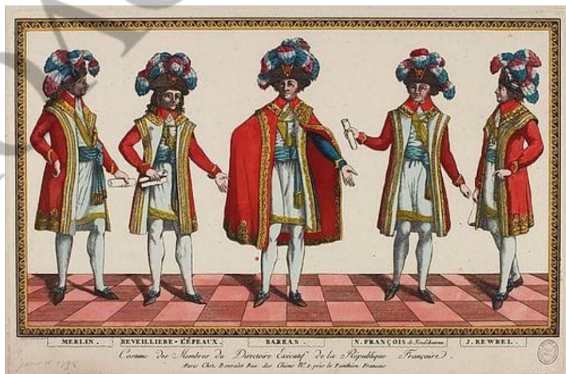
Το Διευθυντήριο (1795-1799)