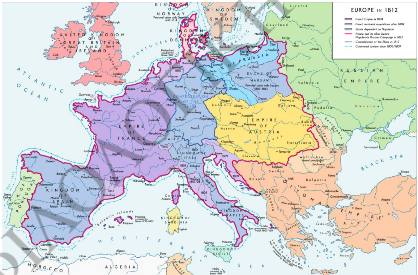
Η γαλλική αυτοκρατορία το 1812 μετά τις επιτυχές του Ναπολέοντα