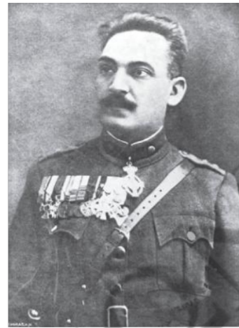
Ο Στυλιανός Γονατάς