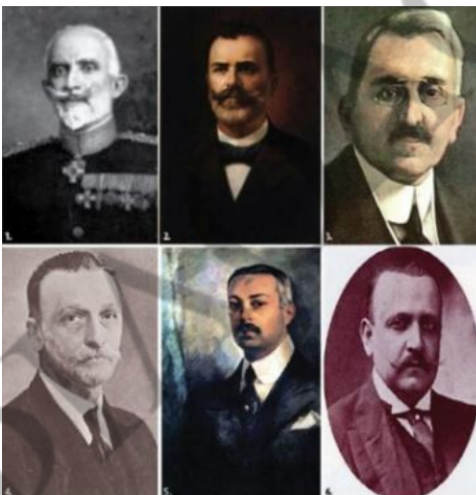
Οι έξι που καταδικάστηκαν σε θάνατο από το στρατοδικείο της «δίκης των έξι»