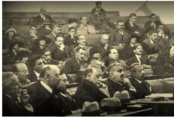
Στιγμιότυπο από τη «δίκη των έξι»