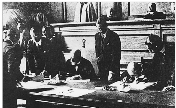
Ο Ελευθέριος Βενιζέλος υπογράφει την συνθήκη της Λοζάνης και βάζει οριστικά τέλος στη «Μεγάλη Ιδέα»