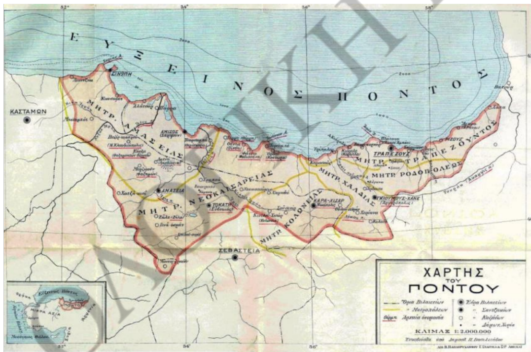
Χάρτης του ελληνορθόδοξου Πόντου (βόρεια ακτή Μικράς Ασίας)