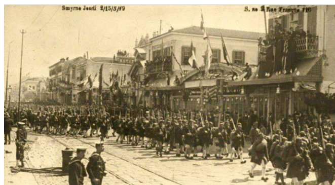
Στιγμιότυπα από την πανηγυρική υποδοχή του ελληνικού στρατού στη Σμύρνη από τους Έλληνες της πόλης