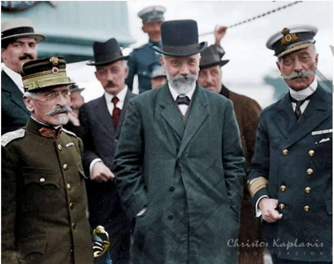
Η «τριανδρία» της Προσωρινής Κυβέρνησης της Θεσσαλονίκης: Βενιζέλος (κέντρο), Δαγκλής (αριστερά), Κουντουριώτης (δεξιά)