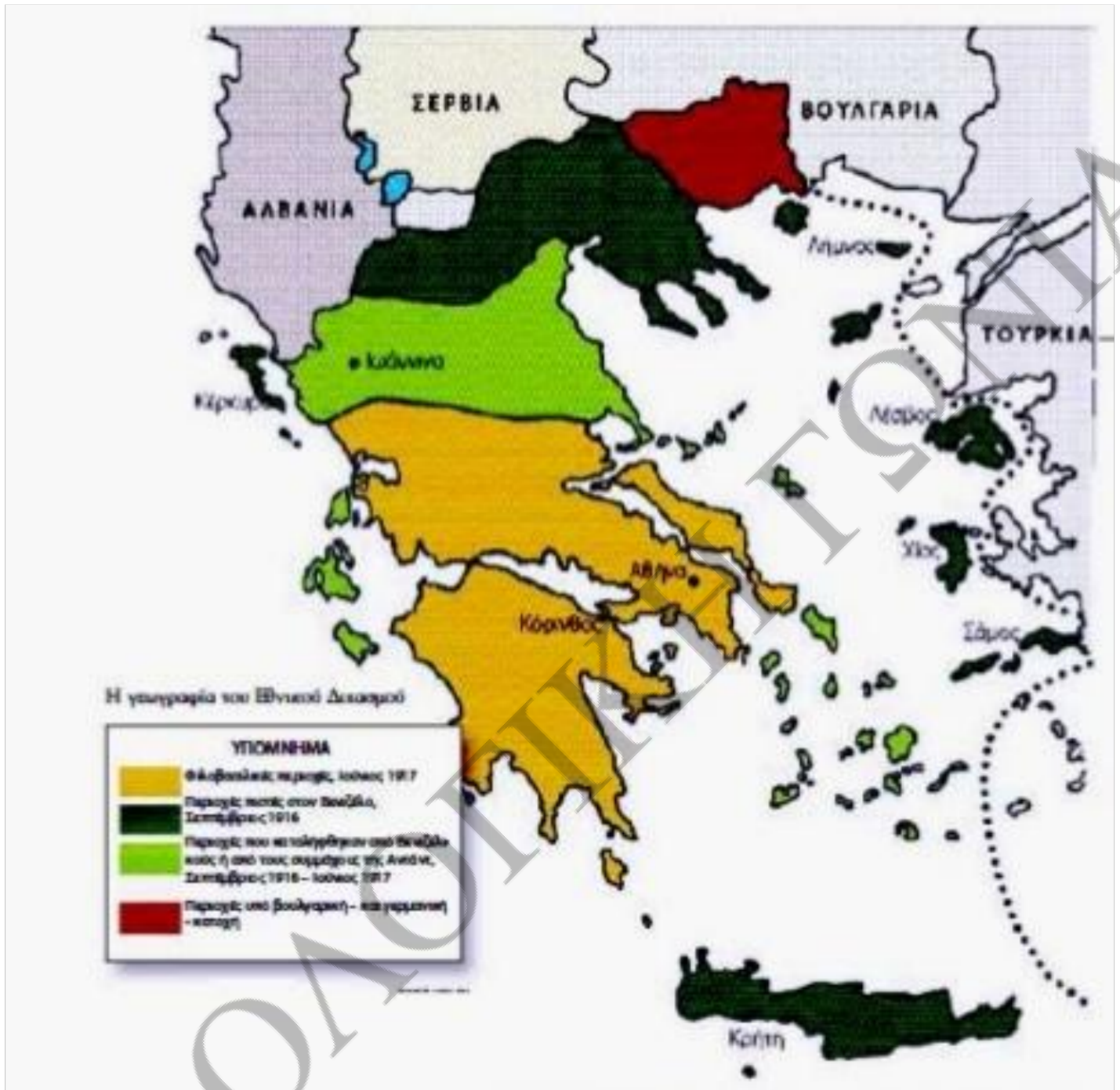
Η Ελλάδα στα χρόνια του Εθνικού Διασμού: