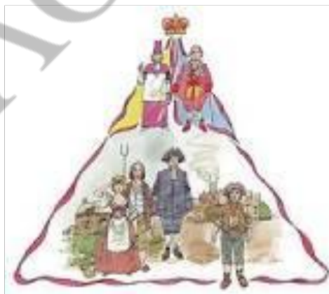
Η διαστρωμάτωση της γαλλικής κοινωνίας