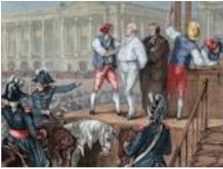
Ο αποκεφαλισμός του Λουδοβίκου