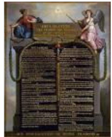
Η διακήρυξη των δικαιωμάτων του ανθρώπου και του πολίτη (26/8/1789)