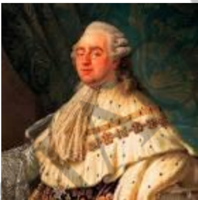
Λουδοβίκος ο 16 ος