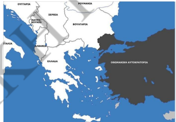
Οι εδαφικές απώλειες της Οθωμανικής Αυτοκρατορίας λόγω των Βαλκανικών Πολέμων (αριστερά: τα σύνορα πριν από τους Βαλκανικούς Πολέμους / δεξιά: τα σύνορα μετά τους Βαλκανικούς Πολέμους)