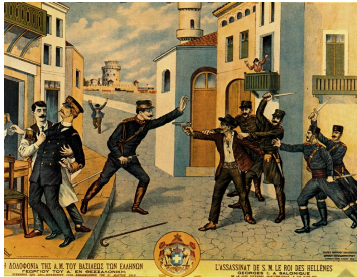
Η δολοφονία του Βασιλιά Γεώργιου στη Θεσσαλονίκη από τον Αλέξανδρο Σχινά (05/03/1913)