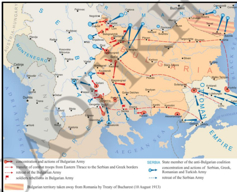
Οι στρατιωτικές επιχειρήσεις του Β΄ Βαλκανικού Πολέμου (με σκούρα βέλη οι ελληνικές, σερβικές και ρουμανικές επιχειρήσεις κατά της Βουλγαρίας)