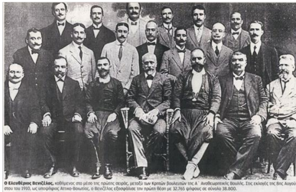
Ο Βενιζέλος (στο κέντρο καθιστός) ανάμεσα σε Κρητικούς βουλευτές των εκλογών του Αυγούστου 1910