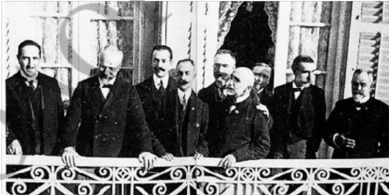
Ο Βενιζέλος σε προεκλογική εμφάνιση το φθινόπωρο του 1910