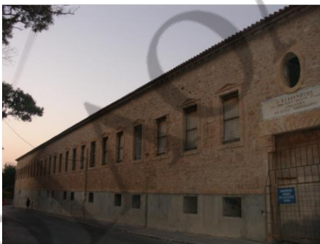
Το Ορφανοτροφείο της Αίγινας