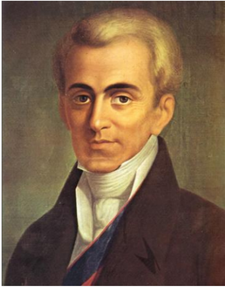
Ιωάννης Καποδίστριας (1776-1831)