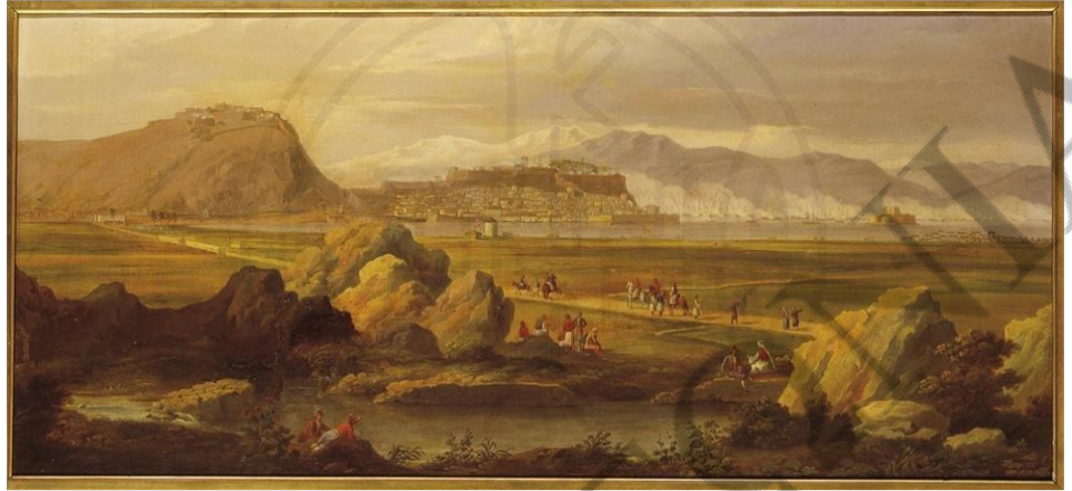
Το Ναύπλιο κατά την εποχή της διακυβέρνησης του Καποδίστρια