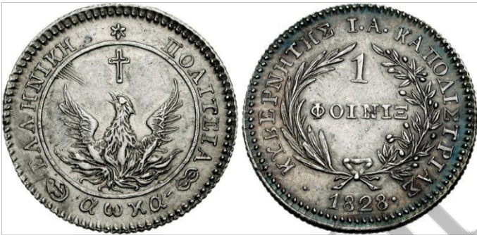
Ο Φοίνικας, το πρώτο νόμισμα της Ελλάδας