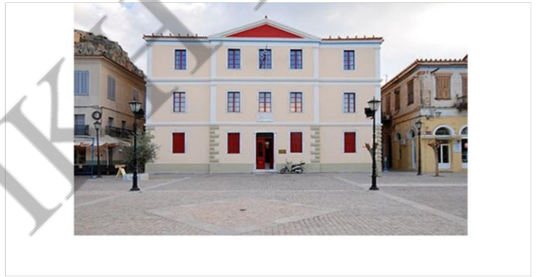
Το πρώτο αλληλοδιδασκτικό σχολείο στο Ναύπλιο