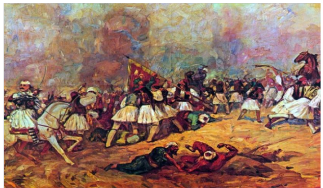
Η τελευταία μάχη της ελληνικής επανάστασης, η μάχη της Πέτρας (12/09/1829)