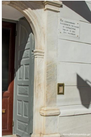
Το σημείο δολοφονίας του Καποδίστρια