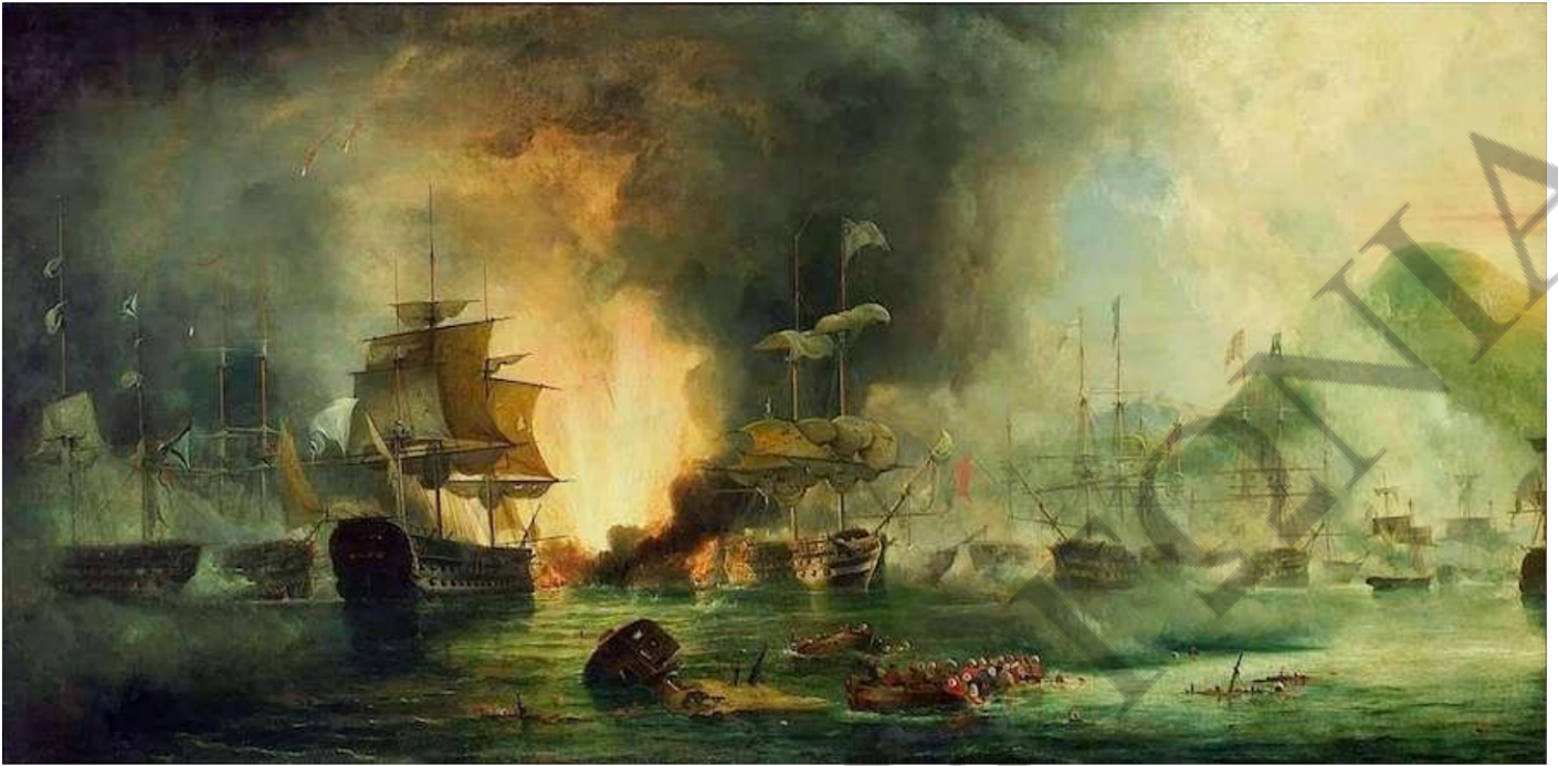
Η ναυμαχία του Ναυαρίνου (20/10/1827)