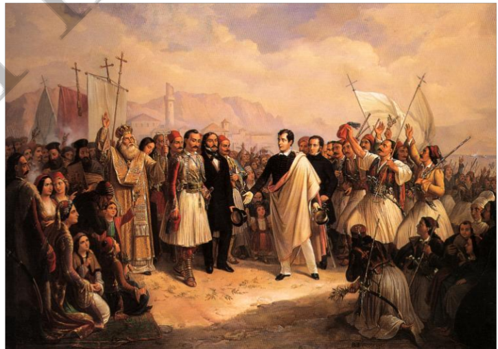
Ο Λόρδος Μπάιρον φτάνει στην Ελλάδα το 1823