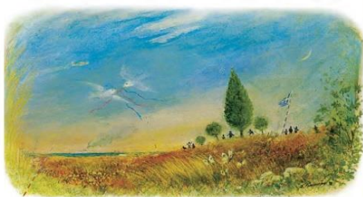
Πίνακας του Σπύρου Κουρούρη

☀️ Θα ήθελες να βρίσκεσαι στο τοπίο που βλέπεις σε αυτό τον πίνακα; Γιατί;