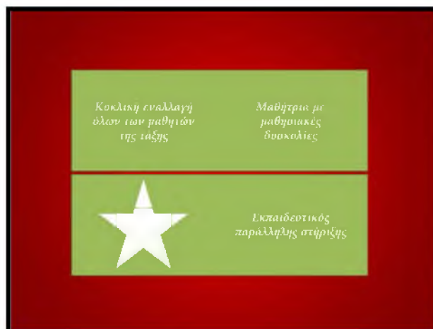
Σχήμα 2: Διάταξη της ομάδας – Α' τρίμηνο

Στο Β' τρίμηνο του σχολικού έτους σε μία γενικότερη ανακατανομή των ομάδων της τάξης, η ομάδα του μαθητή μεταφέρθηκε στο κέντρο της τάξης (επάνω – κεντρική ομάδα στο Σχήμα 1). Δίπλα στον μαθητή καθόταν και πάλι ο δάσκαλος της παράλληλης στήριξης, ενώ απέναντί του τοποθετήθηκε ένας συμμαθητής με τον οποίο ο μαθητής με αυτισμό είχε αρχίσει να αναπτύσσει μία πολύ καλή φιλική σχέση μέσα στην τάξη αλλά και στα διαλείμματα. Όταν ολοκληρώθηκε η κυκλική εναλλαγή όλων των μαθητών της τάξης, απέναντι από τον δάσκαλο της παράλληλης στήριξης καθόταν και πάλι με εναλλαγές οι τρεις μαθητές οι οποίοι παρακολουθούσαν και το τμήμα ένταξης. Εννοείται πως και πάλι από τον δάσκαλο της παράλληλης στήριξης προσφέρονταν βοήθεια σε όλους τους μαθητές της ομάδας. Η διάταξη αυτή (Σχήμα 3) διατηρήθηκε και στο Γ' τρίμηνο.