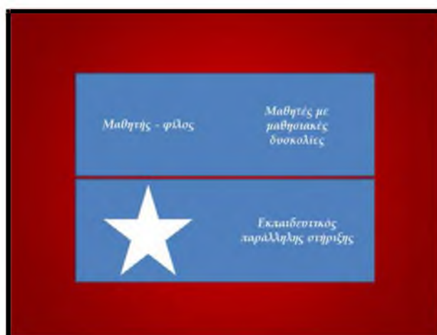
Σχήμα 3: Διάταξη της ομάδας – Β' και Γ' τρίμηνο

Στο Β' τρίμηνο του σχολικού έτους σε μία γενικότερη ανακατανομή των ομάδων της τάξης, η ομάδα του μαθητή μεταφέρθηκε στο κέντρο της τάξης (επάνω – κεντρική ομάδα στο Σχήμα 1). Δίπλα στον μαθητή καθόταν και πάλι ο δάσκαλος της παράλληλης στήριξης, ενώ απέναντί του τοποθετήθηκε ένας συμμαθητής με τον οποίο ο μαθητής με αυτισμό είχε αρχίσει να αναπτύσσει μία πολύ καλή φιλική σχέση μέσα στην τάξη αλλά και στα διαλείμματα. Όταν ολοκληρώθηκε η κυκλική εναλλαγή όλων των μαθητών της τάξης, απέναντι από τον δάσκαλο της παράλληλης στήριξης καθόταν και πάλι με εναλλαγές οι τρεις μαθητές οι οποίοι παρακολουθούσαν και το τμήμα ένταξης. Εννοείται πως και πάλι από τον δάσκαλο της παράλληλης στήριξης προσφέρονταν βοήθεια σε όλους τους μαθητές της ομάδας. Η διάταξη αυτή (Σχήμα 3) διατηρήθηκε και στο Γ' τρίμηνο.