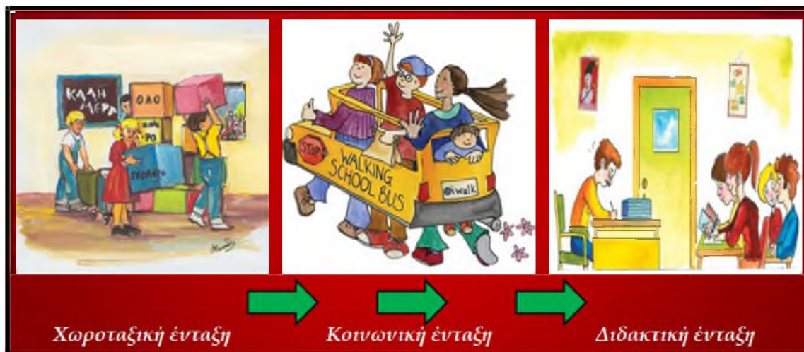
Σχήμα 4: Η ένταξη ενός παιδιού με αυτισμό στο γενικό σχολείο

στικά και με συνέπεια μόνο εφόσον «ανέβουμε στο όχημα» της κοινωνικής ένταξης του παιδιού (Σχήμα 4).