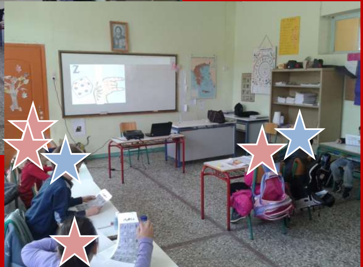
Ενημέρωση και ευαισθητοποίηση μαθητών/τριών γενικών τάξεων σχετικά με τα ΑμεΑ - Δ/Σ Πευκοχωρίου Χαλκιδικής - 4ος μήνας How can a teacher inform and sensitize his/her students about disability - P/S of Pefkohori, Halkidiki - 4th month