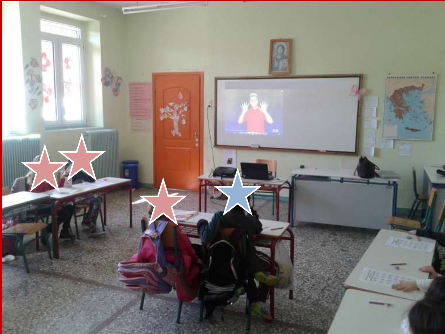
Ενημέρωση και ευαισθητοποίηση μαθητών/τριών γενικών τάξεων σχετικά με τα ΑμεΑ - Δ/Σ Πευκοχωρίου Χαλκιδικής - 4ος μήνας How can a teacher inform and sensitize his/her students about disability - P/S of Pefkohori, Halkidiki - 4th month