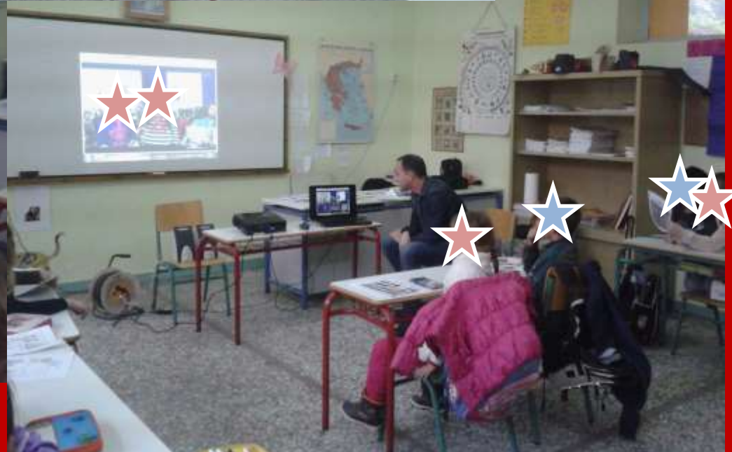
Ενημέρωση και ευαισθητοποίηση μαθητών/τριών γενικών τάξεων σχετικά με τα ΑμεΑ - Δ/Σ Πευκοχωρίου Χαλκιδικής - 4ος μήνας How can a teacher inform and sensitize his/her students about disability - P/S of Pefkohori, Halkidiki - 4th month