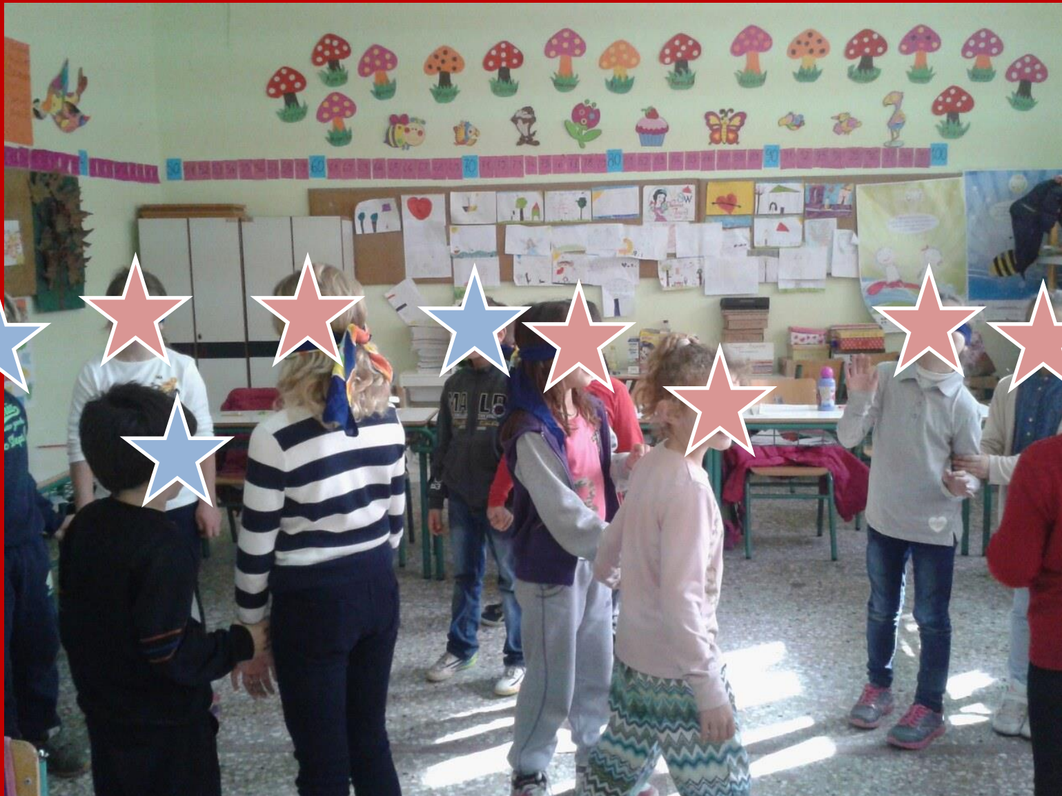
Ενημέρωση και ευαισθητοποίηση μαθητών/τριών γενικών τάξεων σχετικά με τα ΑμεΑ - Δ/Σ Πευκοχωρίου Χαλκιδικής - 3ος μήνας How can a teacher inform and sensitize his/her students about disability - P/S of Pefkohori, Halkidiki - 3rd month