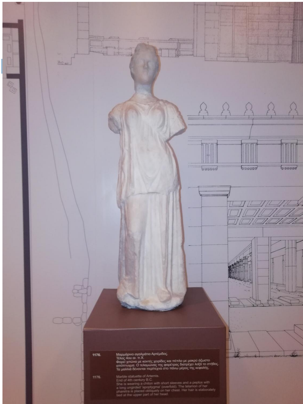
117E. Μαρμάρινο άγαλμάτο Αρτέμιδος. Τέλος 4ου αι. π.Χ. Φορεί χιτώνια με κοντές χερσίδες και πέπλο με μακρύ άρραστο άποφρυγμά. Ο πλεγματικός της φορέτρος διατρέχει λοξά το στήθος. Τα μαλλιά δένονται περίτεχνα στο πάνω μέρος της κεφαλής. 117E. Marble statuette of Artemis. End of 4th century B.C. She is wearing a chiton with short sleeves and a peplos with a long unringed 'apophrygia' (overfold). The telamon of her pharetra is placed obliquely on her chest. Her hair is elaborately braided at the upper part of her head.