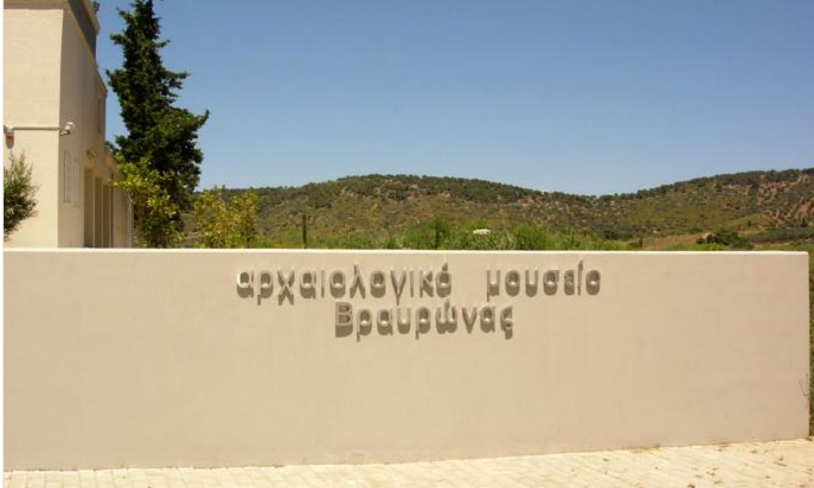
Archaeological Museum of Vravra