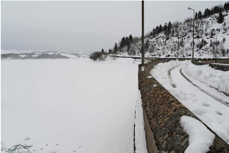
Το φράγμα της λίμνης στο νοτιότερο σημείο της. Το νερό παγωμένο και όλα κάτω από το χιόνι.

Αμέσως μετά το φράγμα και αφού ένα ΙΧ μας ανάγκασε να κάνουμε όπισθεν τη μισή διαδρομή πάνω στο ούτως ή άλλως στενό οδόστρωμά του και τώρα ακόμα στενότερο λόγω χιονιού, διότι αδυνατούσε να περάσει, σταματήσαμε για να διαπιστώσουμε με ησυχία ότι, όντως όλο αυτό το νερό είχε παγώσει. Μα πόσο χιόνι έριξε; Η απάντηση ήρθε αργά το βράδυ στην ταβέρνα. Το πρώτο χιόνι φέτος το έριξε τον Οκτώβρη και από τότε, ποτέ δεν τους ξέχασε.