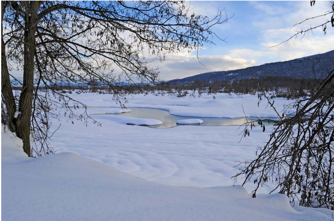
Στο βόρειο τμήμα της λίμνης. Μόνο το ποτάμι διατηρείται σε υγρή μορφή.

Και ξαφνικά, το μάτι έπεσε στο δείκτη της βενζίνης. Η κίνηση στους τέσσερις τροχούς για πολλά χιλιόμετρα, είχε κάνει τη ζημιά της, ανεβάζοντας την κατανάλωση και ρίχνοντας την πρόβλεψη για αυτονομία τελείως έξω. Άρα χρειαζόμασταν καύσιμα. Το κλίμα στο αυτοκίνητο έγινε πάλι βαρύ. Καθότι αν δεν βρίσκαμε, θα απολαμβάναμε το τοπίο από τον εξώστη του ξενώνα, ο οποίος ήταν και γεμάτος χιόνι και θα χρειαζόταν να τον καθαρίσουμε. Στο πρώτο βενζινάδικο μας πληροφόρησαν ότι τα καύσιμα είχαν τελειώσει και δεν τους έφερναν διότι φοβούνται το δρόμο. Τώρα αλήθεια έλεγαν, ψέμματα έλεγαν, μικρή σημασία είχε. Οι φόβοι μας άρχισαν να μετουσιώνονται σε πραγματικότητα. Μπήκαμε με φόβο στο δεύτερο πρατήριο. Μόλις το χέρι του βενζινά πήγε με φυσικότητα στην αντλία χωρίς να πει άλλη κουβέντα εκτός του χαιρετισμού, το κλίμα επανήλθε. Είχαμε πλέον και βενζίνη.