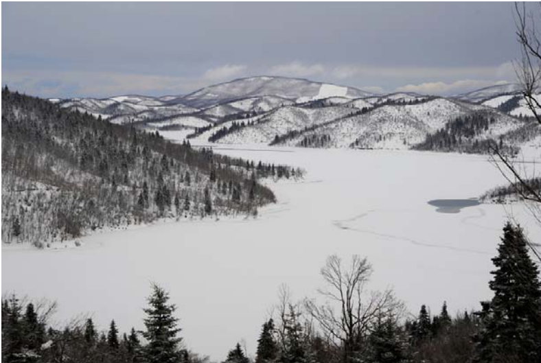
Στο δρόμο από φράγμα για Μπελακομίτη. Η λίμνη παγωμένη.

Η διαδρομή από το φράγμα για Νεοχώρι μας έκανε σαφές ότι δεν θα χρειαζόταν να κάνουμε 4Χ4 σε χωματόδρομους τους οποίους άλλωστε δεν θα μπορούσαμε ούτε να διακρίνουμε που αρχίζουν. Κάναμε όμως στην ασφαλτο. Τα πάντα θαμένα κάτω από τόνους χιόνι. Ο δρόμος θύμιζε ένα μονοπάτι με χώρο μόνο για ένα αυτοκίνητο και παρακαλούσες να μην έρθει κανείς αντίθετα. Το οδόστρωμα χιονισμένο και σε μερικά σημεία ένα παχύ στρώμα φρέσκου χιονιού και πάγου από κάτω, ενώ δεξιά και αριστερά ένας κατακόρυφος τοίχος πάγου και πετρωμένου χιονιού, τον οποίο είχε δημιουργήσει το «μαχαίρι» των μηχανημάτων αποχιονισμού, ύψους από 80 πόντους ως και πάνω από 1,50 μέτρο.