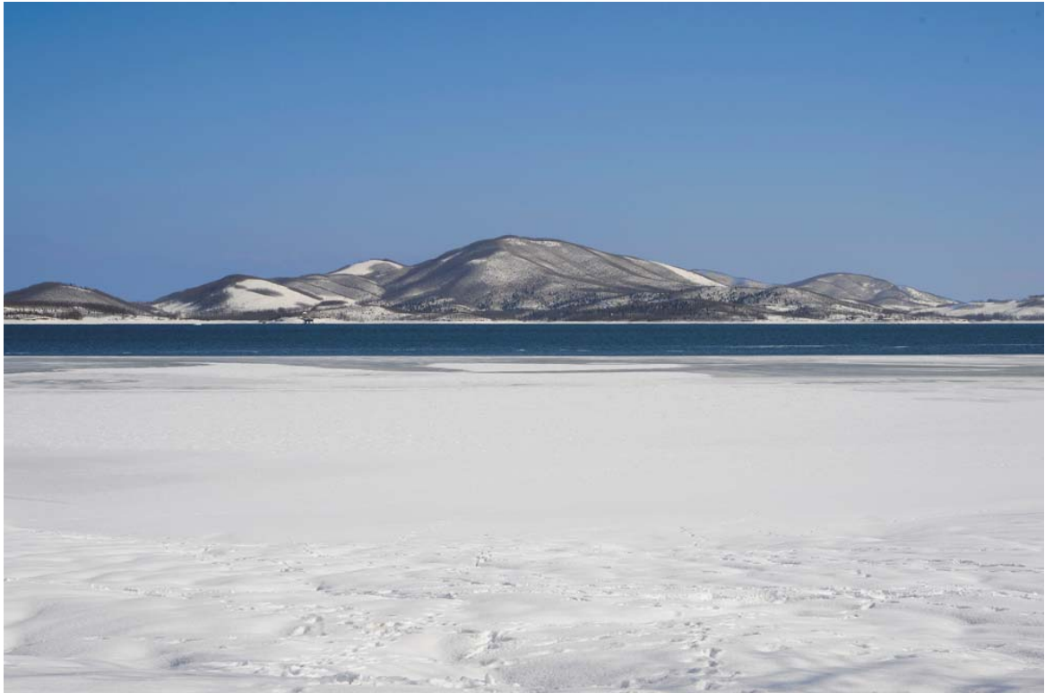
Η πλαζ στα Καλύβια Πεζούλας.