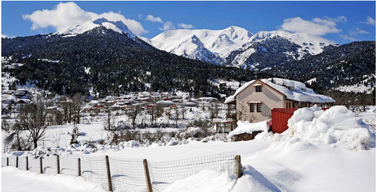
Εξαιρετης ομορφιάς τοπίο στο Κρυονέρι. Στο βάθος η Καζάρμα.