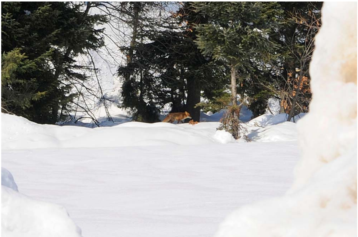
Η εμφάνιση μίας αλεπούς μας έλυσε την απορία για τα ίχνη στο χιόνι.