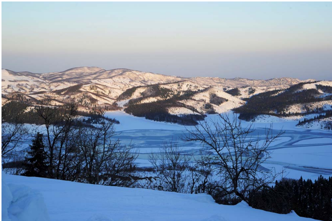
Παγωμένη λίμνη Πλαστήρα. Πρωτόγνωρες εικόνες.