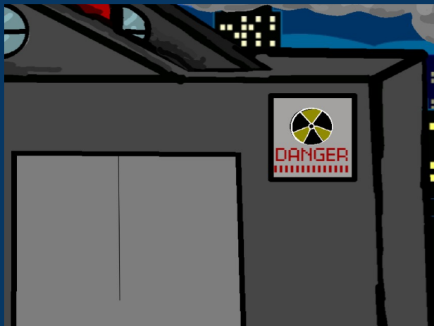
Εικόνα του εργοστασίου μας