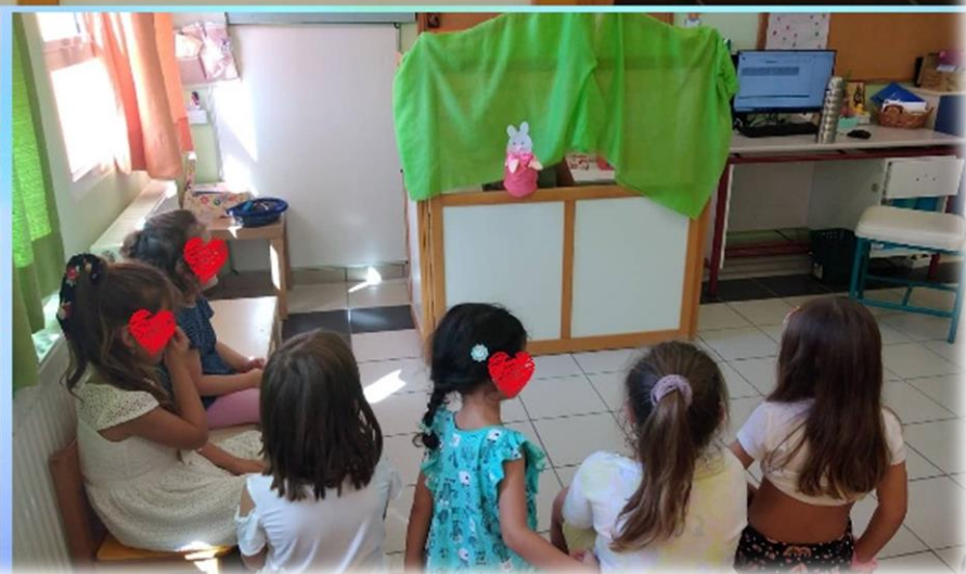
Κουκλοθέατρο «Το κουνελάκι δεν θέλει να πάει σχολείο»