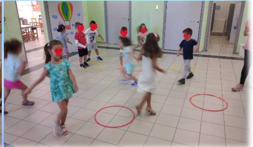
Μουσικοκινητικό Παιχνίδι για την προώθηση της συνεργασίας: «Τα νησάκια»