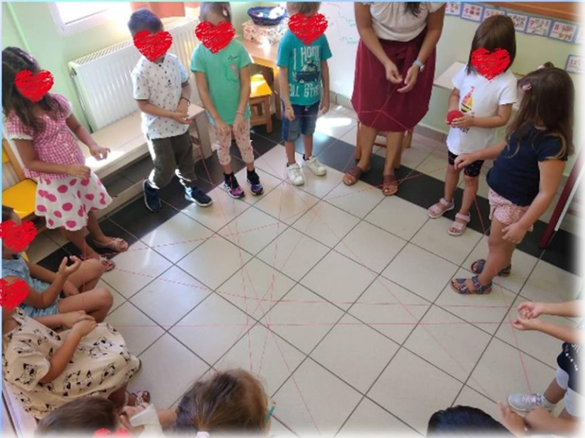
Ο ιστός της αράχνης