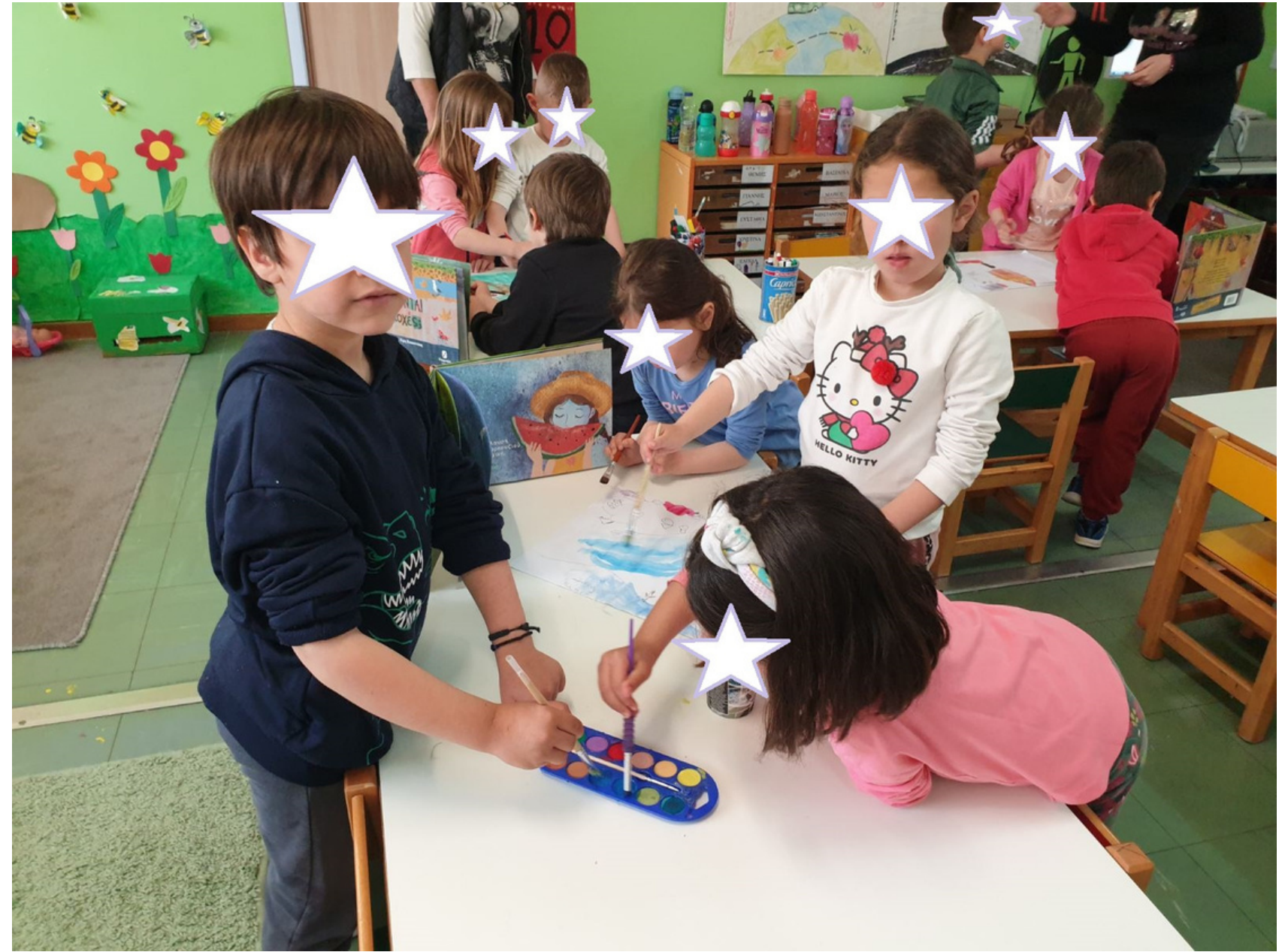
Εργασία των παιδιών σε ομάδες