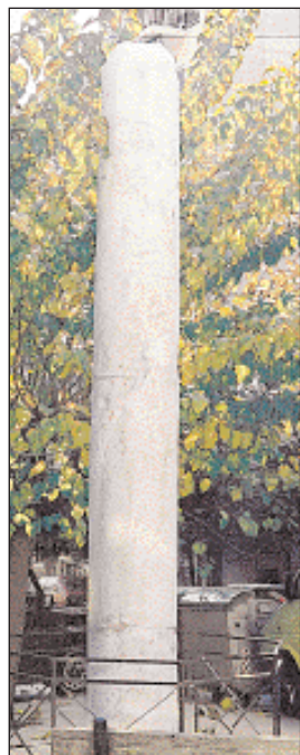
◀ Το κολονάκι της πλατείας Κολωνακίου.