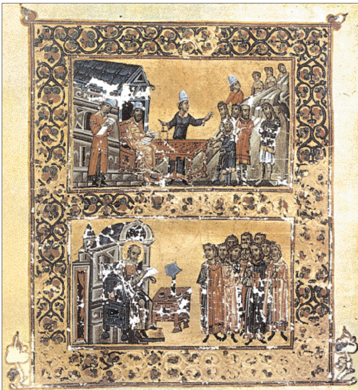
▲ Σκηνή είσπραξης φόρων (επάνω) σε μικρογραφία (14ος αι.) από τις Ομιλίες του Γρηγορίου Ναζιανζηνού. Παρίσι, Εθνική Βιβλιοθήκη (πηγή: «Ιστορία των Ελληνικού Έθνους», Εκδοτική Αθηνών).