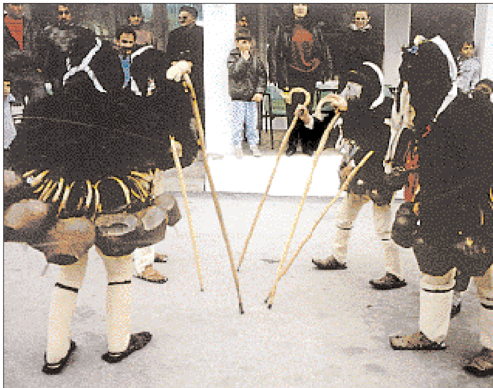
◀ Ομάδες «Γέρων» χορεύουν κυκλικά γύρω από ένα κέντρο που σχηματίζουν στο έδαφος με τις μαγκούρες τους.

Οι κατά καιρούς μελετητές, ανάλογα ο καθένας με το πνεύμα της εποχής του και τη σχολή στην οποία ανήκε, έδωσαν ερμηνείες ως προς την προέ-