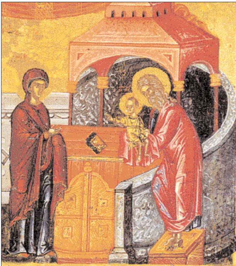
◀ Υπαπαντή. Η Παναγία παραδίδει το Βρέφος στον Άγιο Συμεών. Λεπτομέρεια εικόνας του τέλους του 15ου αι. Πάπμος, Μονή Αγ. Ιωάννου Θεολόγου.

Την ημέρα της Παναγίας της Παπαντής (Υπαπαντή του Χριστού, στις 2 Φεβρ.) αργούν οι μυλωνάδες στην Κρήτη, που την έχουν προστάτιδά τους (Μυλιαργούσα). Την αργία τηρούν και οι αγρότες, για να μην πέσει καλάζι και καταστρέψει τη βλάστηση. Καθώς αλλάζει ο καιρός με την εποχή, προβλέπουν τις μεταβολές του για τις επόμενες μέρες. Είναι χαρακτηριστικές οι παροιμακές εκφράσεις: «Καλοκαιρία της Παπαντής, μαρτιάτικος χειμώνας» ή «Ο,τι καιρό κάμει τση Παπαντής, θα τον κάμει σαράντα μέρες».