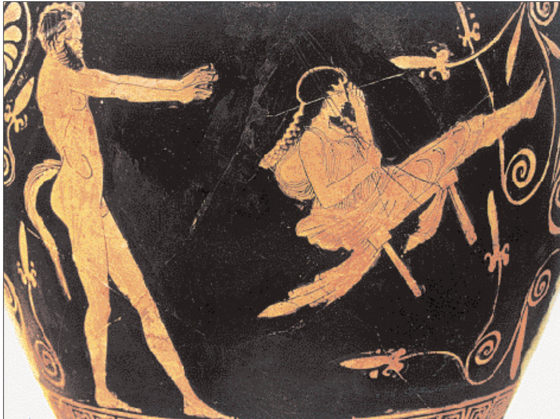
▲ Σάτυρος κοννάει μια κοπέλα κατά το έθιμο της αιώρας. Αττικός σκύφος, 5ος αι. π.Χ. Βερολίνο, Αρχαιολογικό Μουσείο.

ΣΤΗΝ ΑΡΧΑΙΑ ΑΘΗΝΑ εορτάζονταν στις 27 του Γαμηλιώνος, προς τιμήν του Διός Τελείου και της Ηρας, τα Θεογάμια, τα οποία ο Deubner είχε ταυτοποιήσει με τα Γαμήλια, απ' όπου και το όνομα του μηνός. Θυσίαζαν επίσης στην Κουροτρόφο και τον Ποσειδώνα. Η εορτή ετελείτο «τετράδι φθίνοντος» (ή άλλως «τετράδι μετ' εικάδας»). Η ημέρα αυτή δεν είναι η 24η του μηνός, αλλά η 27η, διότι μετά την εικοστή (εικάς) οι Αθηναίοι μετρούσαν τις ημέρες αντιστρόφως, αρχίζοντας δηλαδή από το τέλος του μηνός