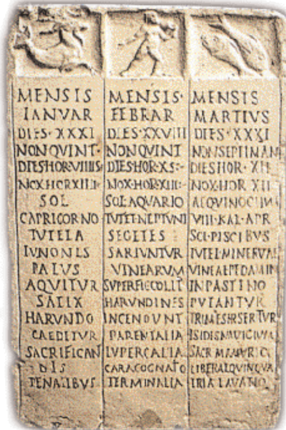
▲ Τμήμα από έγγραφο ρωμαϊκό καλεντάριο, με αναγραφές για τους Ιανουάριο, Φεβρουάριο και Μάρτιο και τα αντίστοιχά τους ζωδιακά σύμβολα: Capricorno (Αιγόκερως), Aquario (Υδροχόος), Pesci (Ιχθύες), αντιστοιχώς. Κάτω από τις ονομασίες των μηνών, η διάρκειά τους σε ημέρες. Στον Mensis Febrar διαβάζουμε: Dies XXVIII (= Ημέρες 28) και (τις εορτές) Lupercalia και Parentalia.