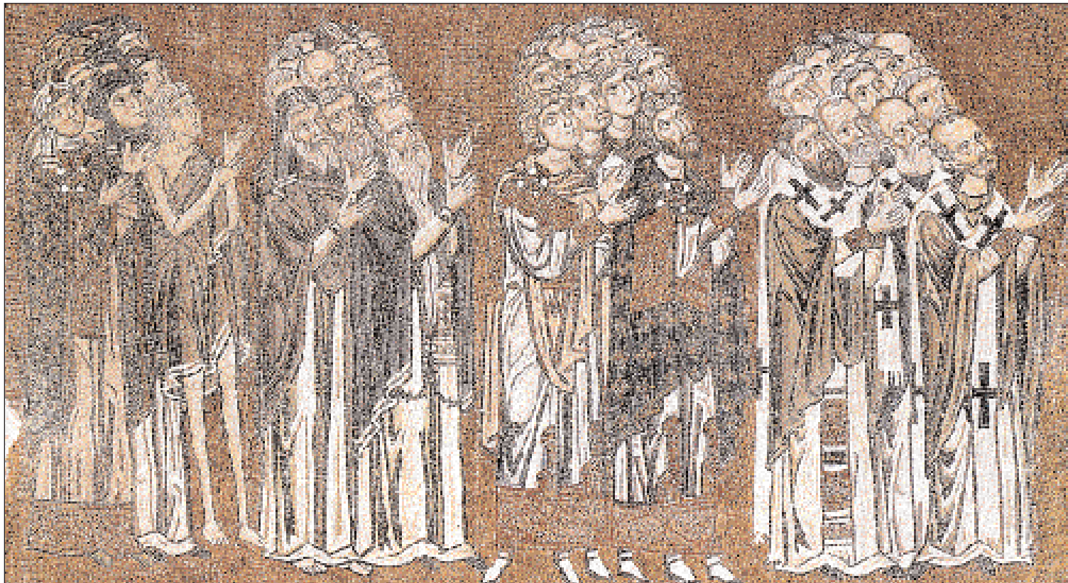
◀ Οι δίκαιοι στον Παράδεισο, τμήμα ψηφιδωτής παράστασης της Δευτέρας Παρουσίας, αρχές 12ου αι. Βενετία, Τορτοέλο, Santa Maria Assunta.