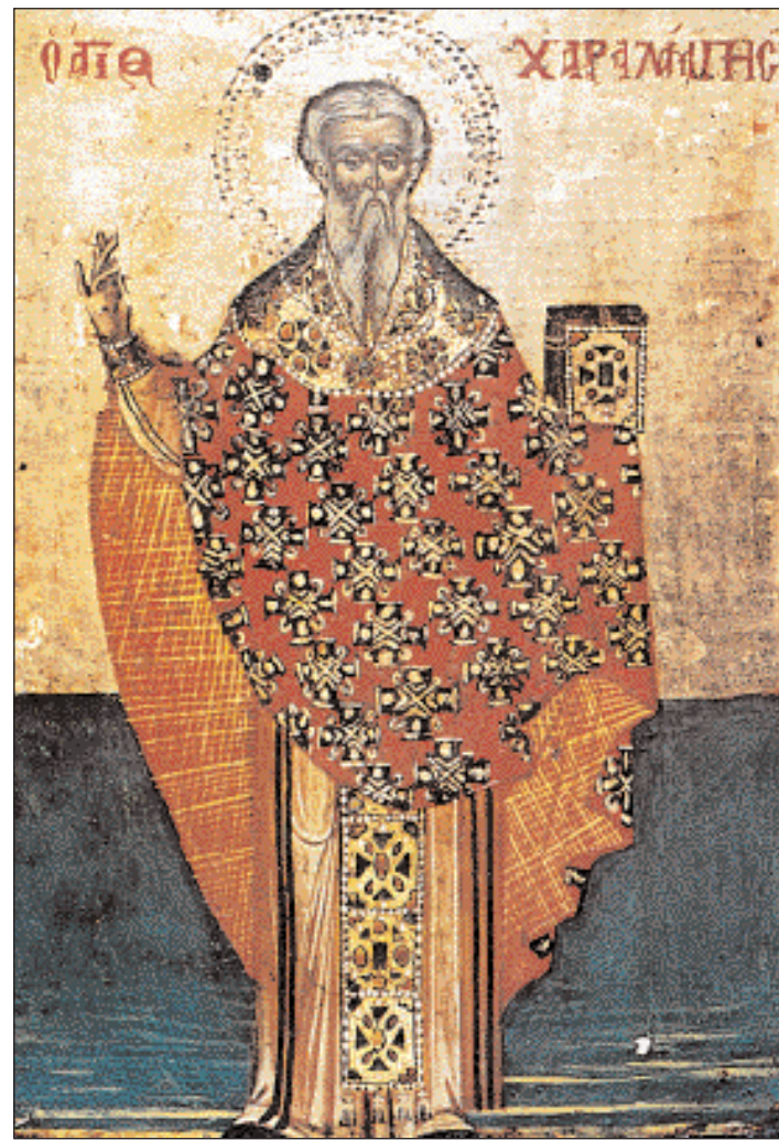
▲ Ο Άγιος Χαράλαμπος, εικόνα του 18ου αι. στο σκεοφυλάκιο της Μονής του Αγ. Ιωάννου του Θεολόγου, Πάμος.