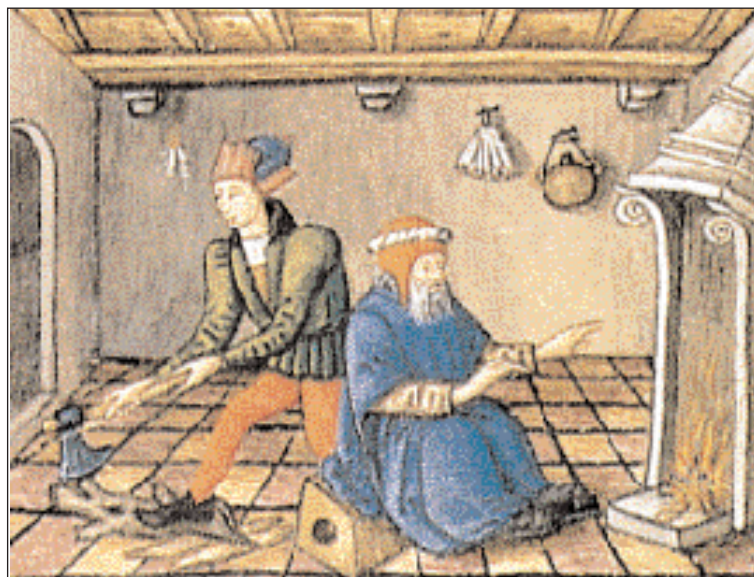
► Ο Φεβρουάριος ως ηλικιωμένος άντρας που ζεσταίνεται στο τζάκι. Μικρογραφία από το χειρόγραφο Λειτουργικόν (Missal) του αρχιτεπιοκόπου Αλόνσο Καρίγιο της Ακούνια, 1446-1482. Καθεδρικός του Τολέδο, Ισπανία (πηγή: T. P. Higuera, «Medieval Calendars»).