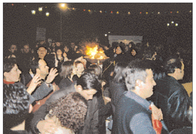
▲ Νυκτερινό σιγμιόνινο από το έθιμο του Φανού στην Κοζάνη. Αποκριά του 2000 (φωτ. Γ. Αικατερινίδης).