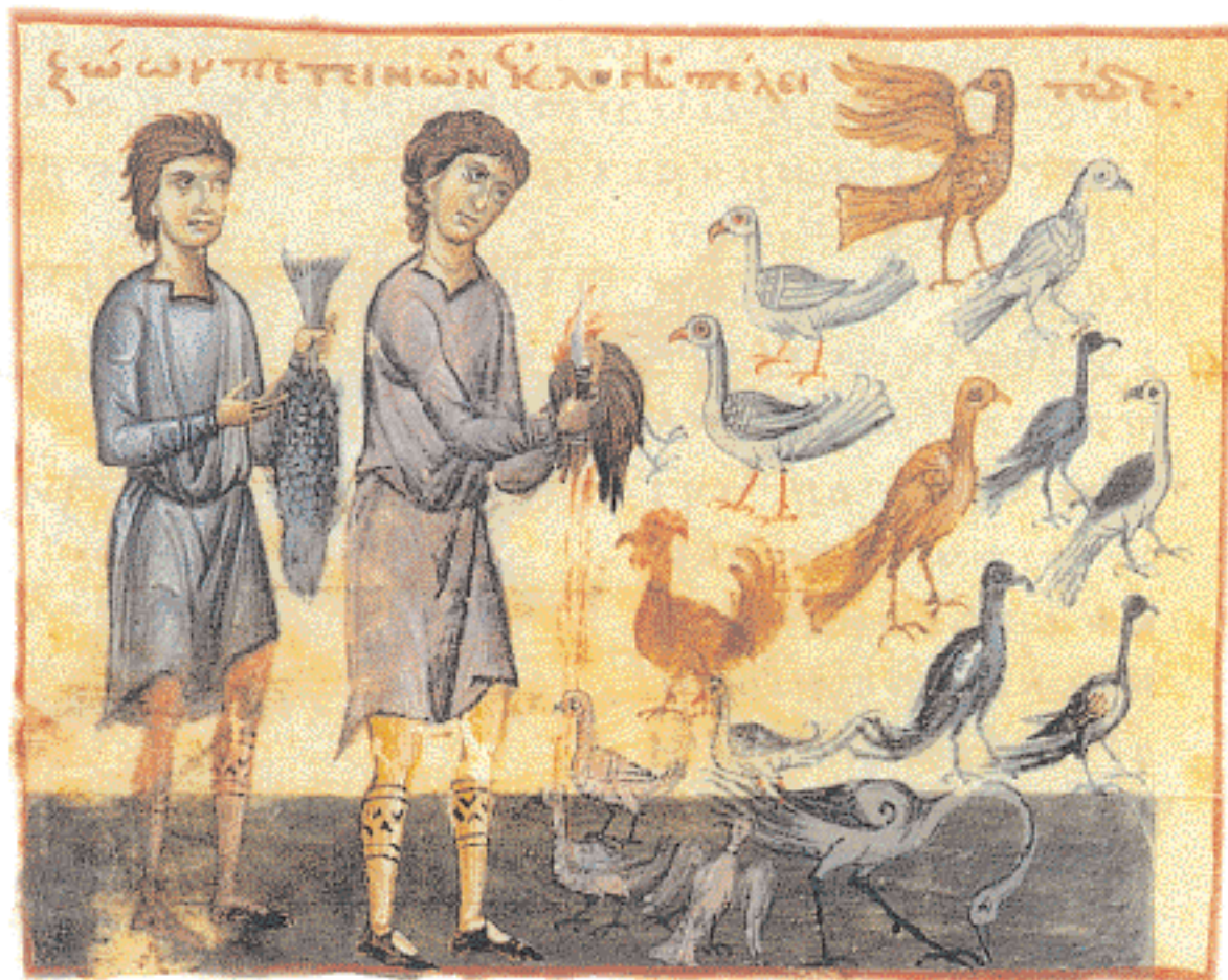
▲ Καθαρά και ακάθαρτα ζώα, μικρογραφία χειρογράφου των 14ου αι. Αγίου Όρους, Μονή Βατοπαιδίου.

σεως δηλαδή μιας «φορολογίας», μπορεί να ερμηνευθεί «πολιτικώς» και η εντολή της αποχής από ορισμένες τροφές για ορισμένο χρονικό διάστημα. Η περίοδος της νηστείας, που αρχίζει ύστερα από τις Απόκριες, διαρκεί επτά εβδομάδες, δηλαδή 49 ημέρες. Από το σύνολο αυτών των ημερών, αν αφαιρεθούν τα Σάββατα και οι Κυριακές, τότε μένουν νηστήσιμες 36. Αυτός, λοιπόν, ο αριθμός συνιστά την «αποδεκάτωση του έτους», το οποίο, βέβαια, αποτελείται από 365 ημέρες. Έτσι, αφού ο άνθρωπος λαμβάνει κατά χάριν τροφή για διάστημα 365 ημερών, πρέπει, κατά αναλογία προς τους πολιτικούς νόμους, να καταβάλει μέσω του περιορισμού των τροφών, την δεκάτη.