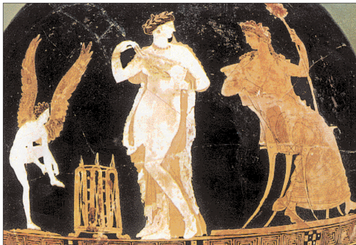
► Διόνυσος καθιόμενος σε κλισμό στρέφεται προς γυναίκα που προσωποποιεί την πομπή των Ανθεοτηριών. Χόες, 4ος αι. π.Χ. Νέα Υόρκη, Μητροπολιτικό Μουσείο.

Ανθεστήρια και Μυστήρια εν Αγραις, οι μεγάλες εορτές του τέλους του χειμώνα στην αρχαία Αθήνα