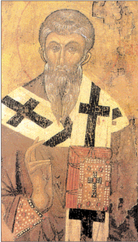
▲ Ο Άγιος Βλάσιος, εικόνα του 1330 (:), από το ναό του Χριστού Παντοκράτορος στην Κυριώτισσα Βεροίας (πηγή: Θ. Παπαζώτων, «Βυζαντινές Εικόνες της Βεροίας», εκδ. Ακρίτας).