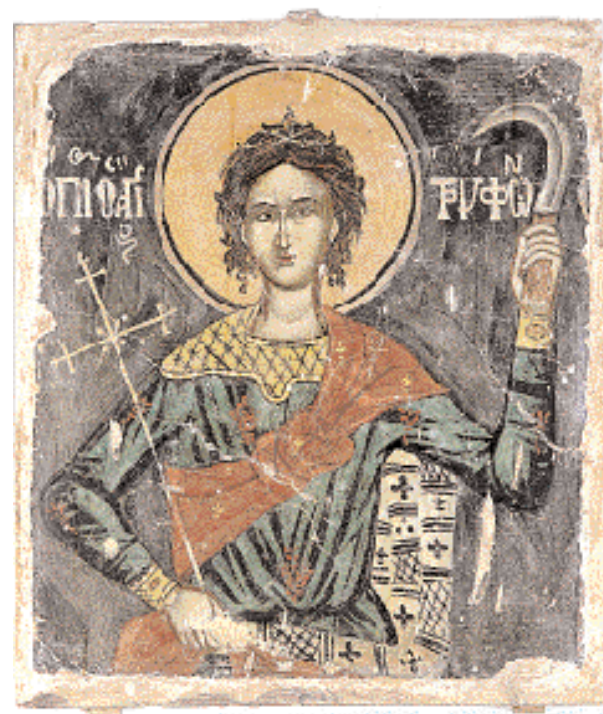
► Ο Άγιος Τρύφων, προστάτης των αμπελιών και των αγρών, με κλαδευτήρι στο αριστερό του χέρι. Σωζόμενη τοιχογραφία από κατεδαφισμένο σήμερα ναό στην Αιαλάντη (18ος αι.). Αθήνα, Βυζαντινό Μουσείο.

Αγροδίατοι, βουκολικοί και «αστοί» άγιοι - Δοξασιές και τελεστικά της λαϊκής λατρείας