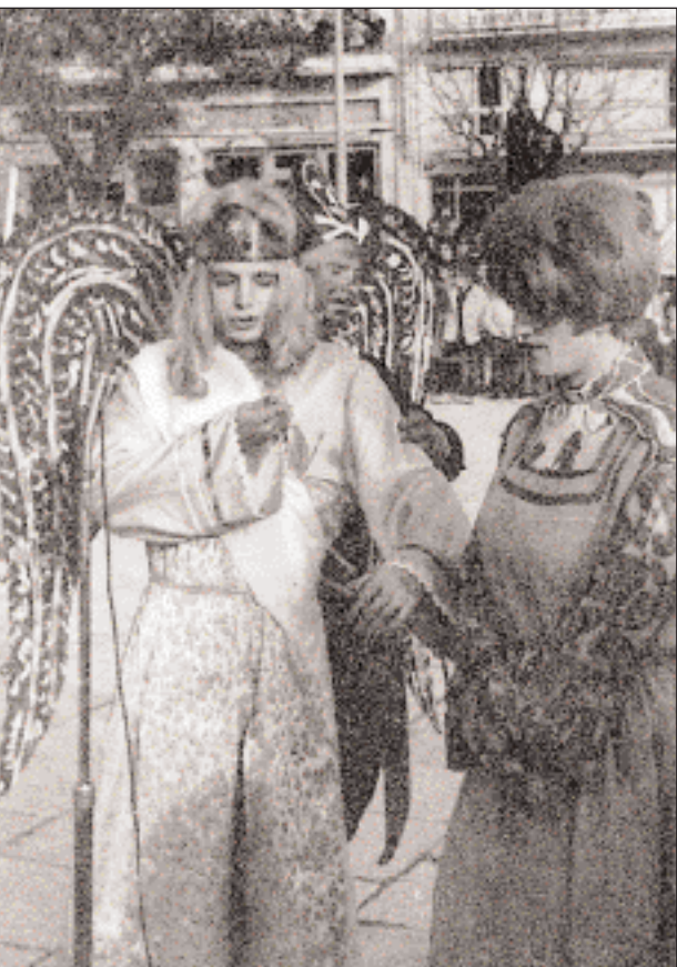
◀ Η Βασιλοπούλα/Ερωφίλη αντικοινεί. Σκηνή από παράσταση του «Πανάρατου» στο Καρπενήσι στα τέλη της δεκαετίας του 1970.