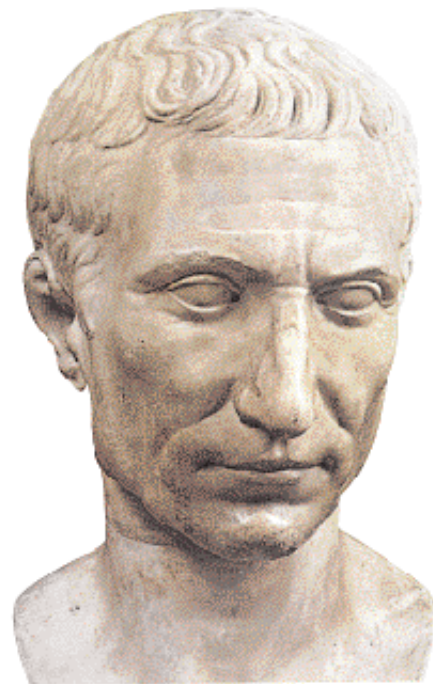
▲ Προτομή του Γαϊού Ιουλίου Καίσαρα. Ρώμη, Εθνικό Ρωμαϊκό Μουσείο.