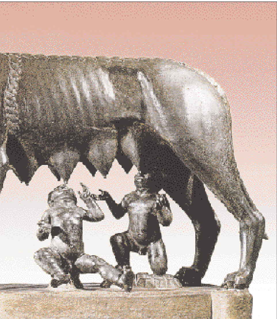
▲ Χάλκινο ρωμαϊκό γλυπτό σύμπλεγμα της Λύκαινας να θηλάζει τους δίδυμους Ρώμο και Ρωμέλο, μυθικούς ιδρυτές της Ρώμης. Ρώμη, Μουσείο Καπιτωλίου.