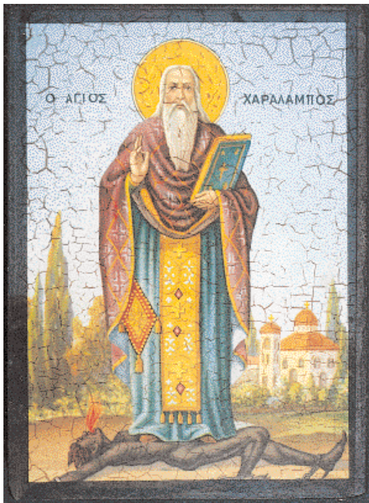
▲ Εικόνα του Αγίου Χαραλάμπου. Ο διώκτης της πανώλης εικονίζεται να ποδοπατεί τη φοβερή αρρώστια προσωποποιημένη σαν κακόμορφη γυναίκα.