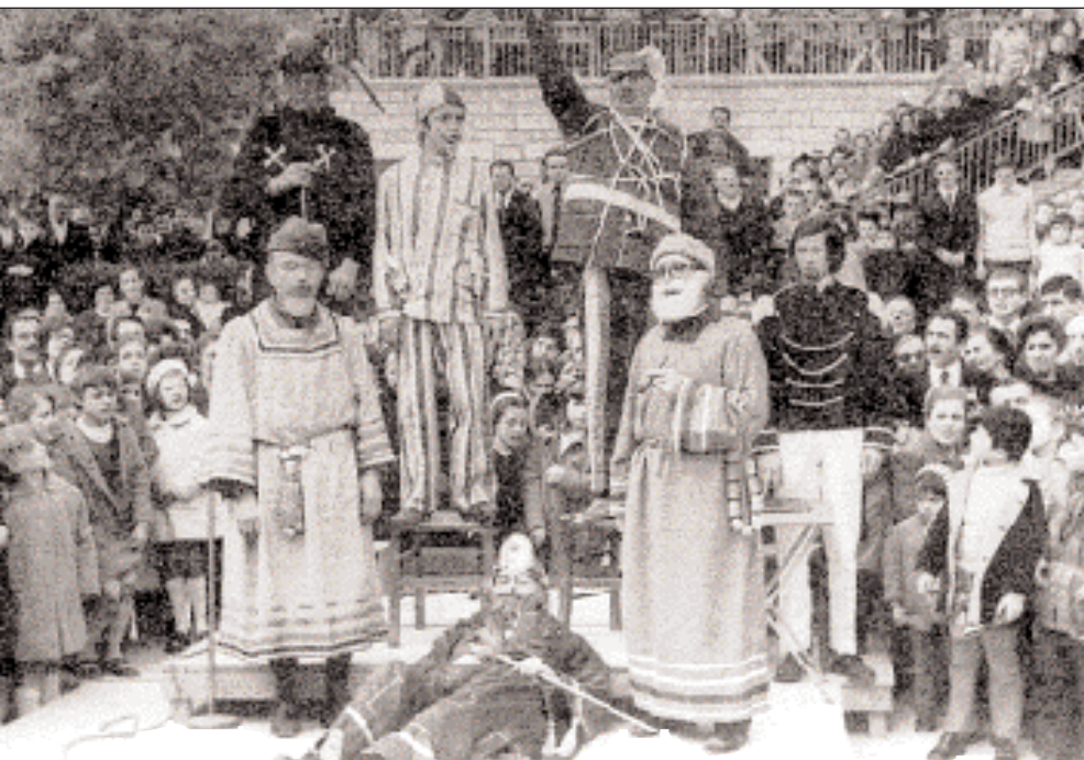
▼ Ο θάνατος του Βασιλιά/Φιλόγονου. Σκηνή από παράσταση στο Καρπενήσι (1975-1980).

ου, το Φανάρι Καρδίτσας και το Καρπενήσι. Παράλληλα υπάρχουν πληροφορίες για παραστάσεις του «Πανάρατου» τον (προ)προηγούμενο αιώνα (περίπου 1870) στα Γιάννενα, την περιοχή της Κόνιτσας, τα Τρίκαλα, τη Βίτσα και το Μονοδένδρι Ζαγορίου κ.α. Στίχοι αποσπασματικοί, εξ άλλου, στις ίδιες περιοχές μαρτυρούν την ύπαρξη σχετικού κειμένου, το οποίο έχει ξεχαστεί. Η παράδοση του κειμένου των λαϊκών παραστάσεων της Ερωφίλης είναι γραπτή και διασώζεται σε χειρόγραφα (οι παραλλαγές από τα Γιάννενα και το Καρπενήσι) ή προφορική (οι υπόλοιπες παραλλαγές). Ιδιαίτερο ενδιαφέρον παρουσιάζει