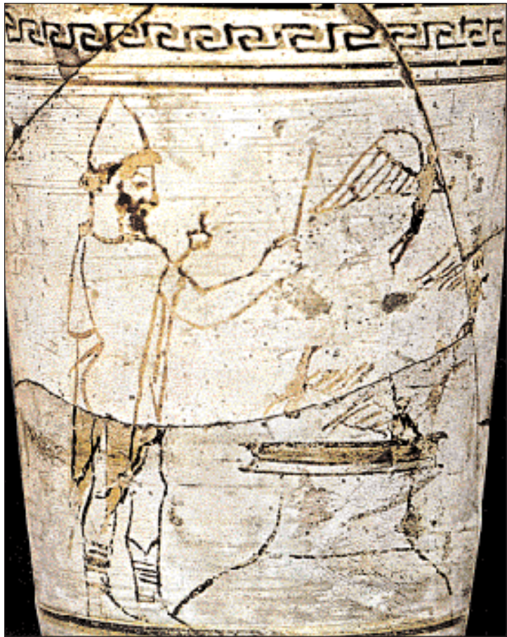
◀ Ο Ερμής παρασιτέκει στην άνοδο των ψυχών. Η παράσταση αυτή έχει σχεδιαστεί με τα Πιθοίγια, την πρώτη ημέρα της μεγάλης αθηναϊκής γιορτής των Ανθεστηρίων. Λευκή Λήκυθος του 5ου αι. π.Χ. Ίενα, Δημοτικό Μουσείο (πηγή: Ιστορία του Ελληνικού Έθνους, Εκδοτική Αθηνών).

Τόπος συνάντησης η γη. Μπορεί κάποιο θεοπροικιστό ζωντανό να πραγματοποιήσουν «κατάβαση» στον Άλλο Κόσμο, μα οι πολλοί θα 'ταν ανήμποροι. Έτσι, οι ψυχές ανεβαίνουν εκείνες σε μας. Στον Αρχαίο Κόσμο, ο Ερμής, ξεχνώντας ότι υπήρξε ο Ψυχοπομπός τους, γινόταν για λίγο και Ψυχαγωγός, και, στα Ανθεστήρια, τις ανέβαζε κοντά μας για λίγο – οι παραστάσεις αφθονούν. Κι εκείνες τριγύριζαν κοντά μας στα δειπνα – « πεπιστευέ-κασι δ' ουν τας ψυχάς αναπεμπομένας κάτωθεν δειπνείν μεν ως οιον τε περιπετομένας την κνίσαν και τον καπνόν, πίνειν δε από του βόθρου μελίκρατον » (Λουκιανός), ενώ σ' ένα ανάγλυφο νεκρόδειπνο της Χαλκιδικής, ψυχές-πεταλούδες φτεροκοπούν, θυμίζοντάς μας του Σικελιανού τον «Ελληνικό Νεκρόδειπνο».