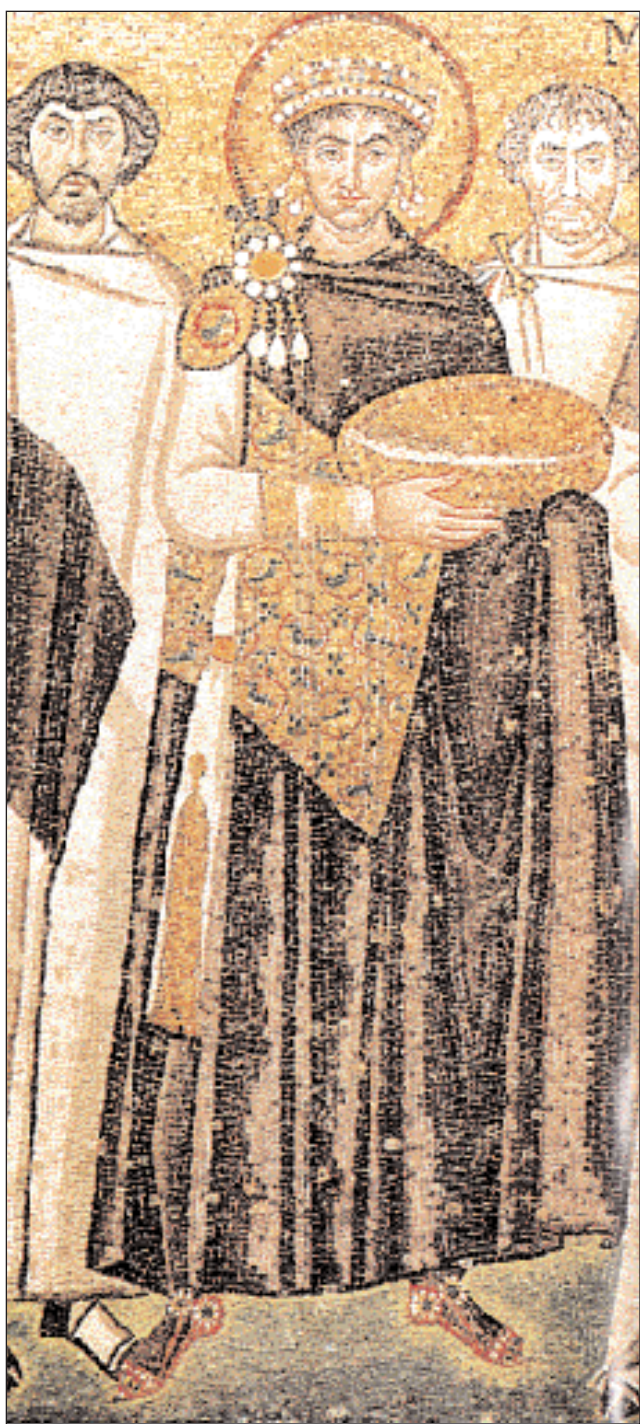
▲ Ο αυτοκράτορας Ιουστινιανός (527-565) πλαισιωμένος από κοσμικούς και εκκλησιαστικούς αξιωματούχους. Λεπτομέρεια ψηφιδωτού στην αψίδα του ιερού της εκκλησίας του Αγίου Βυαλίου στη Ραβέννα (Ιταλία).