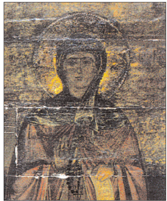
▲ Εικόνα της αγίας Φιλοθέης (πηγή: Ζωής Γκενάκου, «Η επανάσταση μιας γυναίκας», εκδ. Σύλλογος των Αθηναίων, Αθήνα 1985).

Το έργο της, που έγινε γνωστό σε ολόκληρη τη Βαλκανική και βοηθήθηκε από παντού, προκάλεσε την μίση των Τούρκων. Στις 2 Οκτωβρίου 1588, η Φιλοθέη συνελήφθη και εμάρτυρσε. Πέθανε λίγο αργότερα, στις 19