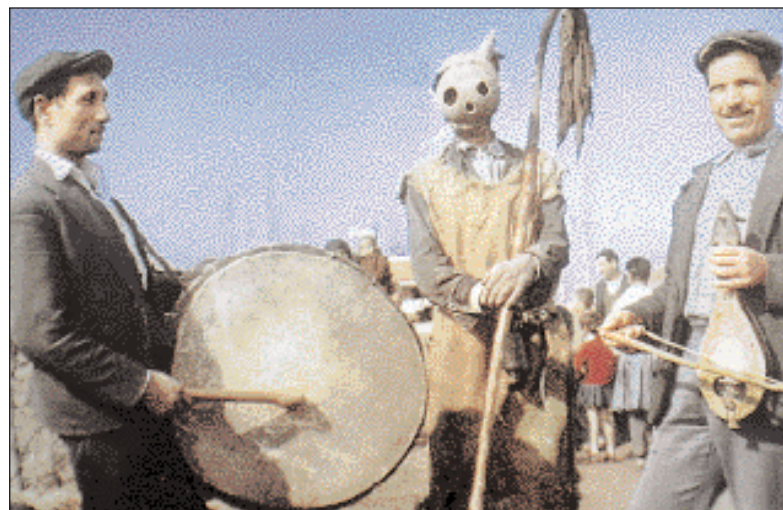
▲ Ο Καλόγερος, κεντρικό πρόσωπο στο ομώνυμο δρώμενο της Τυρινής Δευτέρας, στην αρχέγονη λαιρευτική του μορφή αντιπροσωπεύει την αγαθή θεότητα της σποράς και της πλούσιας σοδειάς. Τον συνοδεύουν νταούλι και λύρα. Αγία Ελένη Σερρών, 1967.

Ενώ η Πέμπτη της Κρεατινής είναι μέρα ιδιαίτερης χαράς, το Σάββατο της ίδιας εβδομάδας, καθώς και τα δύο επόμενα Σάββατα, της Τυρινής και εκείνου της πρώτης εβδομάδας της Σαρακοστής, των αγίων Θεοδώρων, είναι αφιερωμένα στη μνήμη των πεθαμένων. Στα Ψυχοσάββατα αυτά φαίνεται ότι συνεχίζεται αρχαία συνήθεια, αν