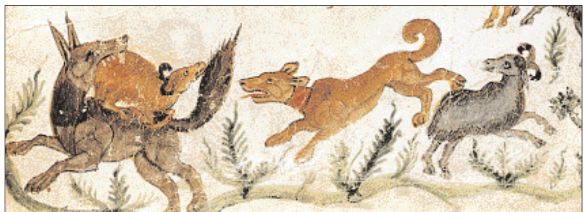
▲ Λύκος επιτίθεται σε κοπάδι προβάτων. Μικρογραφία (λεπτομέρεια) σε χειρόγραφο φαλιτήριο του 11ου αι. που εικονίζει τον Δαβίδ και το ποίμνιό του. Λονδίνο, Βρετανική Βιβλιοθήκη.

και απολάμβανε τη θαλπωρή του παραδείσου. Τους είδε έτσι ο Θεός και κατάλαβε γιατί οι άνθρωποι τιμούν τον Νικόλαο. Επέπληξε, λοιπόν, τον Κασσιανό και όρισε να γιορτάζεται κάθε τέσσερα χρόνια, για την οκνηρία του.