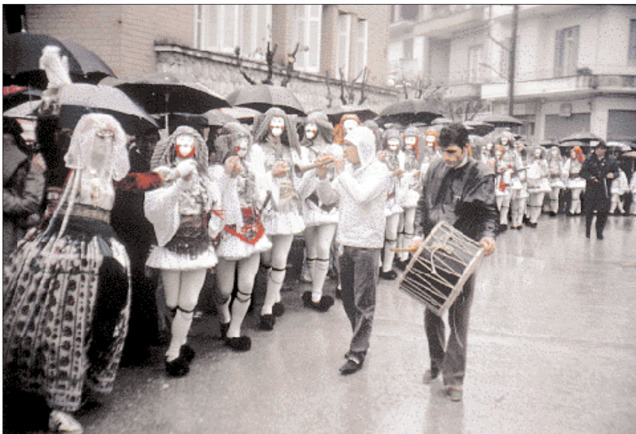
◀ Στις αποκριάτικες μεταμφιέσεις της Νάουσας πρωταγωνιστούν οι Μπούλες και οι Γενίσαροι, που γυρίζουν χορεύοντας στους δρόμους και τις πλατείες της πόλης. Μια τοπική παράδοση με ρίζες αρχέγονες, αλλά και καταβολές ιστορικές.