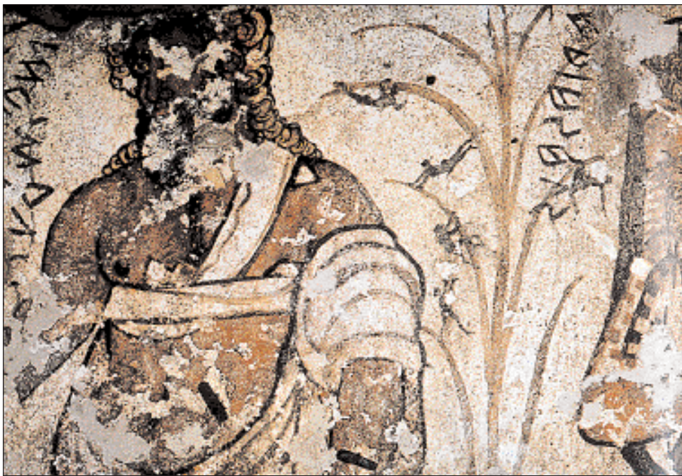
► Τοιχογραφία (Λεπτομέρεια) σε ειρηνικό τάφο της Ταρκυνίας (325 - 300 π.Χ.). Αριστερά ο Αγαμέμνωνας και πίσω τον ψυχές/είδωλα σκαρφαλωμένες στα δέντρα.

που οι ψυχές, ελεύθερες από την Ανάσταση (ή την Μεγάλη Πέμπτη/Παρασκευή), στον Κάτω Κόσμο ξαναγυρίζουν – πικραίνονται όμως, σάμπως και να ξανασυνήθισαν τη γη. Ειπώθηκε πιο πάνω πως ο λαός μας ερήμην της Εκκλησίας μας κράτησε την Ψυχαγωγία των Ανθεστηρίων. Φρόντισε όμως να της δώσει ένδυμα χριστιανικό, κι έτσι διηγούνται: Όταν η Παναγία κοιμήθηκε, πηγαινόντας στον Άλλο Κόσμο είδε τους βασανισμένους, και τους λυπήθηκε, και μεσίτευσε να ξαναγυρίσουν εκεί που ζήσαν άλλοτε, από το Πάσχα μέχρι την Πεντηκοστή. ✠