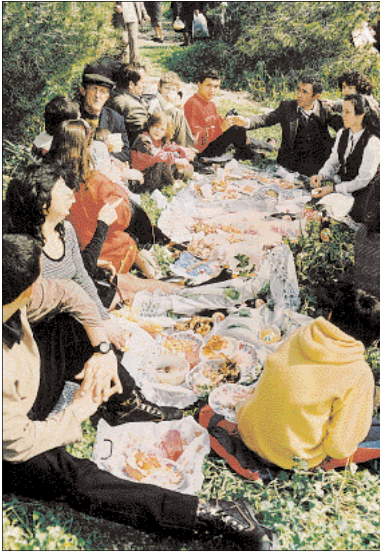
▲ Νηοτήσιμα εδέσματα, οικογενειακή ατμόσφαιρα και προμηνύματα της άνοιξης. Καθαρά Δευτέρα στο λόφο του Φιλοπάππου («Φωτογραφία και Είδηση»).

νει χαρακτήρα δρωμένου, με κύρια επιδίωξη την ευετηρία, την καλοχρονιά. Η επιδίωξη αυτή φαίνεται καθαρά στον θρακικό χώρο, π.χ. στα Πετρωτά του Εβρου, όπου γίνεται εικονικό όργωμα και μμπτική σπορά, στοιχεία με εμφανή αλληγορικό σκοπό. Συμβολισμός για καλοχρονιά υποδηλώνεται και στον γνωστό «βλάχικο γάμο» της Θήβας τη μέρα αυτή. Προξενιό, προικοπαράδοση, ξύρισμα γαμπρού, νυμφοστόλισμα και όλα τα άλλα γαμήλια νόμιμα γίνονται με την καθιερωμένη εθιμική τάξη. Παλαιότερα υπήρχε ένα στοιχείο, το σημαντικότερο όλων, που σήμερα συνήθως παραλείπεται: σε κάποια στιγμή ένας συμπέθερος ή και ο ίδιος ο γαμπρός έπεφτε καταγής, ύστερα δήμεν από κάποια φιλονικία, προσποιούμενος τον πεθαμένο. Αρχίζει μοιρολόγημα και κοπετός. Ξαφνικά όμως ο πεθαμένος σηκώνόταν σαν να αναστηνόταν, με όλους τους συμβολισμούς μιας τέτοιας παράστασης στην ανοιξιάτικη περίοδο.