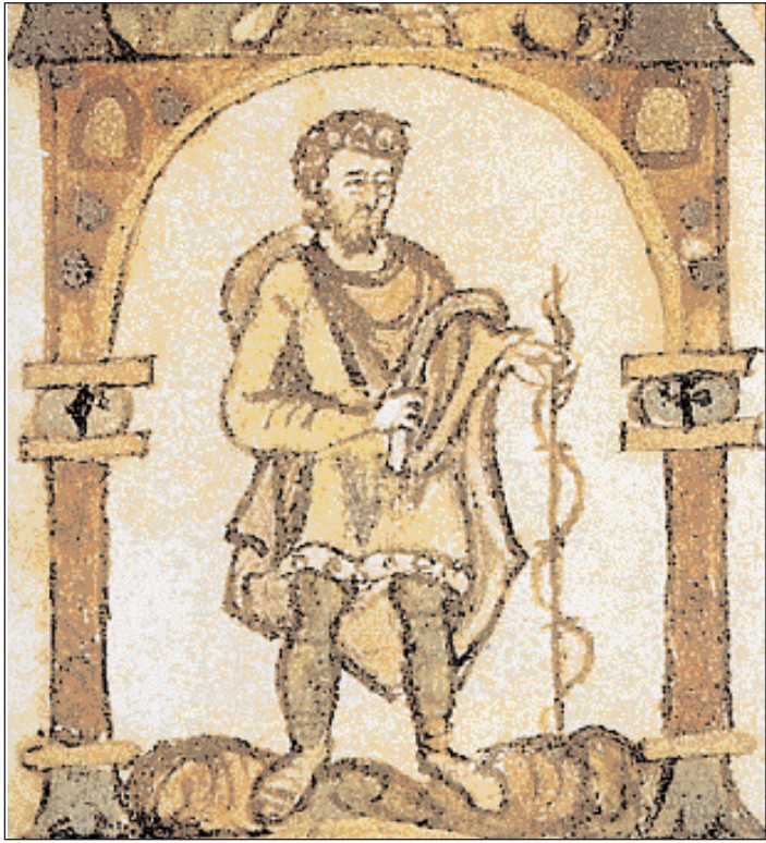
◀ Ο Φλεβάρης – Αϊ Τρύφωνας κάνει έναρξη των αγροτικών εργασιών εν όψει της άνοιξης. Και με το τσαπράζι στο χέρι βάνει εμπρός να κλαδέψει τ' αμπέλια των. Μικρογραφία από το Καλαντάρι της Fulda. Βερολίνο, Εθνική Βιβλιοθήκη (πηγή: T.P. Higuera, «Medieval Calendars»).