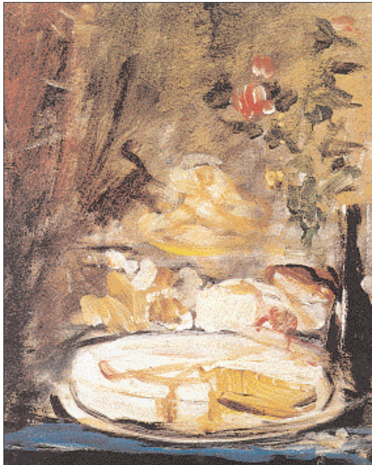
▲ Επιτραπέζιο με εδέσματα και μπονκάλια, ελαιογραφία του Νικολάου Γύση. Αθήνα, Εθνική Πινακοθήκη.

Ακόμα πολλοί μεταμφιέζονταν στο γλέντι της Τυρινής και επισκέπτονταν φιλικά σπίτια. Γινόταν μεγάλη φασαρία με γέλια και αστεία, οι επισκέψεις ανταποδίδονταν κι ύστερα όλοι ξαναγύριζαν στο δικό τους γλέντι για να συνεχίσουν μέχρι τα ξημερώματα.