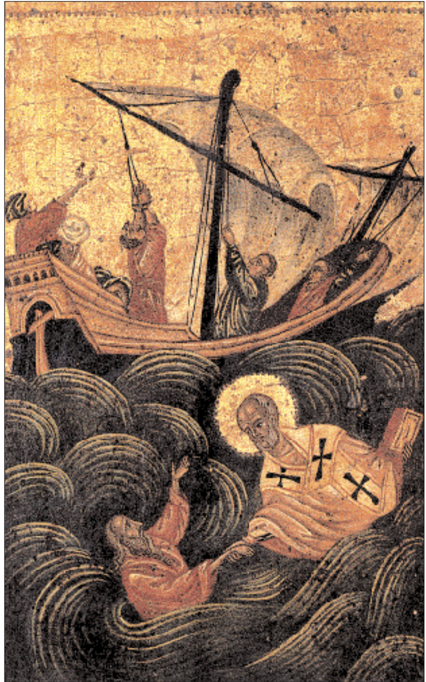
► Ο Άγιος Νικόλαος σπεύδει σε βοήθεια ναυτικών που κινδυνεύουν. Λεπτομέρεια από περίγραπτη εικόνα του αγίου (18ος αι.). Αθήνα, Βυζαντινό Μουσείο.

στον άγιο Νικόλαο κι εκείνος κάλεσε τον άγιο των θαλασσών να ρωτήσει τι συμβαίνει. Ο Νικόλαος έφτασε βρεγμένος και ταλαιπωρημένος από την προσπάθειά του να βοηθήσει τους κινδυνεύοντες, ενώ, αντίθετα ο Κασσιανός ήταν ντυμένος στα χρυσά