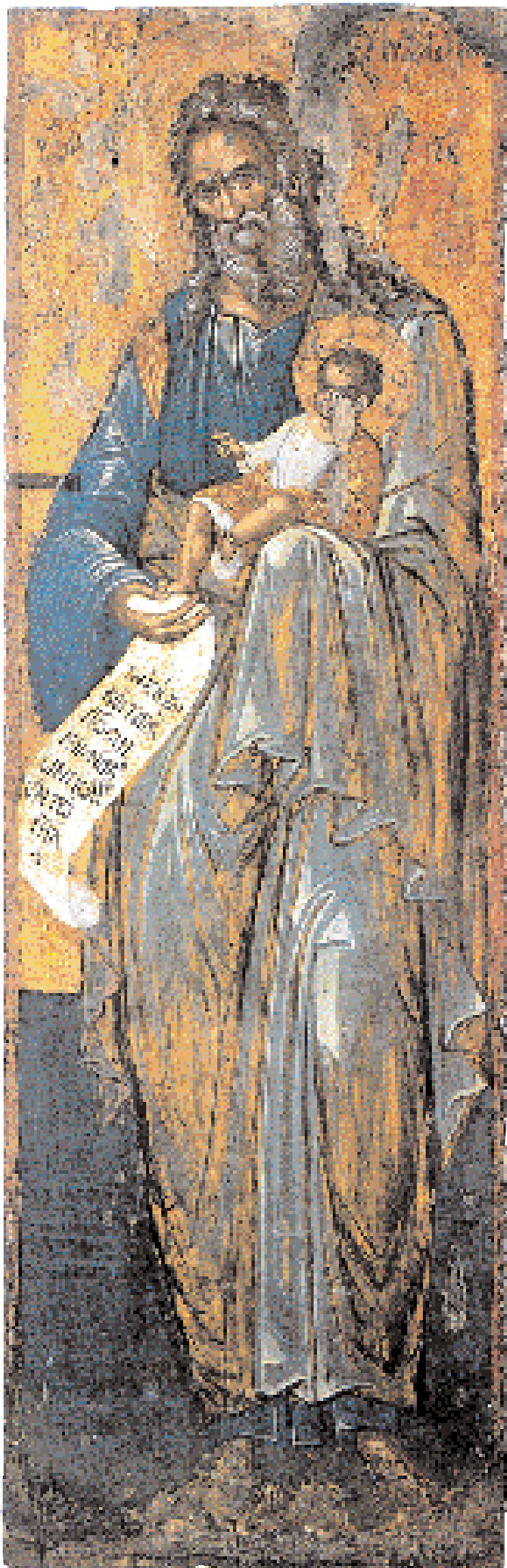
◀ Ο Άγιος Συμεών ο Θεοδόχος, προστάτης των εγκύων γυναικών. Εικόνα του Μιχαήλ Δαμασκηνού (:). 16ος αι. Ναός Αγίου Ματθαίου των Συναϊτών, Ηράκλειο Κρήτης.