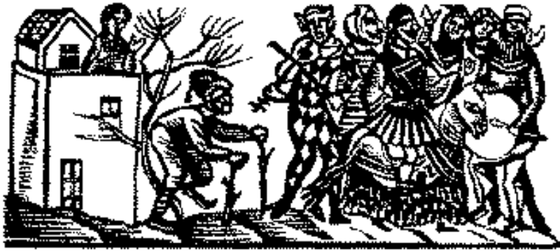
◀ Ο Φλεβάρης, από το «Καλαντάρι τον 1947 με παροιμίες των μηρών», με ξυλογραφίες του Σπύρου Βασιλείου και λαογραφικά του Δημ. Σ. Λουκάτου.

στολίσουν με τις μικρές πολύχρωμες πεταλουδίτσες, ακόμα και κάτι σταφιδιασμένες ανταρτόπληκτες από το παρα-Σούλι που φορούσαν τις μαύρες φορεσιές της επαρχίας τους (...) Κοντά τα μεσάνυχτα οι σουλατσαδόροι παίρνανε κατάκοποι το δρόμο για τα σπίτια. Τότε βγήκαν από τις κοντινές ταβέρνες δυο τρεις συντροφιάς, αγόρια και κορίτσια, με χάρτινα καπέλα και ψεύτικες αποκριάτικες μύτες, και τραγουδώντας παράφωνα άρχισαν να χορεύουν σάμπα στη μέση της πλατείας. Μαζεύτηκε κόσμος γύρω τους και, στην αρχή διστακτικά, ύστερα όλο και περισσότεροι, σχημάτιζαν ζευγάρια και μπαίνανε στο χορό. Το κέφι φούντωσε όταν ξεφύτρωσαν δυο κορνετίστες που συντονίσανε το ρυθμό κι έτσι, μέσα σε λίγη ώρα η κάτω πλατεία είχε γίνει μια μεγάλη πίστα χορού. Οι πιο πολλοί βέβαια ήταν ανίδεοι, ιδιαίτερα από το χορό της σάμπας που τότε είχε αρχίσει να γίνεται της μόδας, προσπαθούσαν όμως να μιμηθούν με άγαρμπες κινήσεις εκείνους που κάτι ήξεραν.