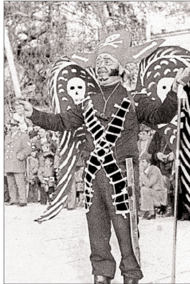
► Ο Χάρος, από την παράσταση του «Πανάρατου» στο Καρπενήσι (1975-1980).