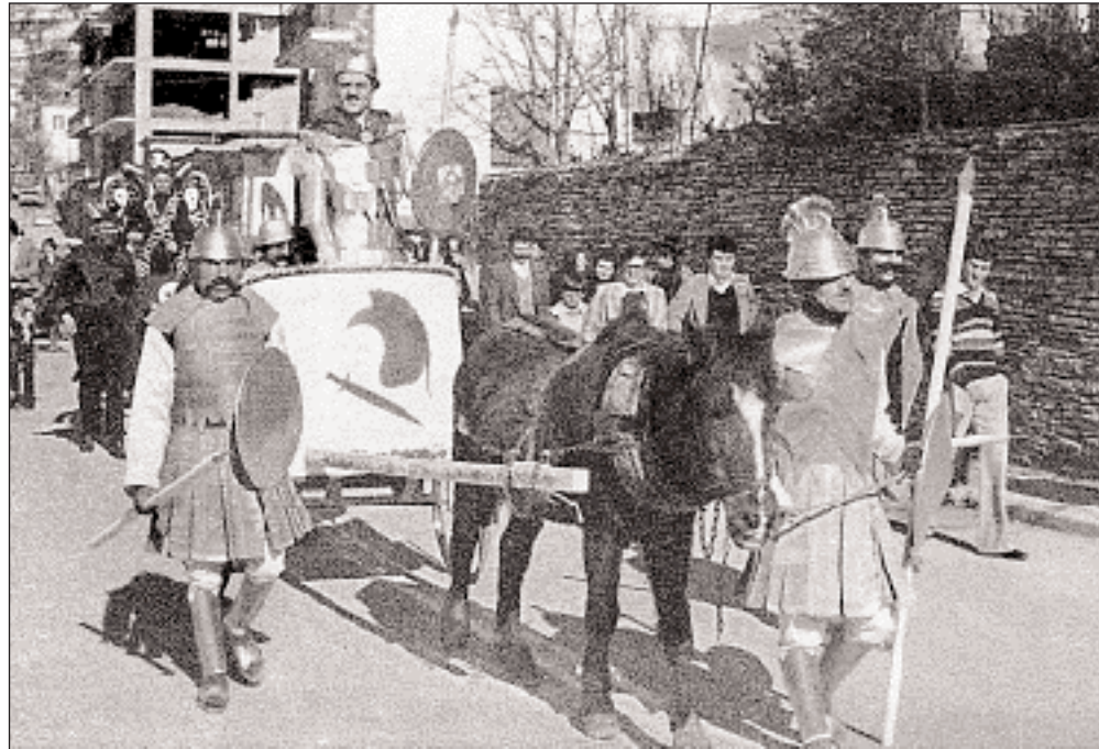
▲ Η είσοδος των ηθοποιών στο χώρο της πλατείας. Από την παράσταση του «Πανάρατου» στο Καρπενήσι το 1980.

στάσεις όπως του «Πανάρατου» να ενταχθούν στον κύκλο των εθιμικών εκδηλώσεων της Αποκριάς. Οι μέχρι σήμερα καταγεγραμμένες και δημοσιευμένες παραλλαγές που συνοδεύονται και από πληροφορίες για τις παραστάσεις του έργου κατά τη διάρκεια της Αποκριάς είναι, εξ όσων γνωρίζω, επτά και ο αριθμός των στίχων τους κυμαίνεται μεταξύ 86 και 313. Προέρχονται από την Αμφιλοχία, τα Γιάννενα, την Αρτα, την περιοχή του τ. Δήμου Μακρινείας Μεσολογγί-