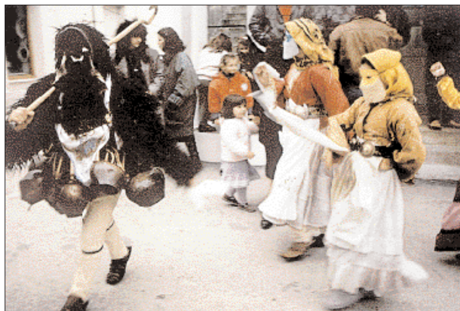
▲ Οι «Γέροι», με κατοικίδια τομάρια και βαριά κουδούνια στη μέση, εισβάλλουν χοροπηδώντας στους δρόμους της Χώρας. Γύρω τους στριφογυρίζουν χορεύοντας οι Κορέλες.

Μεταμφιέσεις με δέρματα ζώων και κουδούνια υπάρχουν, με τοπικές πα-