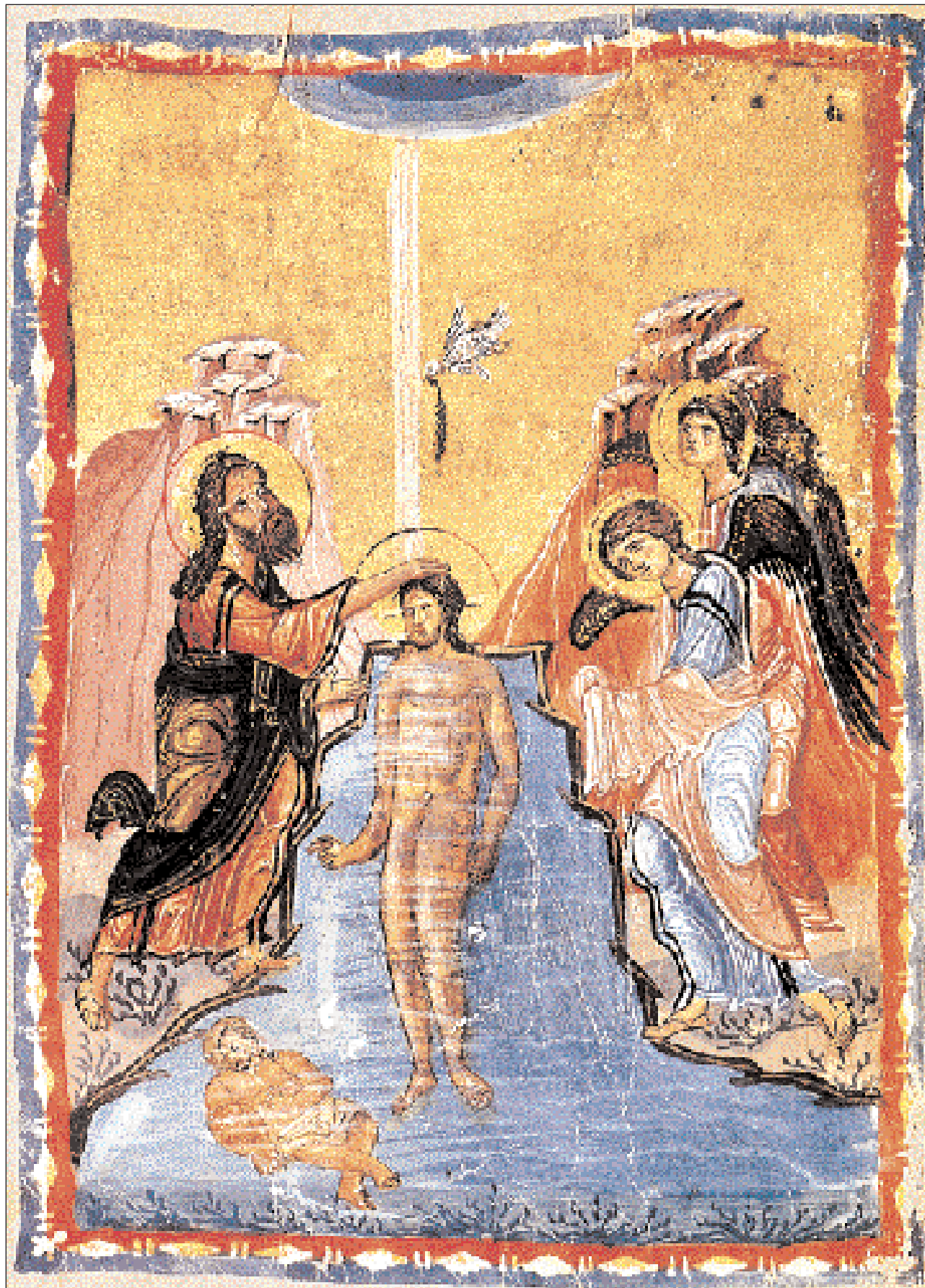
▲ Η Βάπτισις του Χριστού. Μικρογραφία χειρόγραφου Ευαγγελιοταρίου (1120-1170). Αγίου Όρους, Μονή Παντελεήμονος.

Η ανανέωση του κόσμου άρχιζε από την ανανέωση των υδάτων – πρακτικά με την εκκένωση των αγγείων με νερό την παραμονή των Θεοφανίων, συμβολικά με τον αγιασμό των υδάτων με την κατάδυση του σταυρού στο νερό. Αυτός που έβρισκε το σταυρό ήταν ο τιμημένος του χωριού και τον περιέφερε στα σπίτια για προσκύ-