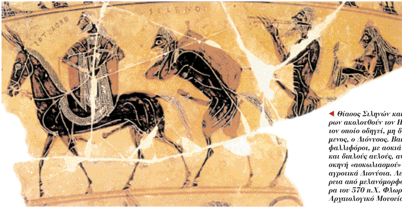
◀ Θίασος Σιληγών και Σατύρων ακολουθούν τον Ηφαιστο τον οποίο οδηγεί, μη διακρινόμενος, ο Διόνυσος. Βακχεύοντες φαλλιφόροι, με ασκιά κρασιού και διπλούς αιλούς, ανακαλούν σκηνή «ασκωλιασμόν» στα αγροικά Διονύσια. Λεπτομέρεια από μελανόμορφο κρατήρα του 570 π.Χ. Φλωρεντία, Αρχαιολογικό Μουσείο.

στα χέρια ένα κατσίκι. Η νυκτερινή ιερουργία περιλάμβανε και διασπαραγμό, όπως διαφαίνεται από τον συσχετισμό με μια «αγροικικήν ωδήν, ή και αυτή περιείχε τον Διονύσου σπαραγμόν».