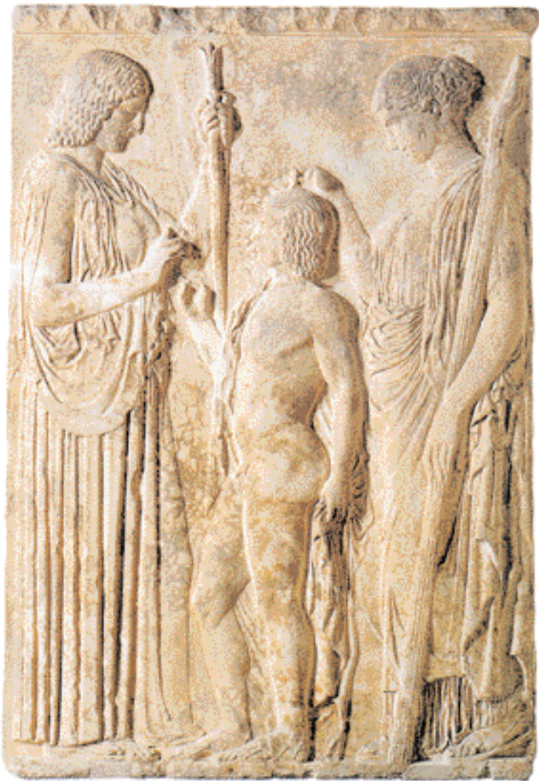
▲ Παράσταση Δήμητρας, Περσεφόνης και Τριπτόλεμου σε αναθηματικό ανάγλυφο του 440-430 π.Χ. Αθήνα, Εθνικό Αρχαιολογικό Μουσείο (πηγή: «Αρχαία Γλυπτά». Εκδοτική Αθηνών).

Στα Αλώα τιμούσαν και τον Διόνυσο, που, κατά τον Πίνδαρο, έχει μακριά και βαθυπλόκαμα μαλλιά και κάθεται δίπλα στην Δήμητρα, που για χάρη της κτυπούν χάλκινα κύμβαλα ( χαλκοκρότου πάρεδρον Δαμάτερος ευρυκαίταν Διόνυσον ). Τη σχέση του Διονύσου με τις Ελευσινίες θεές αποκαλύπτει ένας από τους ορφικούς ύμνους του: Είναι ο Ευβουλεύς, ο γεννημένος από τις «άρρητες» συζυγικές σχέσεις του Διός και της Περσεφόνης ( Διός και Περσεφονείης αρρήτοις λέκτροισι τεκνωθείς ). Η λεπτομέρεια αυτή δεν είναι παρά ένας τρόπος συσχέτισεως του Διονύσου ως «θνήσκοτος» βλαστικού θεού με την Κόρη, τη σύζυγο του Πλούτωνος, του βασιλέως του κάτω κόσμου, ο οποίος κατά τους Ορφικούς ταυτίζεται με τον Δία χθόνιο ( Ζεύ χθόνιε... Πλούτων ), την Κόρη-