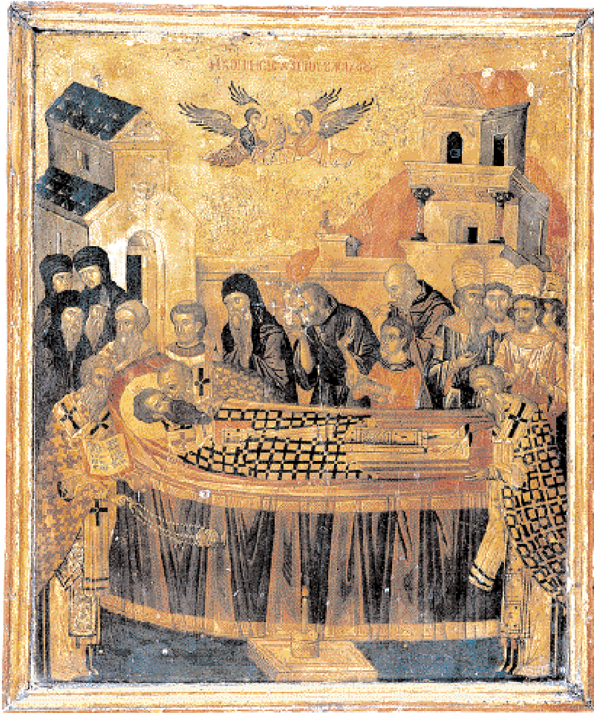
▲ Η Κοίμηση του Μεγάλου Βασιλείου. Εικόνα των αρχών του 16ου αι. Σινά, Ι.Μ. Αγ. Αικατερίνης (πηγή: «Σινά. Οι θησαυροί της Μονής». Εκδοτική Αθηνών, 1990).

κες, ερχόμενοι έτσι σε αντίθεση προς την αρχή της ισότητας όλων των ανθρώπων που καθιερώνει το φυσικό δίκαιο. Ο Γρηγόριος δεν διστάζει να παρατηρήσει: «Ανδρες ήσαν οι νομοθετούντες, διά τούτο κατά γυναικών η νομοθεσία».