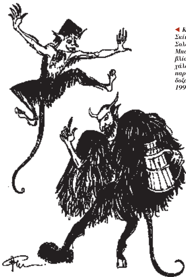
◀ Καλικάντζαροι. Σκίτσο της Ελλης Σολομωνίδου-Μπαλάνου στο βιβλίο του Τίτου Γιοχάλα «Αρβανίτικα παραμύθια και δοξασίες», Αθήνα 1997.

Ελεγον προς αλλήλους οι χωρικοί, σκωπτόμενοι, απωθούμενοι, ενώ αίφνης ηκούετο από της τραπέζης του χαρτοπαιγνίου πάταγος βαρύς και ανεπήδων άνωθεν της κεφαλής των παικτών τεμάχια παιγνιοχάρτων, ως