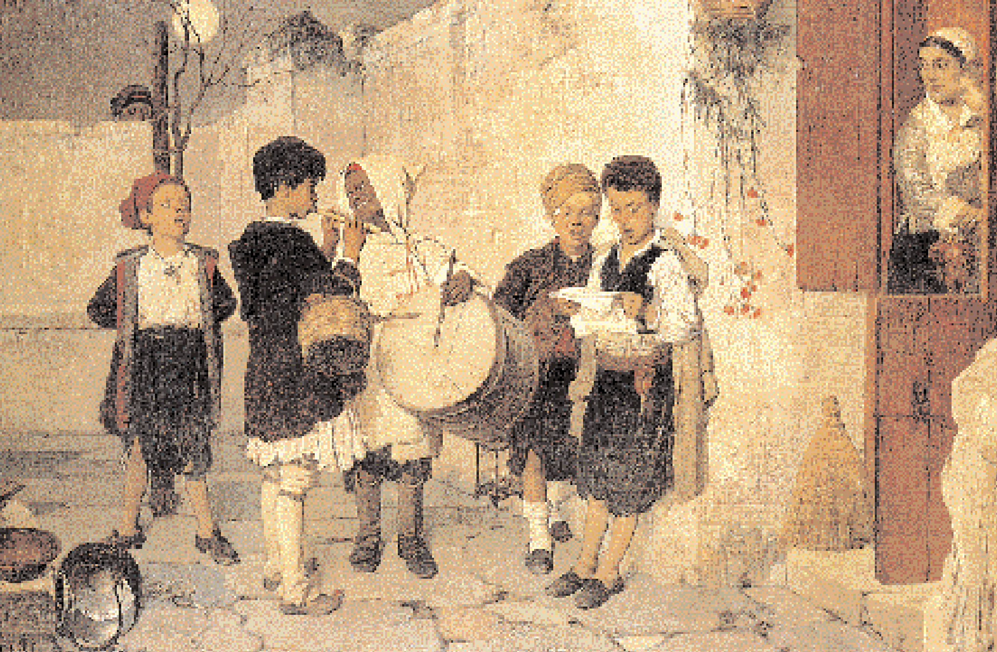
▲ Τα Κάλαντα. Ελαιογραφία του Νικηφόρου Λύ- τρα, τέλη 19ου αιώνα. Ιδιωτική συναλλογή.

Η Ηθογραφία και, βέβαια, οι γιορτές του Δωδεκαημέρου, στρέφουν τη σκέψη στον «άγιο των γραμμάτων» μας και γενάρχη των πεζογράφων μας, τον Αλέξανδρο Παπαδιαμάντη, που έχει γράψει γύρω στα είκοσι διηγήματα, αν τα μέτρηση σωστά, για τις μεγαλύτερες γιορτές της Χριστιανοσύνης. Απ' αυτά, τα δεκαπέντε αναφέρονται ευθέως στα Χριστούγεννα, και θα ήμασταν έξω από το κλίμα των ημερών αν δεν τον αναφέραμε.