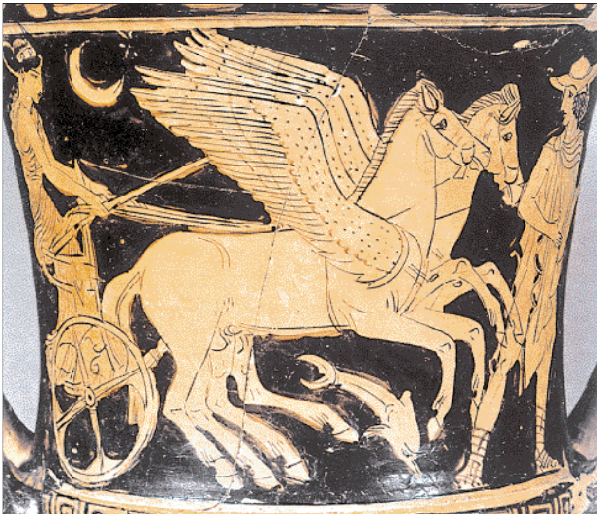
◀ Η Σελήνη ανατέλει από τη θάλασσα οδηγώντας το άρμα της. Μπροστά της λάμπουν ένας μηνίσκος και ένα άστρο. Ερυθρόμορφος κρατήρας του 4ου αι. π.Χ. Αθήνα, Εθνικό Αρχαιολογικό Μουσείο.