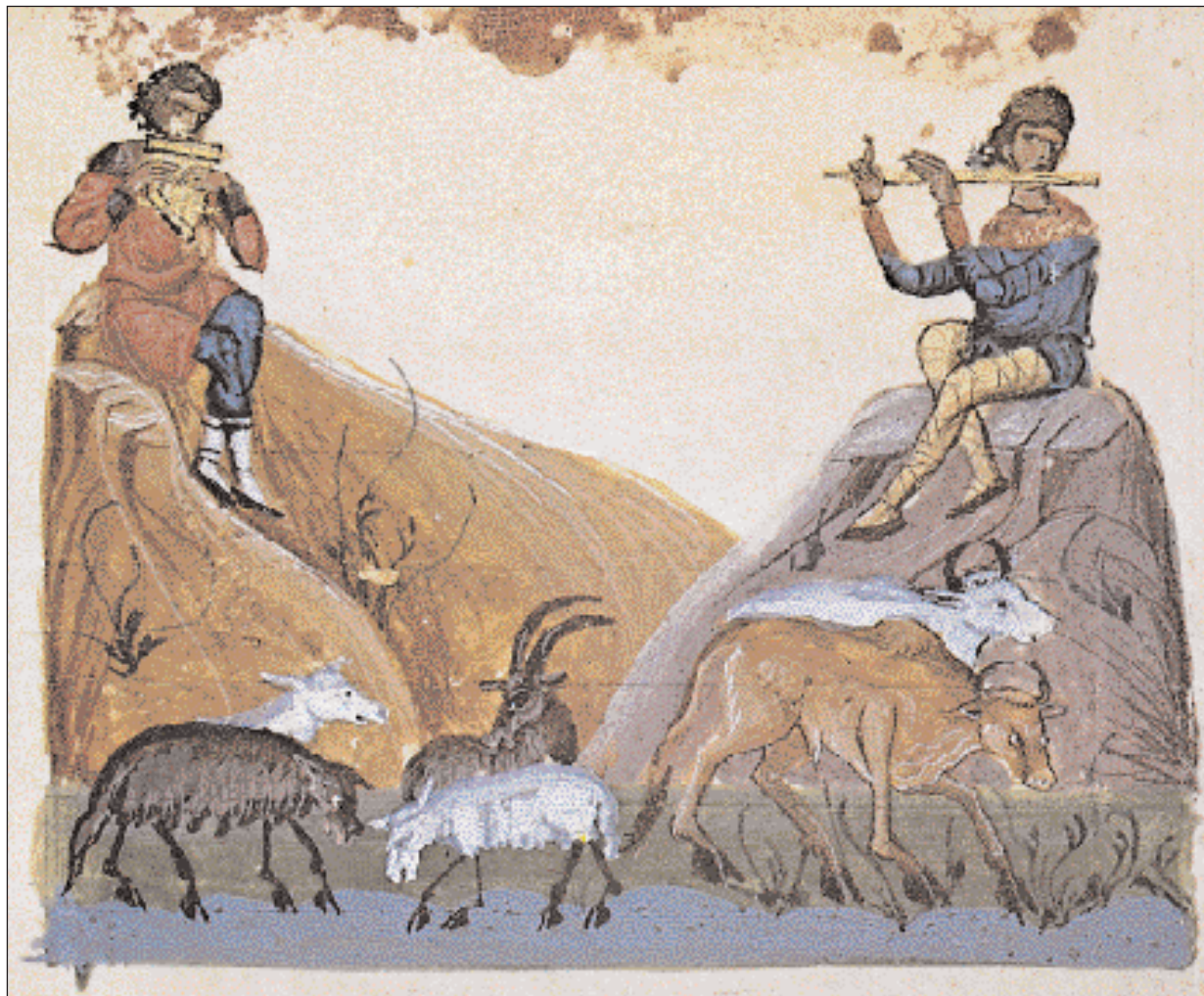
▶ Ποιμενική σκηνή. Μικρογραφία σε χειρόγραφο του 11ου αιώνα. Πατριαρχική Βιβλιοθήκη Ιερουσαλήμ.