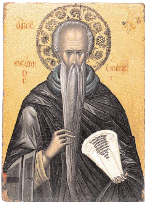
◀ Αγιος Ευθύμιος ο Μέγας. Εικόνα τον 17ο αι. Αγιον Ορος, Μονή Διονυσίου (πηγή: «Θησαυροί του Αγίου Ορους». Θεσσαλονίκη 1997).

ρισε διάδοση μια αίρεση σύμφωνα με την οποία ο Χριστός ήταν άλλος πρι ν και άλλος με τ ά τη γέννησή του. Η Δ' Οικουμενική Σύνοδος, το 450 στη Χαλκηδόνα, απέρριψε την αίρεση αυτή και απεφάνθη, μεταξύ άλλων, ότι ο Χριστός είναι ένας και ο αυτός, πριν και μετά τη γέννησή του. Επίσης, ότι μετά την ενανθρώπιση του υπάρχει σε δύο φύσεις, πάντοτε ταυτοχρόνως ξεχωριστές και ενωμένες, άρα ασύγχυτες, άτρεπτες και αδιαίρετες.