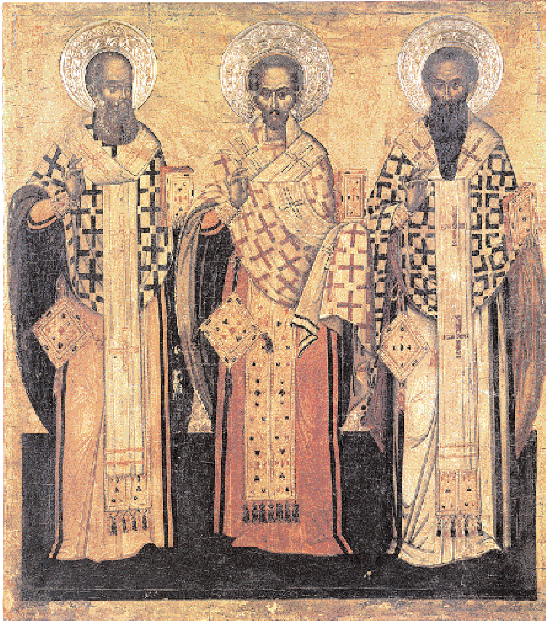
▲ Γρηγόριος Ναζιανζηνός, Ιωάννης Χρυσόστομος, Μέγας Βασίλειος, οι Τρεις Ιεράρχες. Εικόνα του Ιερεμία Παλλαδά, πρώτο μισό του 17ου αι. Πάτιμος, Μονή Ζωοδόχου Πηγής (πηγή: «Οι Θεοάντροι της Μονής Πάτιμου». Εκδοτική Αθηνών, 1988).