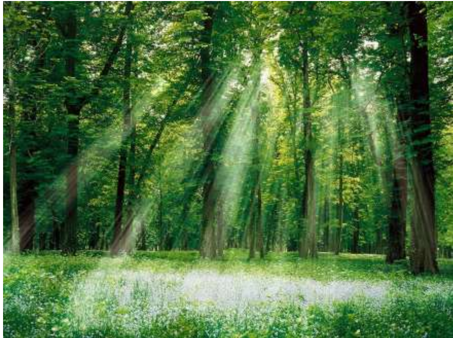
Τα δάση και τα φυτά