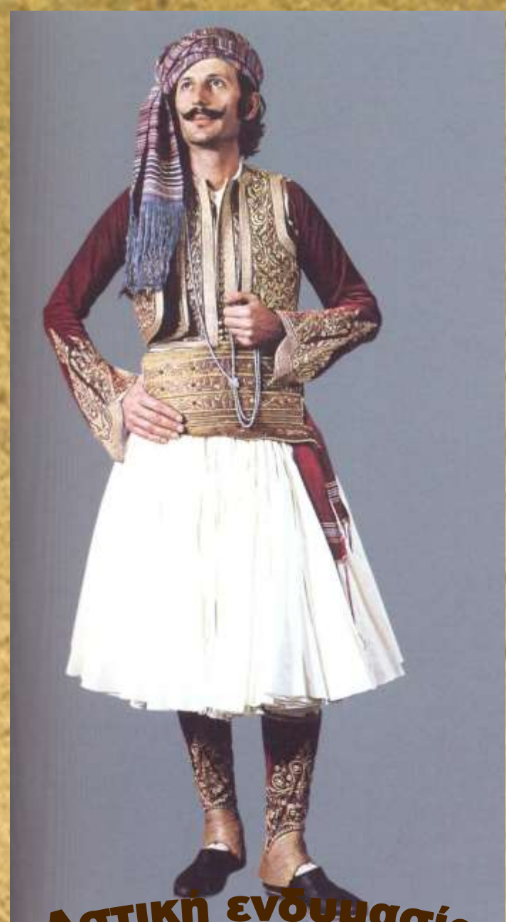
Αστική ενδυμασία (επί Καποδίστρια)