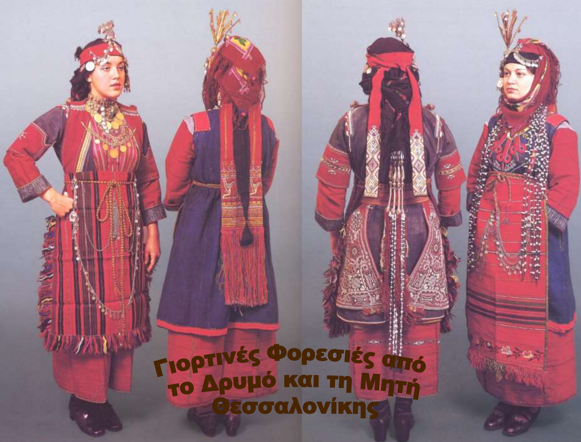
Γιορτινές Φορεσιές από το Δρυμό και τη Μητή Θεσσαλονίκης