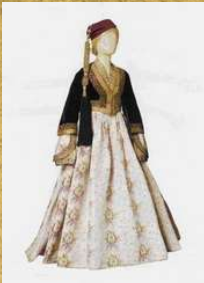
Αστική φορεσιά "Αμαλία", 19ος αι.