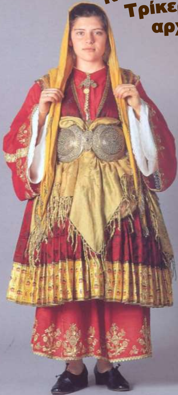
Νυφική Φορεσιά από το Τρίκερι Μαγνησίας, αρχές 20ου αι.