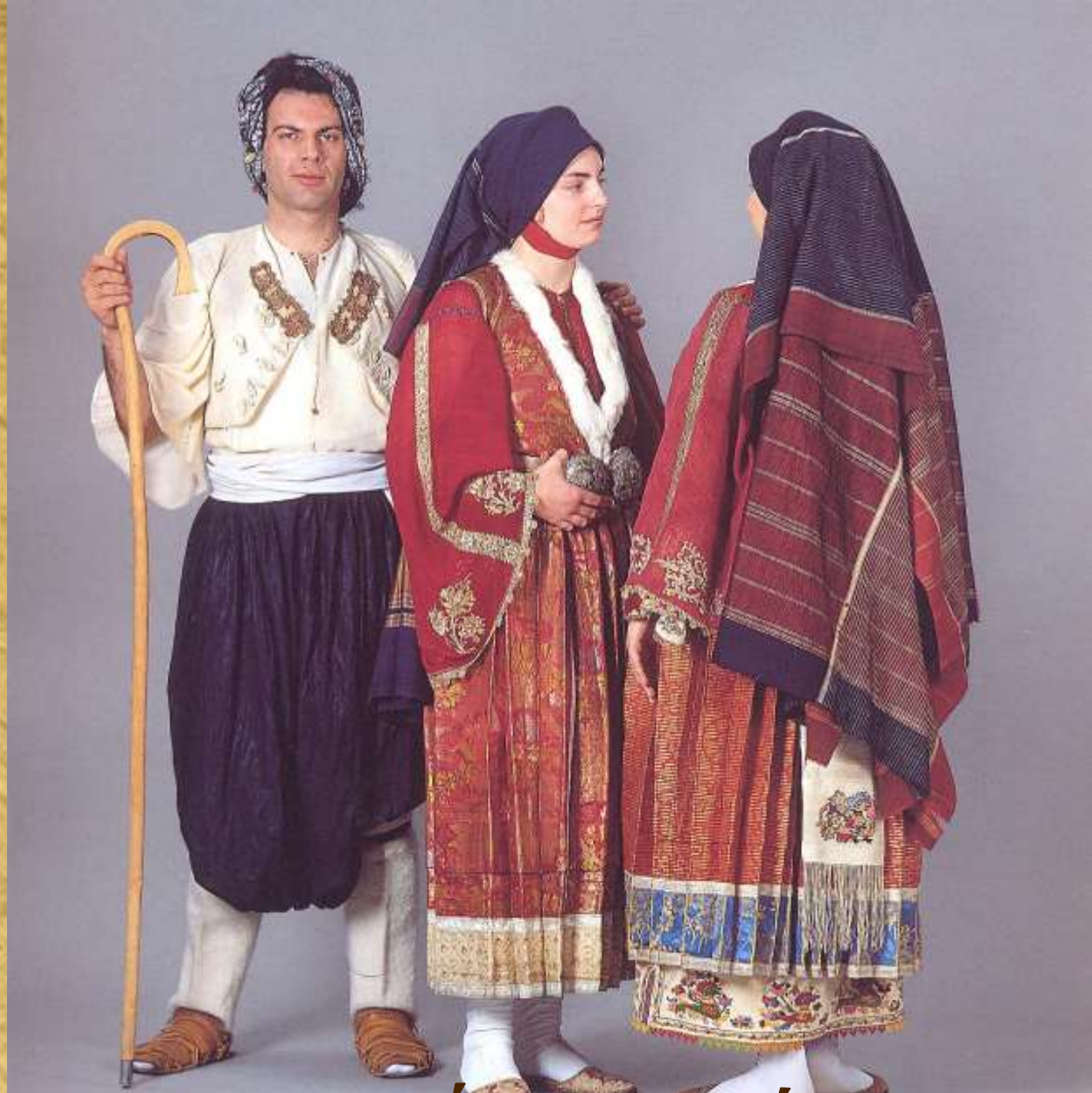
Αντρική & γυναικεία φορεσιά της Σκύρου, τέλος 19ου αι.