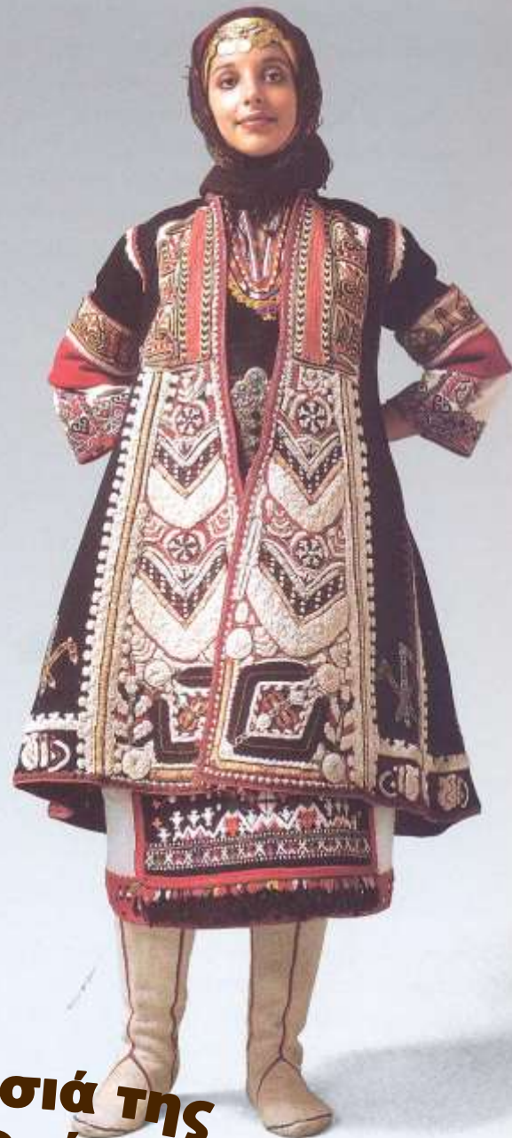
Νυφική Φορεσιά της Ανατολικής Θράκης