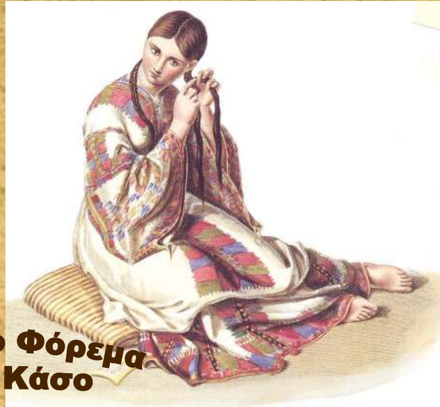
Ολόκέντητο Φόρεμα από την Κάσο