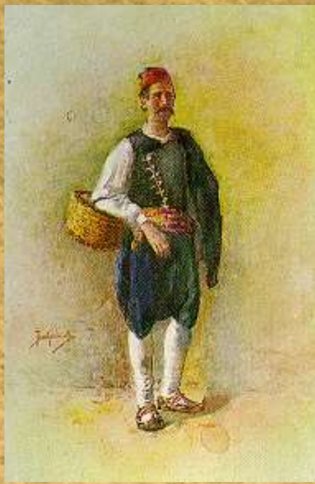
Γυναικεία & Αντρική φορεσιά από την Κέρκυρα