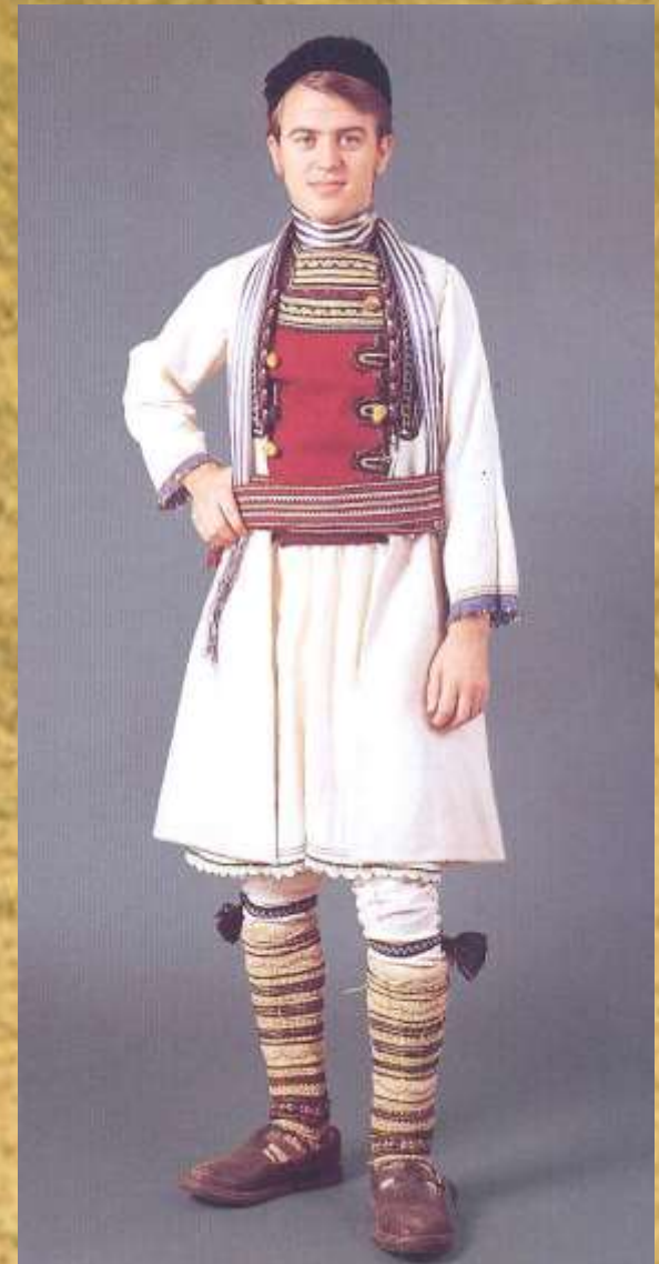
Βλάχος από την Προσοτσάνη Δράμας