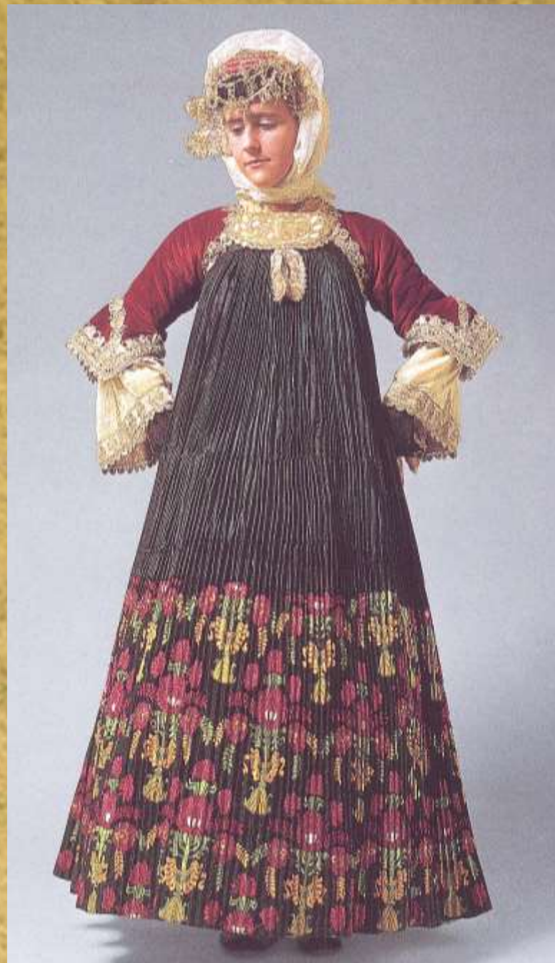
Φορεσιά της Σκοπέλου, 20ος αι.