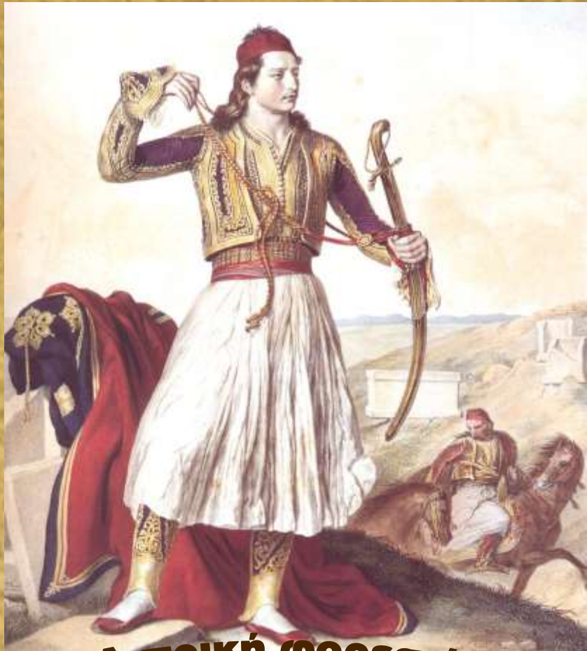
Αντρική φορεσιά (μακριά φουστανέλα) (αγωνιστής 1821)