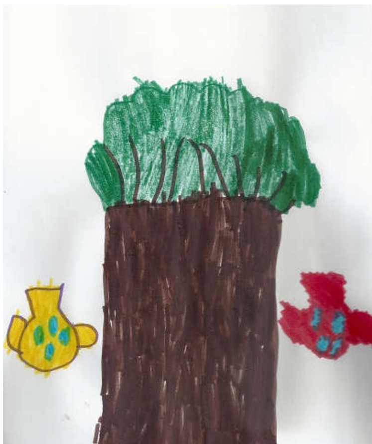
Έπαιξαν γέλασαν χόρεψαν και τραγούδησαν όλες μαζί ώσπου ξαφνικά ένιωσαν να στριφογυρίζουν στον αέρα...