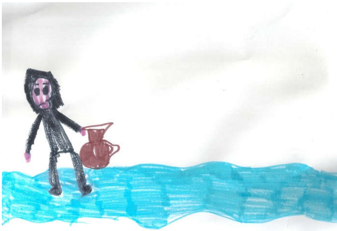
Η παρέα με τις σταγονίτσες κρύφτηκε σε ένα από αυτά μαζί με άλλες σταγόνες.