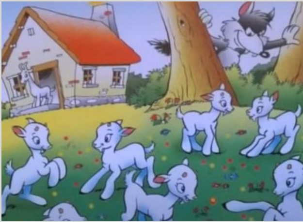
Ο λύκος και τα οκτώ κατσικάκια