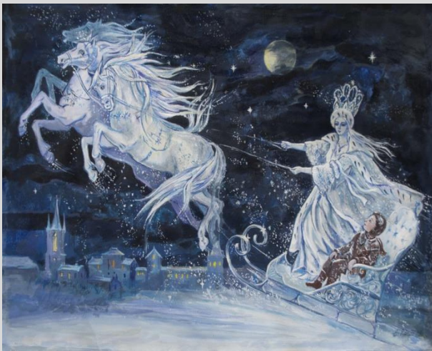
Η βασίλισσα των πάγων