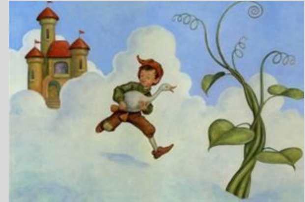
Ο Μιχάλης και η ντοματιά