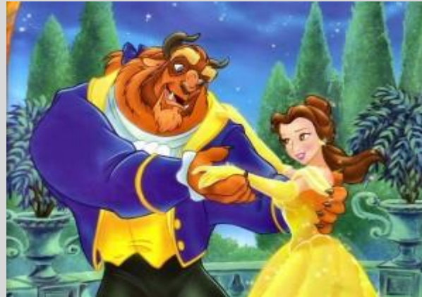
Η όμορφη και ο γίγαντας