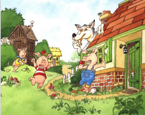
Τα τρία λυκάκια

Σου λέω ένα τίτλο γνωστό και συ διορθώνεις το ψέμα που θα πω.