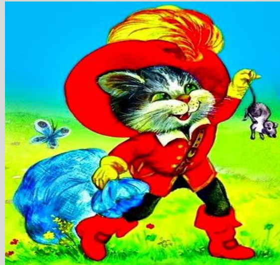
Ο αδέσποτος γάτος