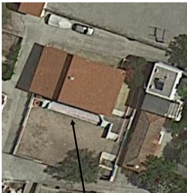
Μονοθέσιο Νηπιαγωγείο Πέρδικας

Νηπιαγωγοί: ΜΠΡΟΥΦΑ ΜΑΡΙΝΑ, ΠΛΑΤΑΝΙΤΗ ΑΣΠΑΣΙΑ