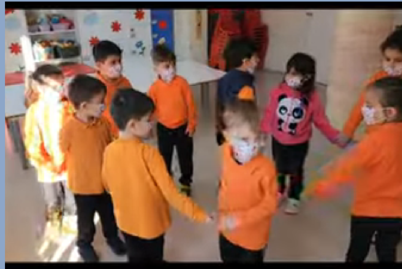
“η πένσα” (τούρκικο)