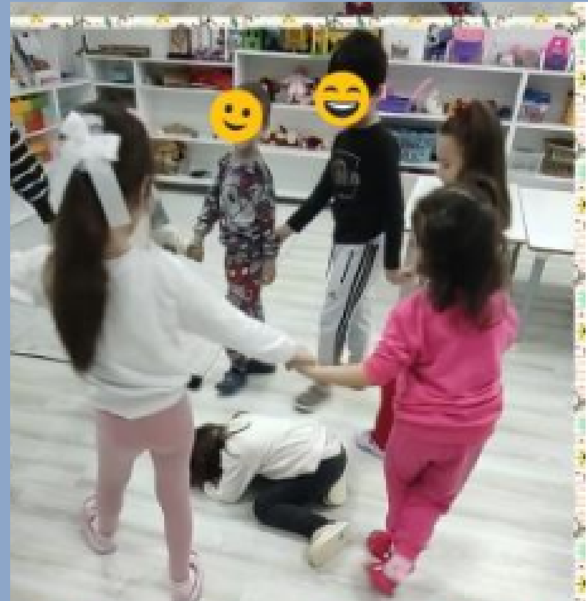
“παλιό μαξιλάρι” (Λιθουανίας)