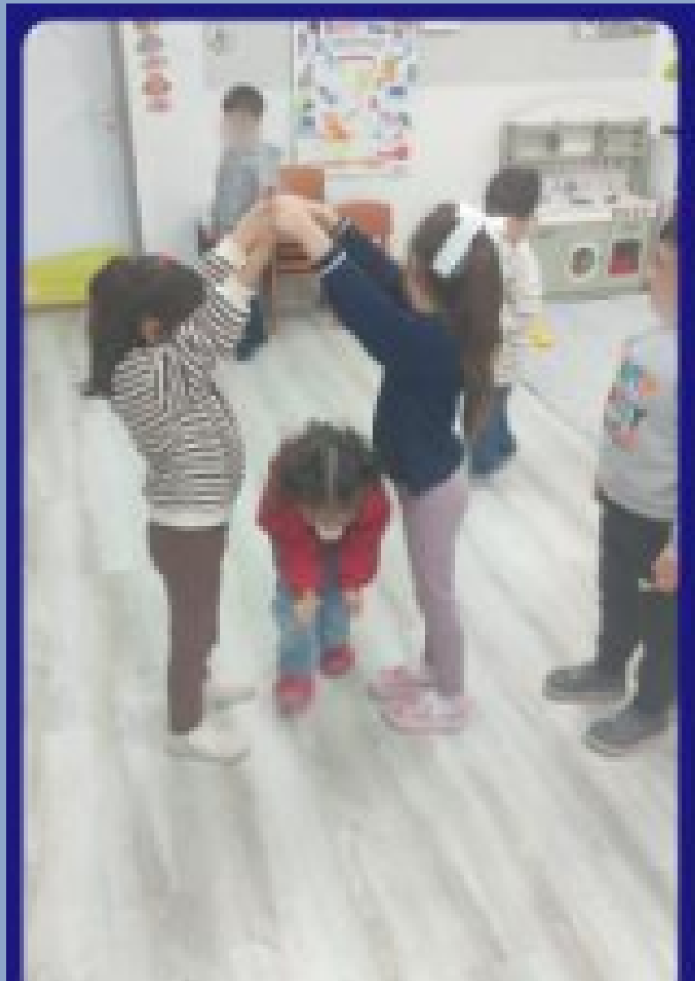
“περνά-περνά η μέλισσα”