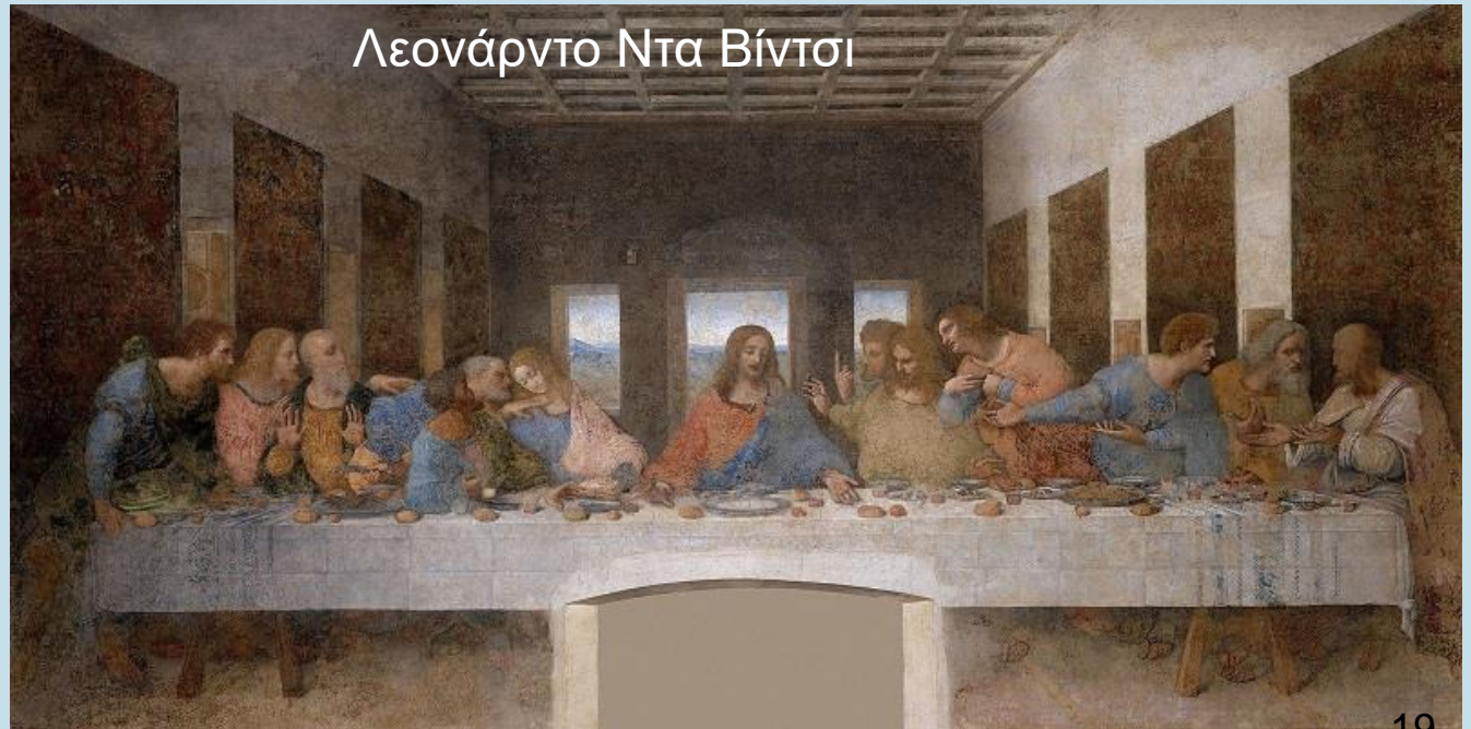
Λεονάρντο Ντα Βίντσι

Την ημέρα αυτή γίνεται ο Μυστικός Δείπνος, όπου ο Ιησούς κοινωνεί τους μαθητές του, δίνοντάς τους από ένα κομμάτι ψωμί, που συμβολίζει το σώμα του και κρασί, που συμβολίζει το αίμα του.