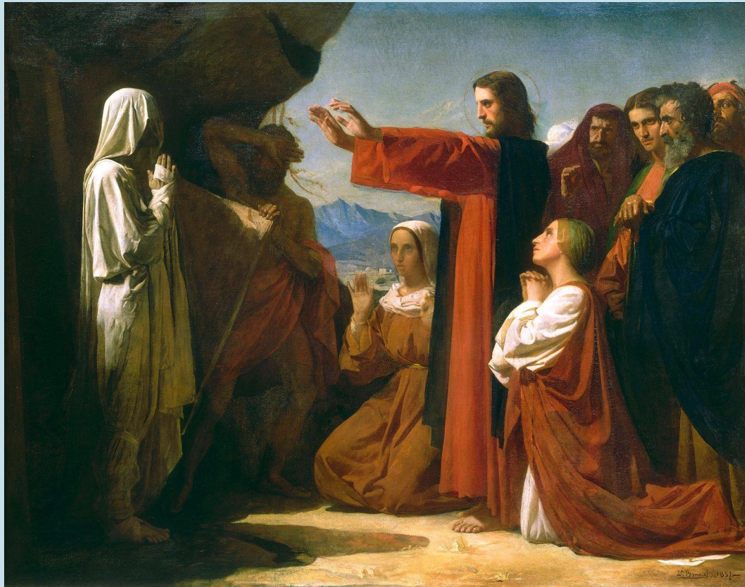
Η Ανάσταση του Λαζάρου, πίνακας του Leon Bonnat, Γαλλία, 1857.